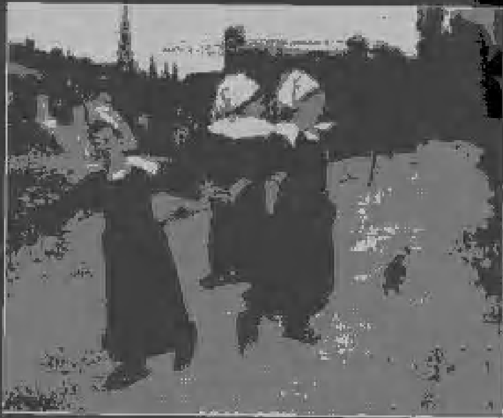
Breton Girls Dancing, Port-Aven. 1888, Oil on Canvas.