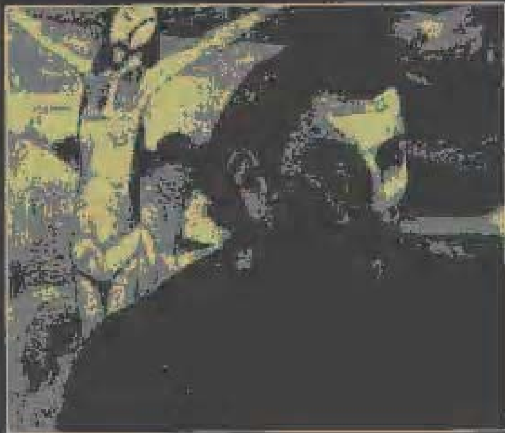
Self-Portrait with yellow christ [1889-90, Oil]