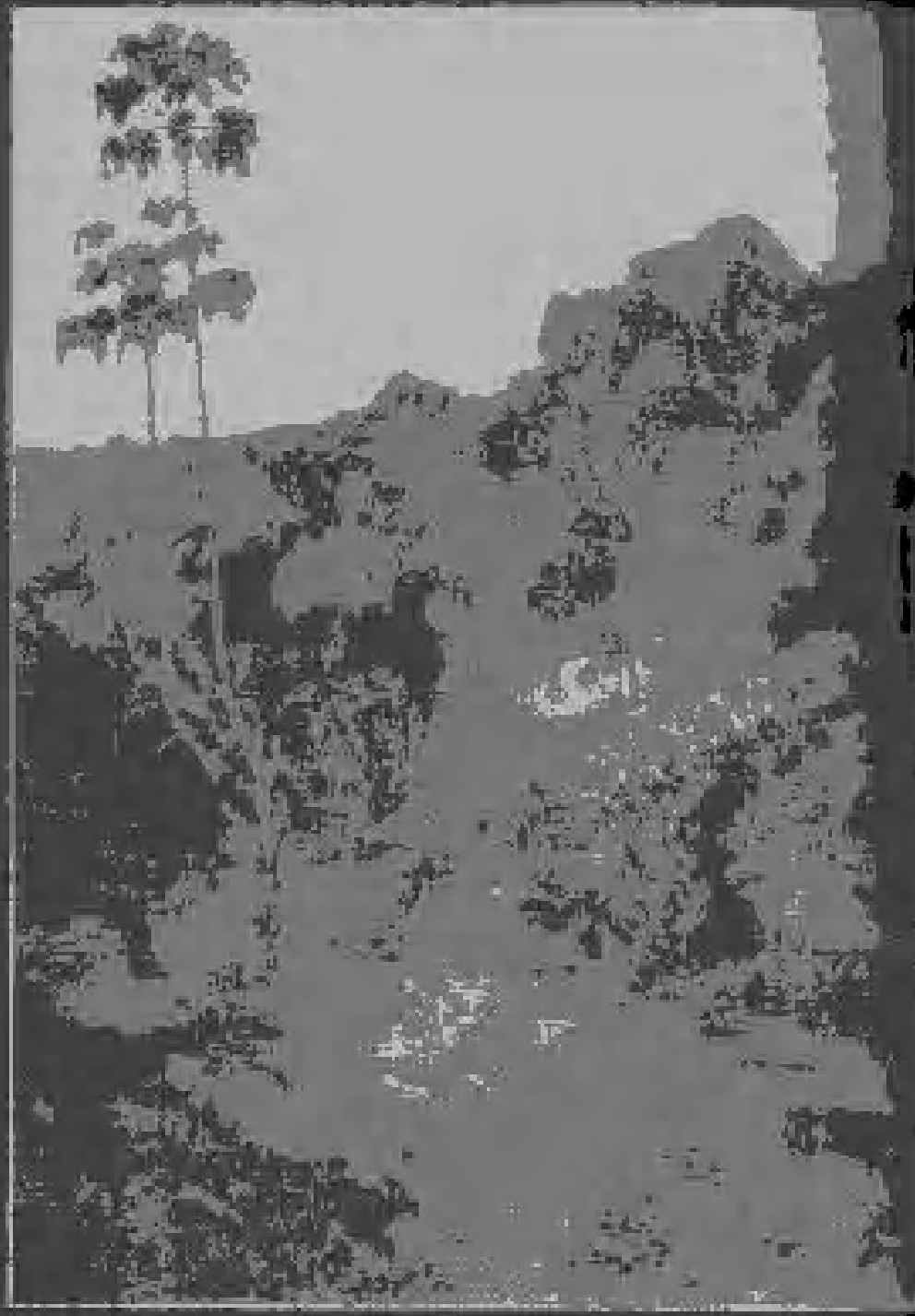
Tropical Vegetation 1887. Oil on Canvas.

အနုပညာရဲ့ အမြင့်ဆုံးအောင်မြင်မှုဟာ သဘာဝကို အမှန်ကန်ဆုံး တင်ပြခြင်းပဲ။