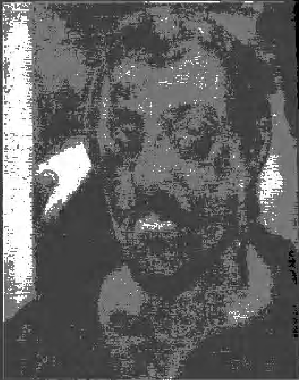
Gauguin, Self-portrait, 1888, Oil (Pushkin State Museum of Fine Art)