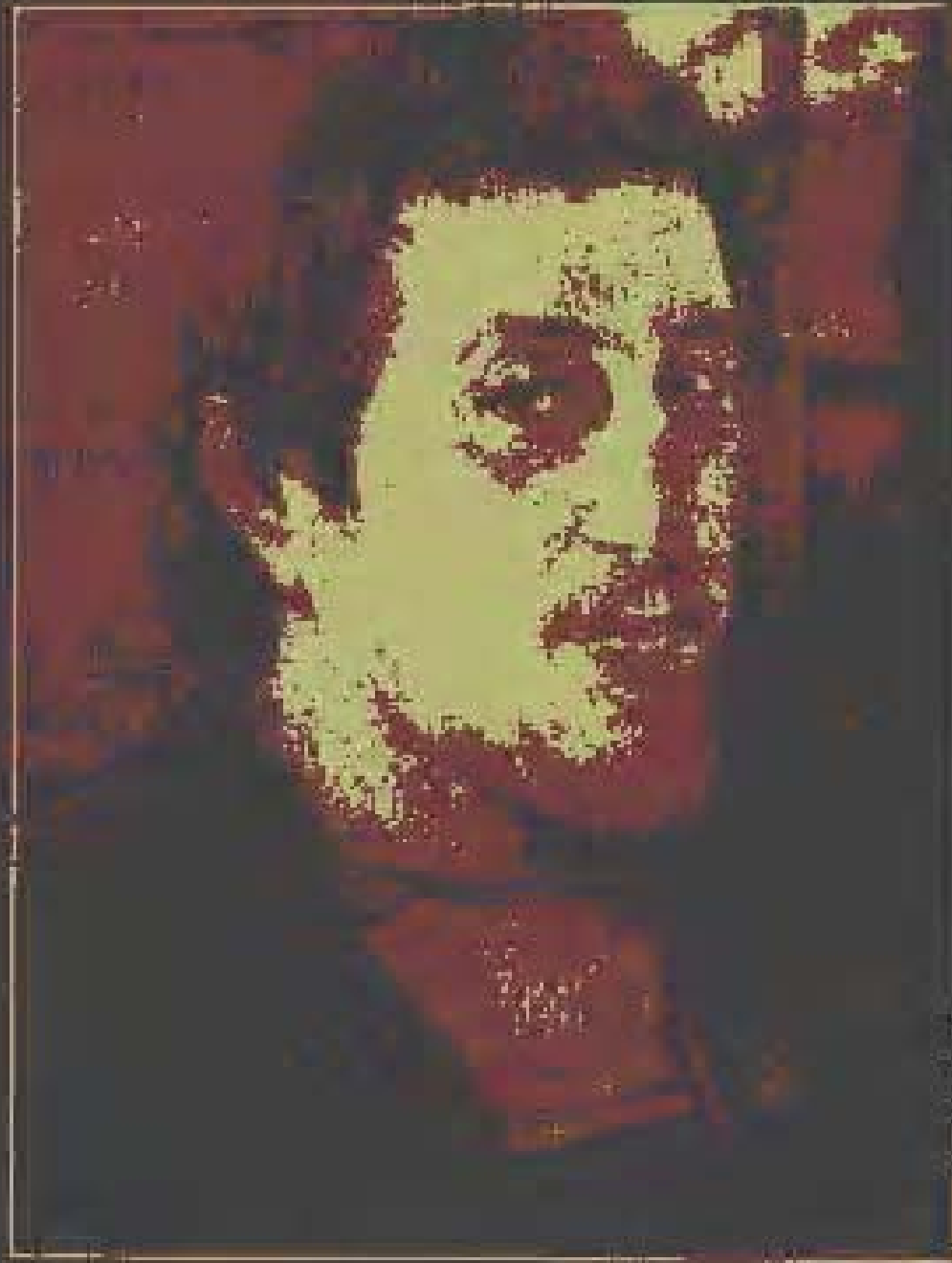
Self Portrait for picture 1980-01 in C. U. S.