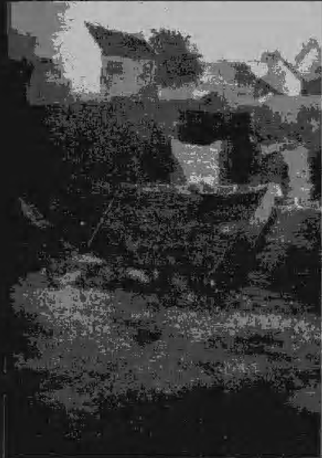
Landscape 1897, Oil