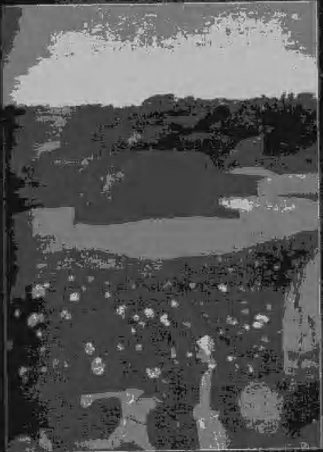
Tahiti Science 1889, Oil