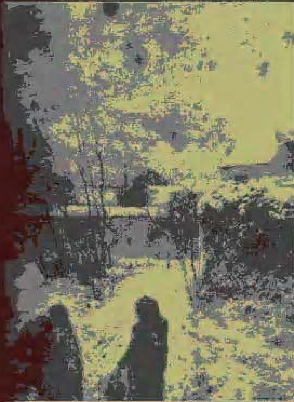
Snow Scene 1883. Oil on Canvas.