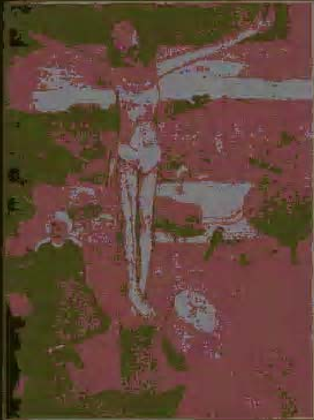
Yellow Christ 1889. Oil on Canvas.