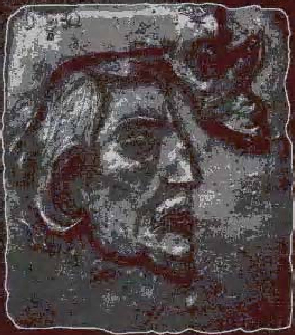
Self Portrait, Ovir 1894, Bronze.