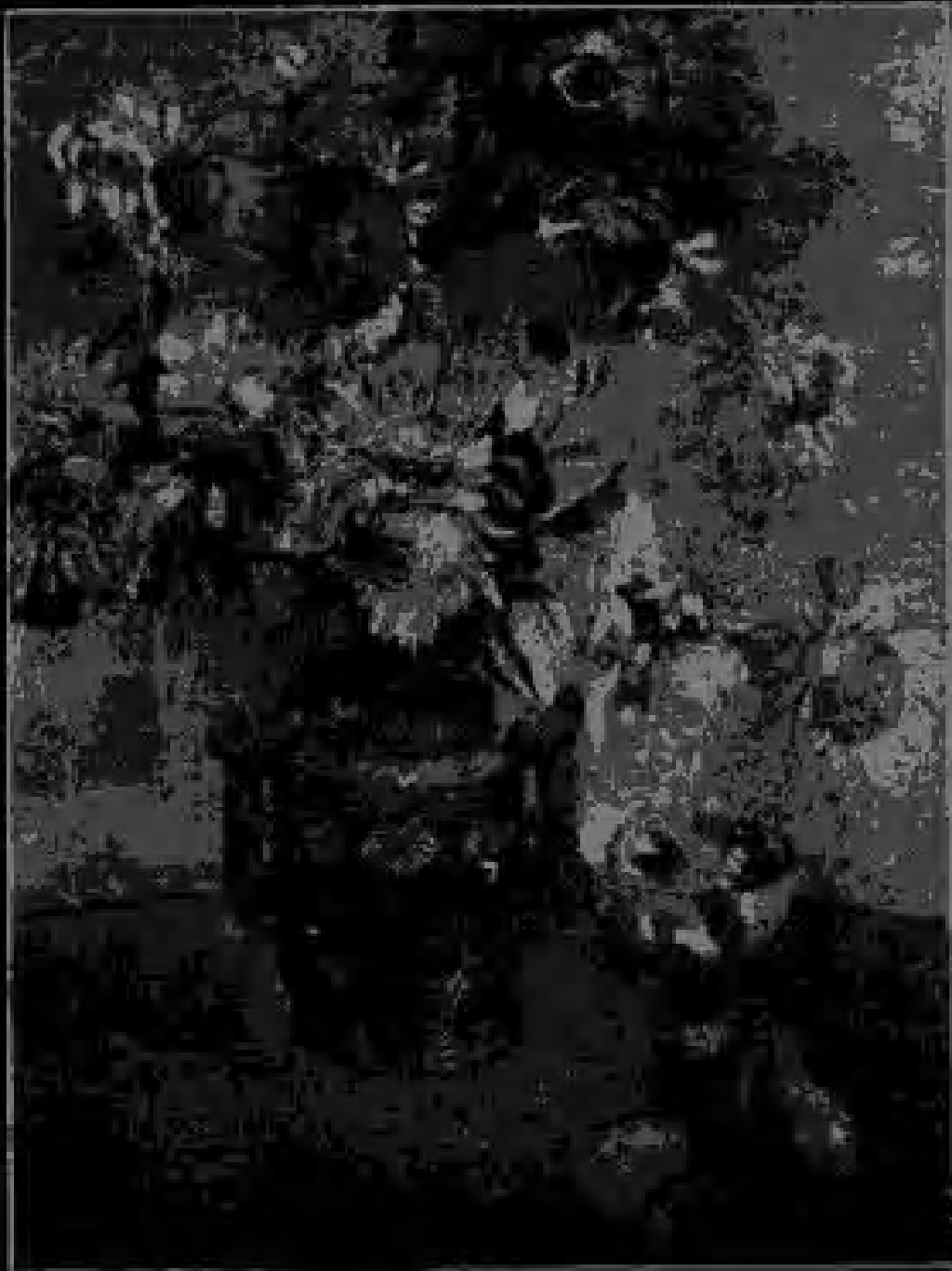
Still Life with Sunflowers and Mangoes 1901 - Chit-thi Chit-thi