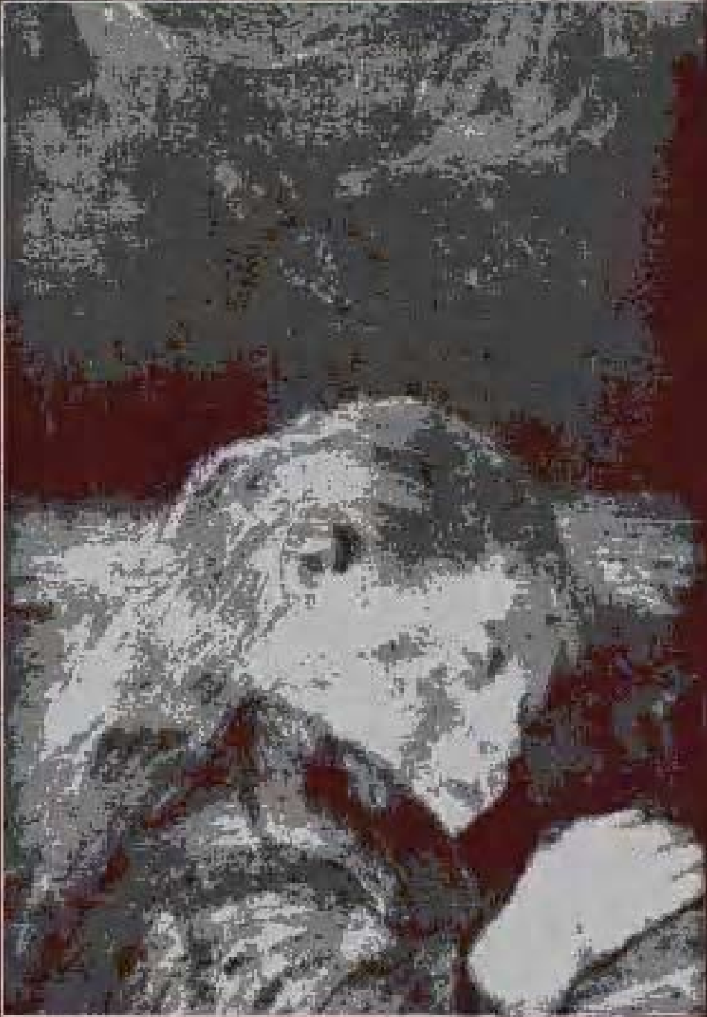
Sleeping child 1884. Oil on Canvas