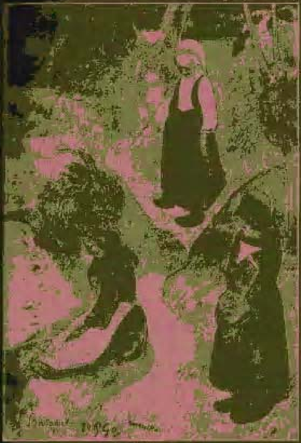
In Brittany. 1889 Water colour,