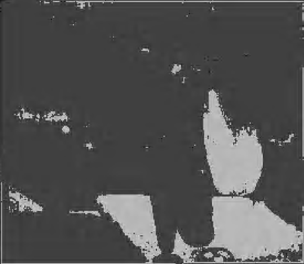
At the Cafe 1888. Oil on Canvas