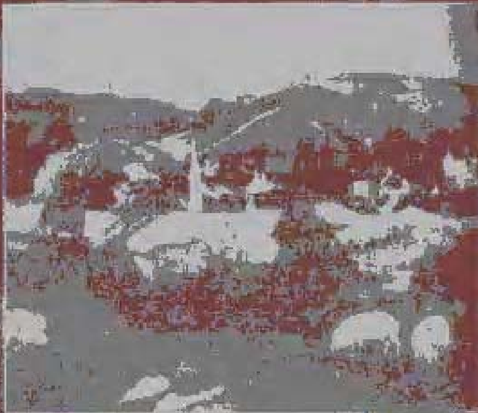
Breton Peasant with pigs 1888, Oil on Canvas