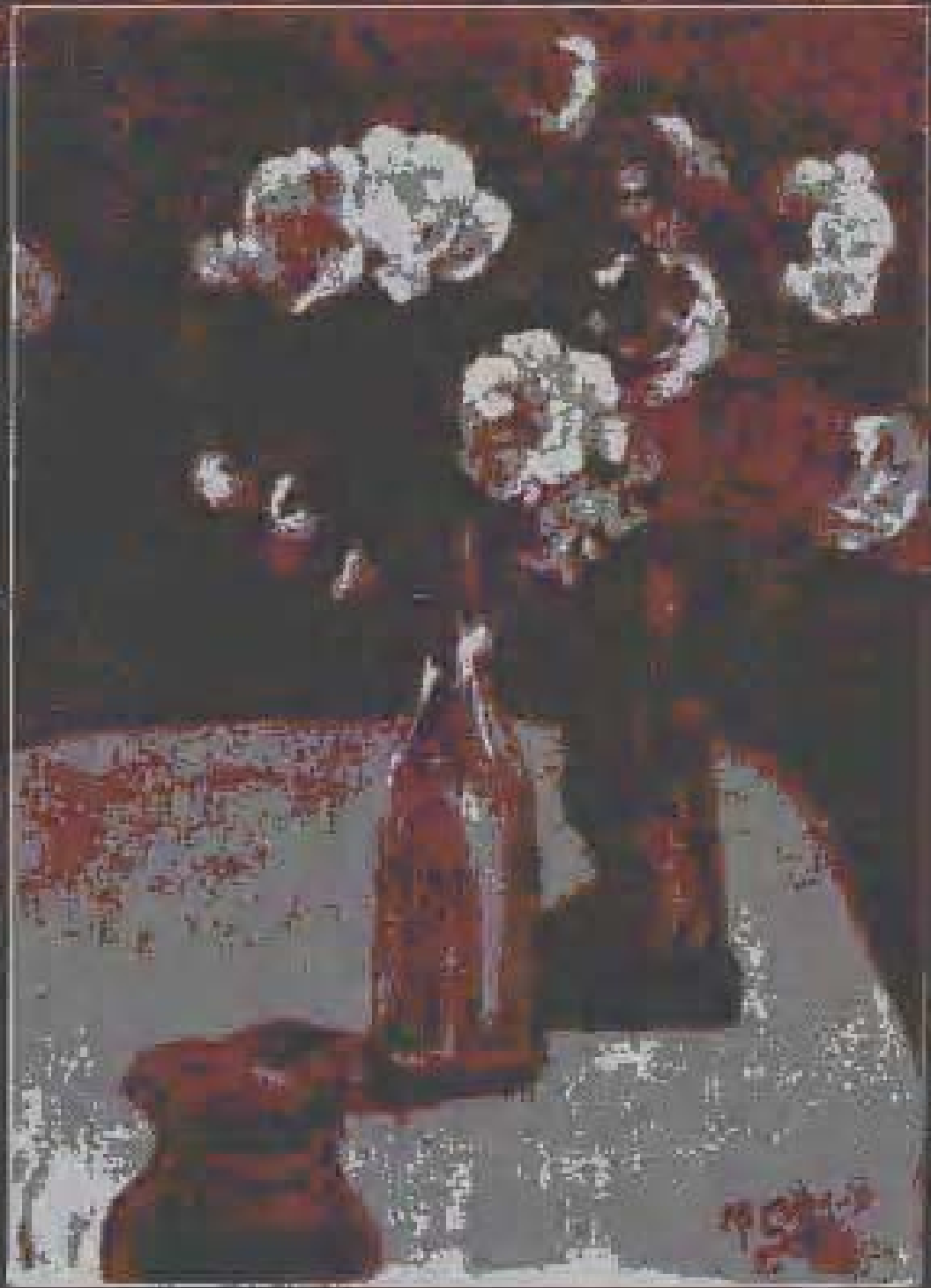
Roses and Statvette 1990, Oil on Canvas