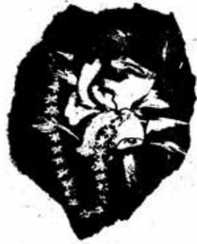
ဘာဆိုလို့လဲ

အထွန်းက ကျေနပ်ပြုံးကလေးပြုံးကာ မျက်လုံးကို ပြန် မှိတ်ထားလိုက်လေ၏။ အော်... တကယ်ဆိုတော့ ကြီးဒေါက် သည် သံယောဇဉ် ကြိုးတွေကို လွတ်အောင် မရုန်းနိုင်ပါ ကလား။