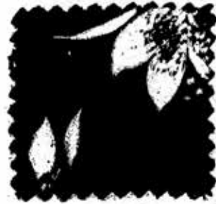
စိတ်တစ္ဆေ

ကရုဏာလေပြေသည် မေတ္တာရနံ့ကို သယ်ယူခဲ့၍ အခန်း တွင်းတွင် အေးမြပျံ့သင်း သွားစေပါပြီလေ။