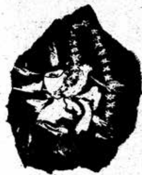
သမုဒ္ဒရာနှင့် ရေစက်ငယ်

‘ကို’က အားပါးတရ ပြောလိုက်ပါသည်။ အတယ်ကြောင့် ဆိုသော် ကျွန်မတို့ကားပေါ်တွင် ဝက်သားအတို့နှင့် ခြေချင်း တွဲကာ ကြိုးချည်ထားသော ကြက် သုံးကောင်က အခန့်သား ရောက်နေသောကြောင့်ပင်။