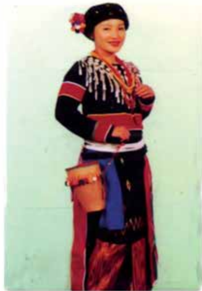
လာချိဒ်အမျိုးသမီး ဝတ်စုံ

လာချိဒ်အမျိုးသမီးများ၏ ဝတ်စားဆင်ယင်မှုတွင် “ပျပ်စိပ်” ခေါ် လွယ်ခြင်းငယ်ကိုလည်း လွယ်ပိုးထားလေ့ရှိသည်။ ၎င်းလွယ် ခြင်းငယ်မှာ ရှေးယခင်က တောင်ပေါ်တွင် ပေါက်သည့် “မောင်” ခေါ် ဝါးတစ်မျိုးဖြင့် နှီးဖြာရက်လုပ်ထားပြီး “ဂင့်ချယ်” ခေါ် ကြိမ်တစ်မျိုးဖြင့် အချောသပ်ပြီး ရက်လုပ်ထားကြသည်။