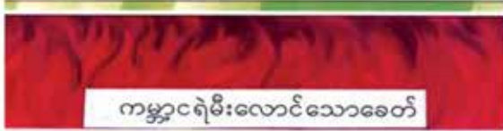
ကမ္ဘာငရဲမီးလောင်သောခေတ်