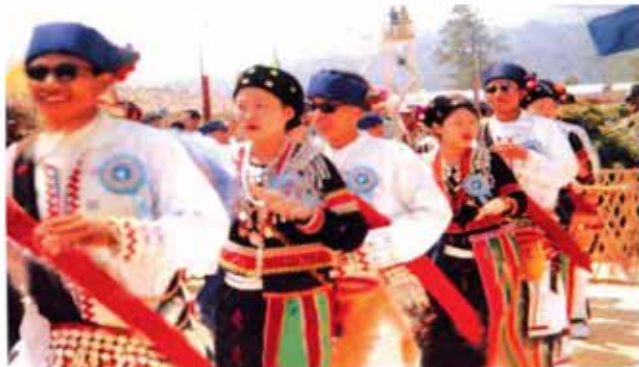
လာမြုံ့ဂျီအကခေါ် နှစ်သစ်ကူးအက

နှစ်ဟောင်းကုန်၍ နှစ်သစ်လွန်မြောက်သောကာလ ရွက်ဟောင်း ညှာကြွေ ရွက်သစ်ဝေသောကာလတွင် ပန်းတွေ ဝေစီဖူးပွင့်ပြီးဖြစ်