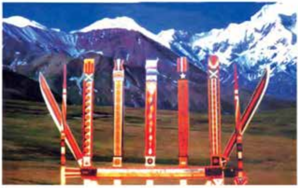
လာချိန်တို့မနောတိုင်

နေရာတွင် သက်တန်ပုံကို ရေးဆွဲထားသည်။ တတိယနေရာတွင် ရေးဆွဲထားသော လိပ်ပြာများ၊ ပုစဉ်းကောင်ကလေးများ၏ မြူးထူး ပျံဝဲနေသော သဏ္ဍာန်ကို ဆောင်သည်။ ၎င်းအောက်တွင် လင်းကွင်းပုံကို ရေးဆွဲထားသည်။