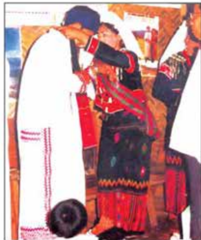
သတို့သမီးက သတို့သားအား ရိုးရာလွယ်အိတ် ဆင်ယင်ပေးပုံ

မှ ရိုးရာနတ်ကို ဝက်သတ်၍ ပူဇော်ရသည်။ သတို့သမီး၏ ရိုးရာနတ်ကိုလည်း ကျွဲသတ်၍ ပူဇော်လေသည်။ ၎င်းနောက် သတို့သားဘက်နှင့် သတို့သမီးဘက်မှ အပြန်အလှန်ပစ္စည်းများ လဲလှယ်ကြသည်။