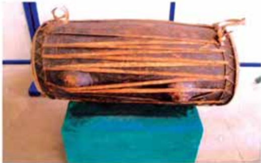
မနောစည်တော်

တိုင်များ၏ ဘေးတစ်ဘက်တစ်ချက်စီတွင် စိုက်ထူထားသော မခုတ် ဓားနှင့် မထိုးလုံ၏အဓိပ္ပာယ်သည် ကျရောက်လာမည့် အန္တရာယ် ကို ကာကွယ်ရန်ဖြစ်သည်။ မနောတိုင်အောက်ခြေတွင် အောက်ချင်း ငှက်ပုံသဏ္ဍာန်ရေးဆွဲထားသော သစ်သားပြားရှိသည်။ သစ်သား ပြားထိပ်တွင် အောက်ချင်းငှက်ပုံဆွဲထားပြီး အဆုံးတွင် အမြီးပုံဆွဲ ထားသည်။ အလယ်တွင် မောင်းထားသောဘက်၌ တိရစ္ဆာန်များ ပုံဆွဲပြီး ဘေးနှစ်ဘက်တွင် ဝတ်ရေး၊ ဆင်ရေး၊ လူနေမှုစနစ်ကို သရုပ်ဖော်ထားပြီး စည်ထားသောဘက်၌ သီးနှံပင်ပုံများ ရေးဆွဲ ထားသည်။ အောက်ချင်းငှက်ပုံ ရေးဆွဲထားခြင်းမှာ အောက်ချင်း ငှက်ကဲ့သို့ ပျံနေသော ကမ္ဘာဖြစ်သည်ဟု ဆိုလိုခြင်းဖြစ်သည်။