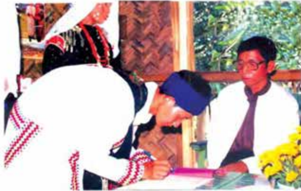
သင်းအုပ်ဆရာကြီးရှေ့၌ သတို့သားက ကတိဝန်ခံလက်မှတ်ထိုးပုံ