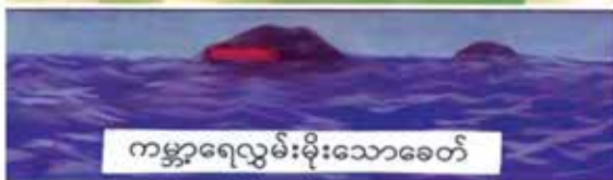
ကမ္ဘာရေလွှမ်းမိုးသောခေတ်