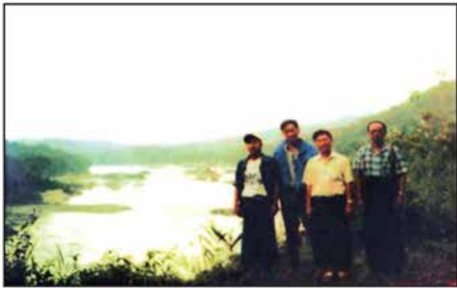
မေခမြစ်တစ်နေရာ၌ စာရေးသူနှင့်အဖွဲ့ အမှတ်တရ

အောင်ဆန်း၏ ပြည်ထောင်စုလွတ်လပ်ရေး ကြီးပမ်းရာတွင် လာချိန် မျိုးနွယ်စုမှ မျိုးချစ်ခေါင်းဆောင်များဖြစ်သော ဝဏ္ဏကျော်ထင် ဒူဝါမတောင်ခေါင်းဆောင်ဆရာကြီး ဆောင်ချန်းရုန်းတို့သည် ပင်လုံစာချုပ်ဖြစ်မြောက်ရေးတွင် ပါဝင်ခဲ့ကြသည်။ ဤအချက်များကို ကြည့်ခြင်းအားဖြင့် လာချိန်တိုင်းရင်းသားတို့သည် သူရသတ္တိနှင့် ပြည့်စုံသူများဖြစ်ကြောင်း သိရှိရသည်။