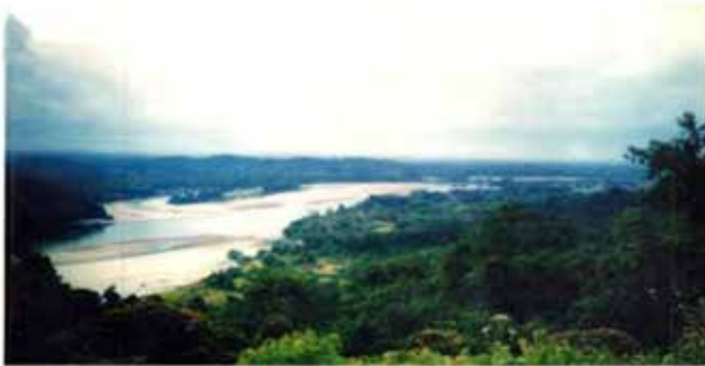
ပြောင်းပြန်စီးသော ငေါ့ချန်းမြစ်

အရှေ့မြောက်ဘက် ဆာဂျန်တောင်တန်း၊ ဖိမော်တောင်တန်းတို့တွင် မြစ်ဖျားခံပြီး မြောက်မှတောင်သို့ စီးဆင်းလာခဲ့သော်လည်း ချီဖွေ မြို့နယ်၊ ချပ်မော၊ လန်းယန်ရွာများမှစ၍ တောင်မှမြောက်သို့ စတင် စီးဆင်းသွားသည်။ ၎င်းနောက် ဆော့လော်မြို့နယ်အတွင်း ရှိဆိုင်၊ မျောချောင်း၊ ကျီးရှင်၊ ခပတ်၊ လခမ်၊ ကျီးထန်စသည့် ကျေးရွာဒေသ များကို ဖြတ်ကျော်စီးဆင်းပြီး မယော်ရွာအနီးတွင် မေခမြစ်ထဲသို့ စီးသွားသည်။ ငေါ့ချန်းခမြစ်၏ တောင်မှမြောက်သို့ စီးဆင်းခဲ့သော မြစ်ကြောင်းအရှည်မှာ (၄၁) မိုင် (၃) ဖာလုံရှိကြောင်း သိရသည်။ ဆော့လော်မြို့နယ်အတွင်း၌ တောင်မှမြောက်သို့ ပြန်စီးဆင်းရာ တွင် ငေါ့ချန်းမြစ်၏ စီးဆင်းပုံမှာ အင်္ဂလိပ်အက္ခရာ ယူပုံသဏ္ဍာန် ဖြစ်သည်။ ငေါ့ချန်းမြစ်သည် ဆော့လော်မြို့နယ်အတွင်း မယော် ရွာခရီးတွင် မေခမြစ်ထဲသို့ ပြန်လည်စီးဆင်းသည်။