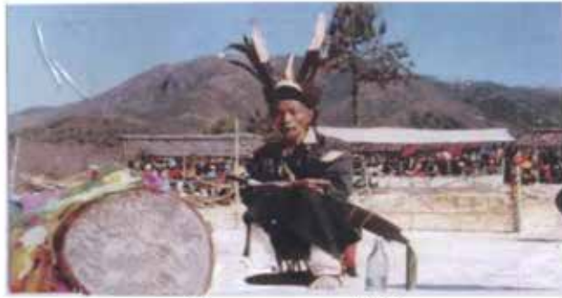
နတ်ဟောဆရာတစ်ဦးပုံ

ကောက်ပဲသီးနှံများ ကြီးထွားလာချိန်၌ လိုက်နာရမည့် စည်းကမ်း အယူအဆများရှိသည်။ တောင်ယာသို့ သွားခါနီး၌ နတ်ဟောဆရာမှ ပူဇော်ပြီး အိမ်ရှင်မမှ စိုက်ပျိုးမည့် မျိုးကောင်းကို ရွေးရာ ဖက်ထုံးဗေဒင်ဖြင့် စိုက်ပျိုးမည့်သူကို စတင်စိုက်စေသည်။ ၎င်းနောက် တောင်ယာမှ အပြန်တွင် ခေါင်ရည်တစ်ခွက်စီ သောက်ပြီး စကားမပြောရန်နှင့် မိမိနေအိမ်ရောက်လျှင် ခေါင်ရည် ထပ်မံသောက်၍ စကားပြောနိုင်သည်ဟု ဆိုသည်။ အဘယ်ကြောင့် ဆိုသော် စပါးများ အလေအလွင့်မရှိစေရေး၊ သီးနှံများ မမြို့ရေး တို့အတွက်ဟု ဆိုသည်။ ပေါ်ဦးပေါ်ဖျား သီးနှံများဖြင့် နတ်ကို ပူဇော် လေ့ရှိသည်။ သီးနှံများ ရိတ်သိမ်းပြီးသည့်အခါ နှစ်ပတ်လည် ချိန်၌ ပြန်လည်ရိတ်သိမ်းမည်ဟု သီးနှံကို ကိုင်၍ တိုင်တည်ပြီး ချီးမွမ်း စကားပြောလေ့ရှိသည်။