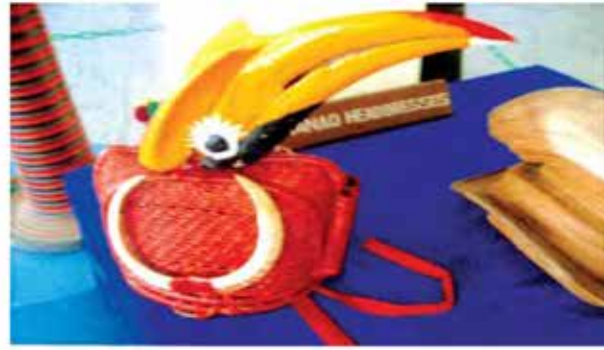
မနောဦးဆောင်း

လာချိဒ်တိုင်းရင်းသားများသည် ရှေးယခင်က နတ်ကိုးကွယ် သူများဖြစ်၍ နတ်ပူဇော်သည့်အခါ နတ်ဆရာများက နတ်ရိုးရာ ဝတ်စုံကို ဝတ်ဆင်ပြီး နတ်ဦးဆောင်းကို ဆောင်းကြရသည်။