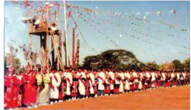
ဇောဓိပွဲတော်၌ကလေးရှိသော ဇောဓိဂေါအက

ကကွက်ကဟန်များမှာ အားလုံးအတူတူပင်ဖြစ်သည်။ ဇောဓိဂေါ အကကိုကရာတွင် အားလုံးသော အမျိုးသား အမျိုးသမီးများသည် ရိုးရာဝတ်စုံကို ဝတ်ဆင်ပြီးမှသာ ကရသည့် အကဖြစ်ပေသည်။