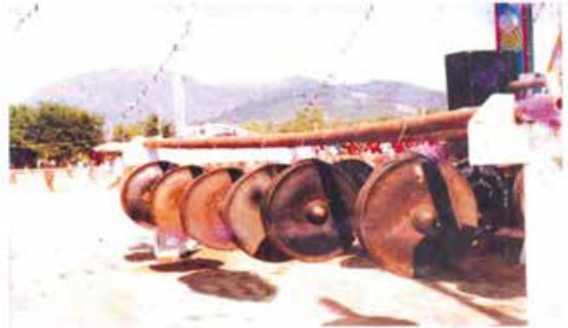
မောင်းများချိတ်ဆွဲထားပုံ

သည့်အဓိပ္ပာယ်ဖြစ်လေသည်။ ကကွက်မှာ “ပိတ်ကိုင်း” ခေါ် ခုန်ဆွ ခုန်ဆွဟန်ပန်မြူးကြွ ကကွက်ကဟန်များ ဖြစ်သည်။ မောင်းကို တစ်ချက်ချင်းစီ ဖြည်းဖြည်းမှန်မှန်ထု၍ လင်းကွင်းကို တစ်ချက်ချင်း ဖြတ်၍ ဖြတ်၍ တီးပြီးကရသော အကဖြစ်သည်။ ဂျမန်ဂေါအကကို ကပြီးသည့်အခါ အခြားမည်သည့် အကများကိုမှ ဆက်လက်ကခွင့် မရှိတော့ချေ။