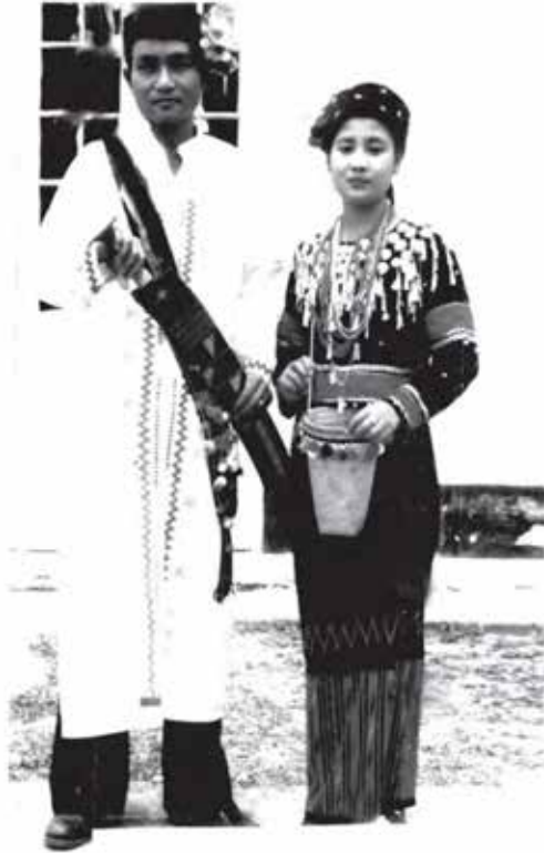
လာချိဒ်အမျိုးသားနှင့် အမျိုးသမီး