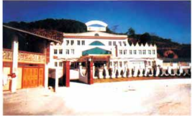
ပန်ဝါမြို့ကျက်သရေဆောင် ပန်ဝါဟိုတယ်

ဇမ္ဗူငြိမ်းစေတီတော်၊ ထေရဝါဒဗုဒ္ဓဘာသာဘုန်းတော်ကြီးကျောင်း၊ ခရစ်ယာန်ဘုရားရှိခိုးကျောင်း၊ အထကခွဲကျောင်းတို့