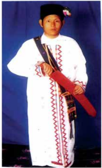
လာချိဒ်အမျိုးသား ဝတ်စုံ

လာချိဒ်အမျိုးသားများ၏ “အုပ်ထက်” ခေါ် ခေါင်းပေါင်းမှာ အနက်ရောင်ဖြစ်ပြီး အလျား လေးလံ၊ အနံ လေးလက်မခန့်ရှိသည်။ အနံတစ်ပေကို သုံးခေါက်ခေါက်ထားသည်။ ယခုအခါ အလျားတစ်လံမျှသာရှိပြီး ခေါင်းပေါင်းကို လက်ယာရစ်ပေါင်းကာ ဝဲဘက်စွန်းတွင် ခေါင်းပေါင်းစကို ချကြသည်။ “ဘန်ဘိုး” ခေါ် ရောင်စုံပန်းဖွားများ တပ်ဆင်ချုပ်လုပ်ထားသည်။ ရှေးအခါက လာချိဒ်တိုင်းရင်းသားများသည် တောတောင်ထဲတွင် တိုက်ခိုက်ရေး၌ လည်းကောင်း၊ သစ်ဝါးခုတ်ရာတွင်လည်းကောင်း ဓားကိုရွယ်၍