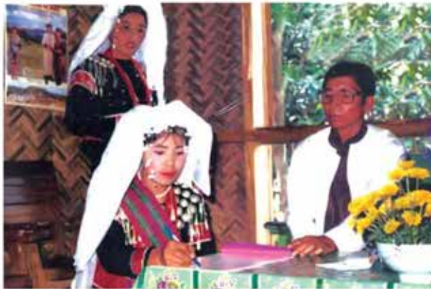
သင်းအုပ်ဆရာကြီးရှေ့၌ သတို့သမီးက ကတိဝန်ခံလက်မှတ်ထိုးပုံ

နှင့် လွယ်အိတ်ကို သိုင်းဆင်ပေးရသည်။ ၎င်းနောက် ရာသက်ပန် ခိုင်မာသော အိမ်ထောင်ဖြစ်ရန် ဘုရားသခင်ထံ ဆုတောင်းအပ်နံ့ ကြသည်။ သင်းအုပ်ဆရာရှေ့မှောက်တွင် သတို့သား၊ သတို့သမီး တို့ လက်မှတ်ရေးထိုးကြသည်။ ဘုရားကျောင်း၌ လက်ထပ်ပြီး နောက် ဧည့်သည်များကို အကျွေးအမွေးဖြင့် ဧည့်ခံကြသည်။