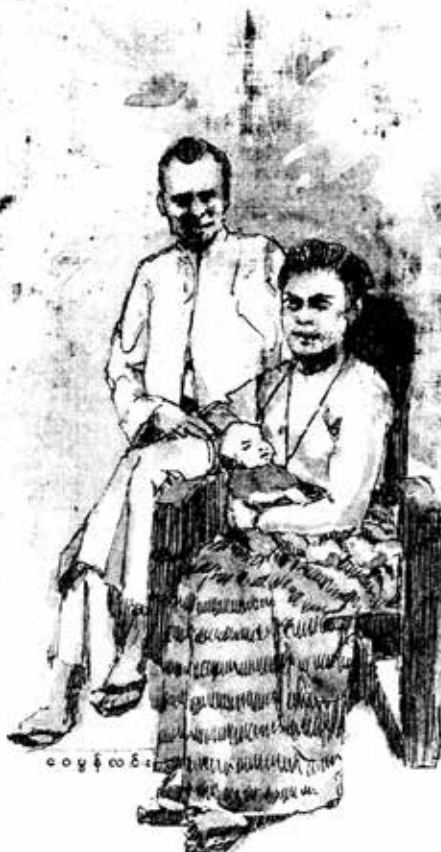
၀၀၄ နံလင်း

ဟောဒိတ်တား အောက်မှာ စီးဆင်းနေတဲ့ ယင်းချောင်းရေဟာ ဗိုလ်ချုပ် ဇာတိ နတ်မောက် ကိုဖြတ်ပြီးဆင်းလာတာ ပုပ္ဖားသက်ဆီက ကျလာတဲ့ ချောင်းသုံးချောင်းက နတ်မောက်ကြဲမှ ပေါင်းပြီး ယင်းချောင်းဖြစ်လာတာ။ ကိုယ့်စိတ်ထဲမှာ ဒီရေတွေဟာ ကိုယ့်ဗိုလ်ချုပ်ရဲ့ အသက်သွေးကြော တွေလို ထင်နေတယ်။ ဒီရေအလျဉ်တွေ မပြတ်စီးဆင်းနေ သလို ဗိုလ်ချုပ်ရဲ့ အသက်သွေးတွေလည်း စီးဆင်းနေတယ် လို့ထင်တယ်။