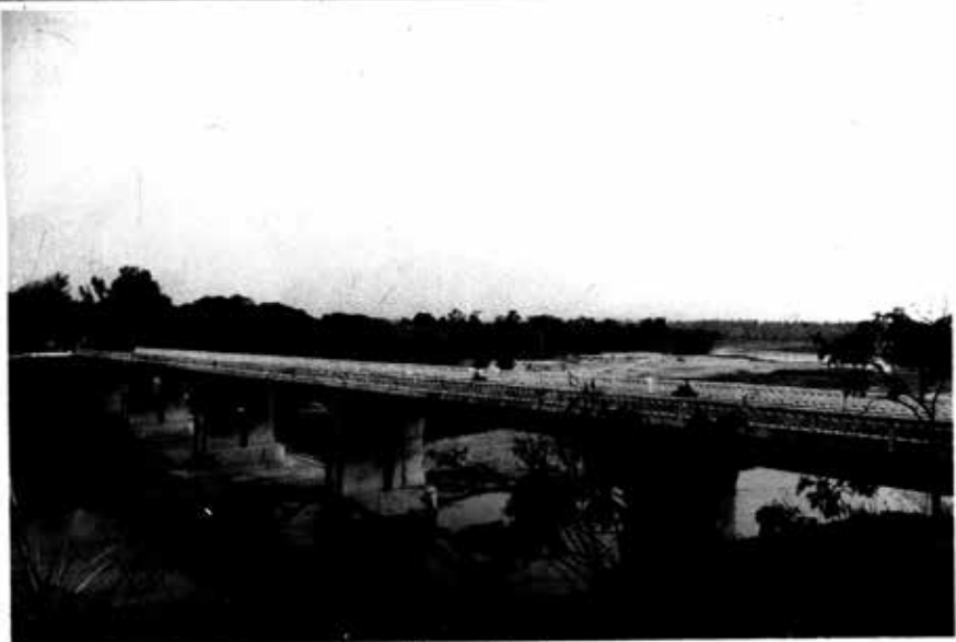
ယင်းချောင်းတံတား