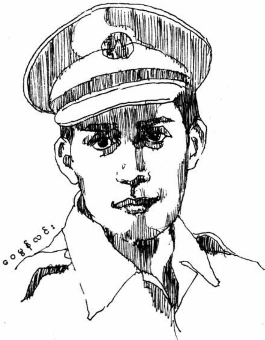
ဗိုလ်ထွန်းလှ(ခေါ်)တက္ကသိုလ်နေဝင်း