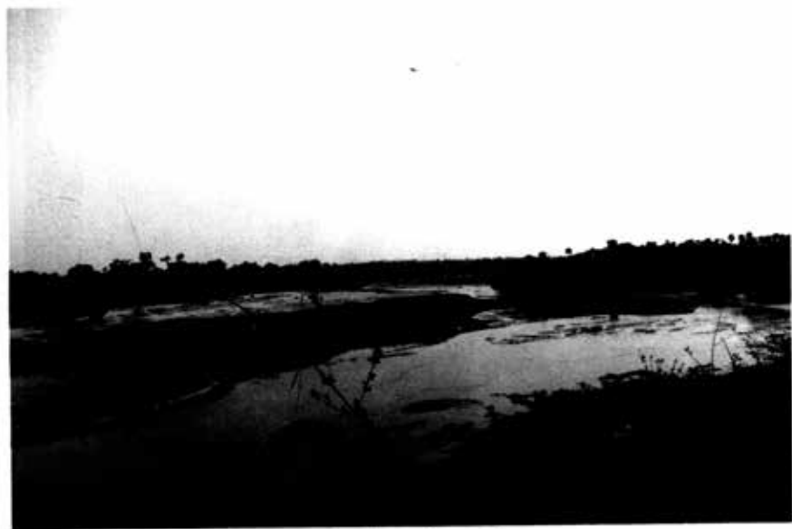
နေရာသီ ယင်းချောင်း