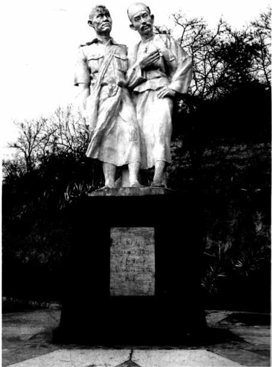
သခင်ဘိုးလှကြီးနှင့်ဂဠုန်ဆရာစံကျောက်ရုပ်တု