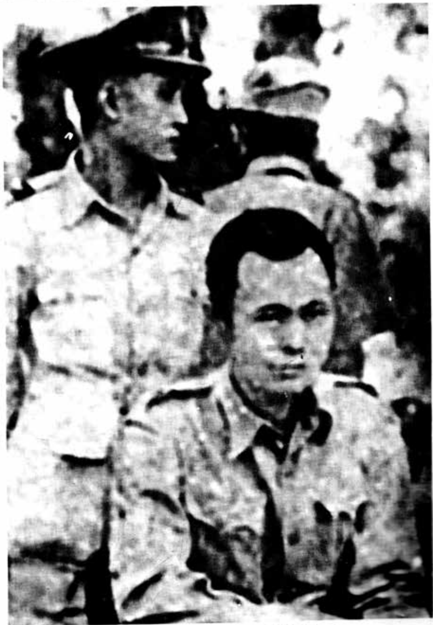
ဗိုလ်ချုပ်အောင်ဆန်းနှင့် အပါးတော်မြဲ ဗိုလ်ထွန်းလှ