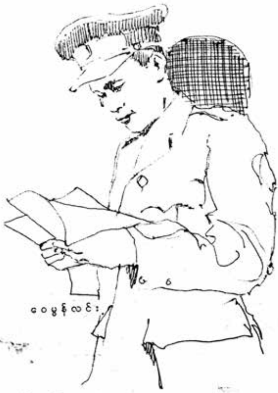
ဝေမွန်လင်း

လွတ်လပ်ရေးလိုချင်ရင် လွတ်လပ်ရေးရတဲ့ စည်းကမ်းညီညွတ်မှုတွေကို ထိန်းထားပါ။ ထူထောင်မှုကိုလုပ်ကြပါ။ အဲဒီလိုလုပ်ပြီးတဲ့နောက် ရှေ့ကို လွတ်လပ်ရေးအရသာကို ခံစား စံစားချင်တယ်ဆိုရင် အလုပ်လုပ်ကြဖို့ အလုပ် လုပ်တဲ့နေရာမှာ စည်းကမ်းရှိဖို့ ပြင်ဆင်သင့်တာတွေကို ပြင်ဆင်ဖို့၊ ခင်ဗျားတို့သောက်ကျင့်တွေကို ပြင်ဆင်ဖို့လိုနေပြီလို့ ကျွန်တော်ပြောခဲ့မယ်”