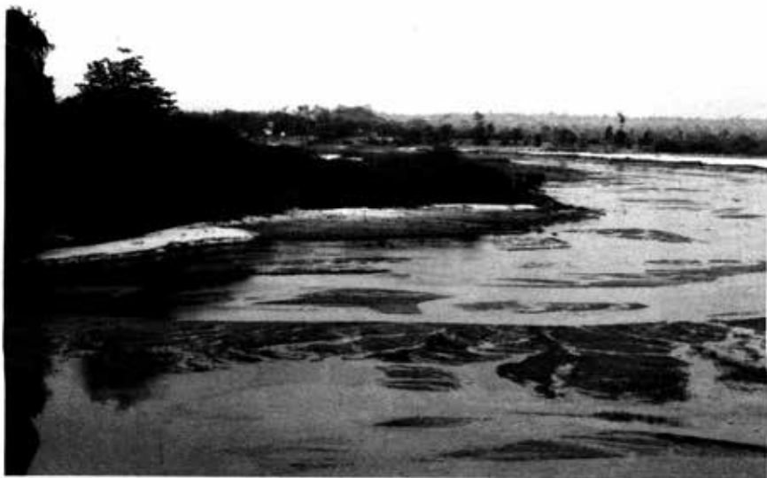
နွေရာသီ ယင်းချောင်း