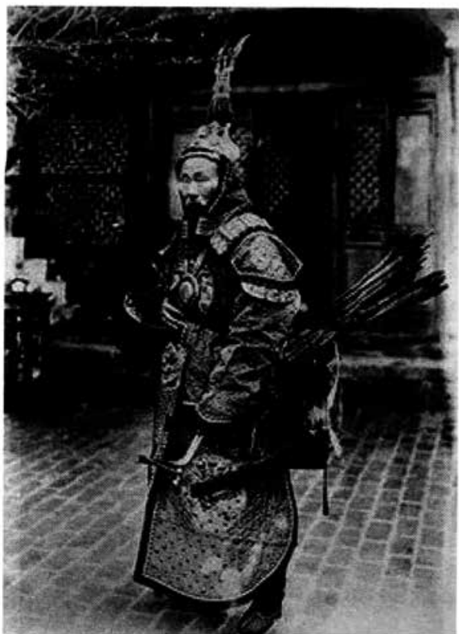
ချင်မင်းဆက်ခေတ် မန်ချူးစစ်သူကြီးတစ်ဦး။