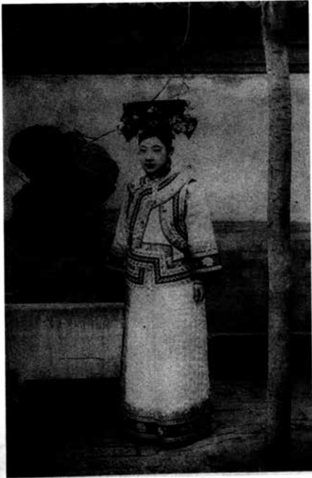
ချင်မင်းဆက်ခေတ် မန်ချူးမင်းသမီးတစ်ပါး။