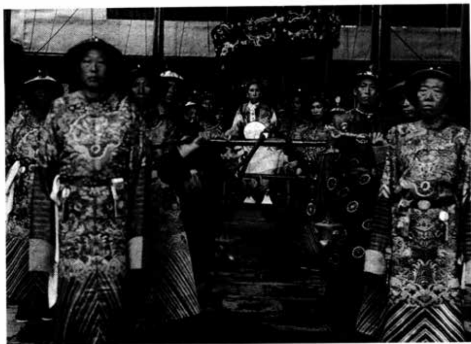
စိရိုးမယ်မယ်ကြီး ညီလာခံထွက်ချိန် မင်းခမ်းမင်းနားမြင်ကွင်း။