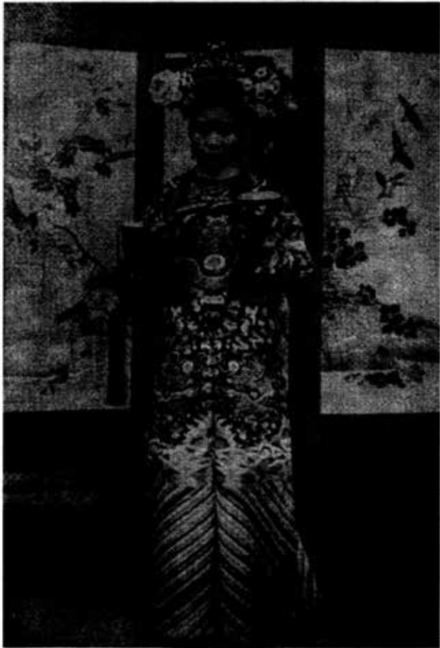
အပျိုတော်မင်းသမီး တာလင်၏ ညီမ ရီရောင်လင်း။