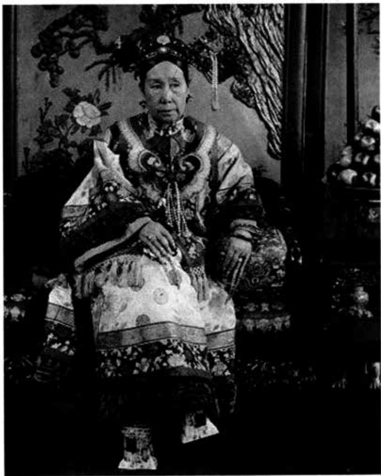
မွေရာသီဝံနန်းတော်၌ တွေ့ရသော စိရီးမယ်မယ်ကြီး။