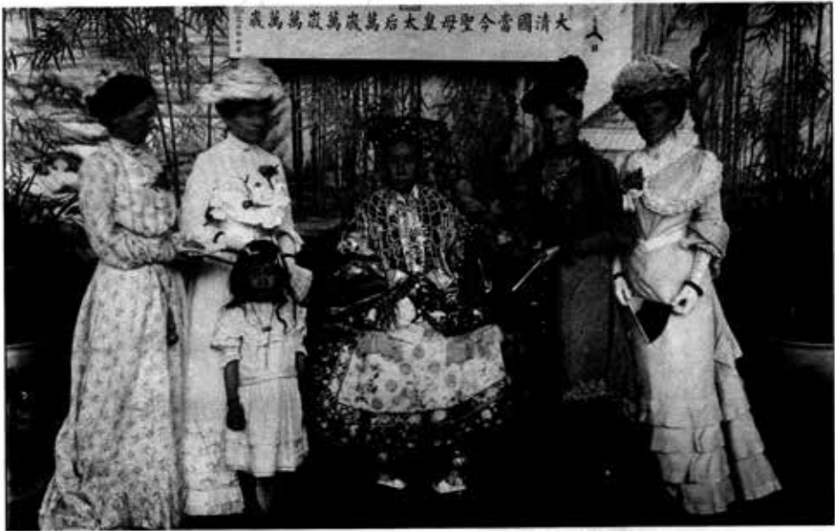
ပိကင်းနေပြည်တော် နွေရာသီစံနန်း၌ တွေ့ရသော စိရိုးမယ်မယ်ကြီးနှင့် နိုင်ငံခြားသံအမတ်ကတော်များ။