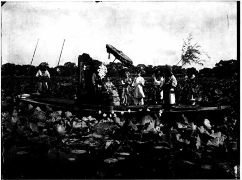
စိရီးမယ်မယ်ကြီးနှင့် အခြေအရာများ ပီကင်းမြို့ ကျုံးပိုင်းရေကန်၌ လှေစီးနေပုံ။