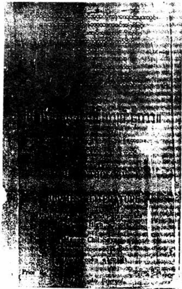
မြန်မာစာပေအဖွဲ့က ဖြန့်ချိပေးထားသော စာအုပ်တစ်အုပ် အတွင်း မျက်နှာစာပုံ