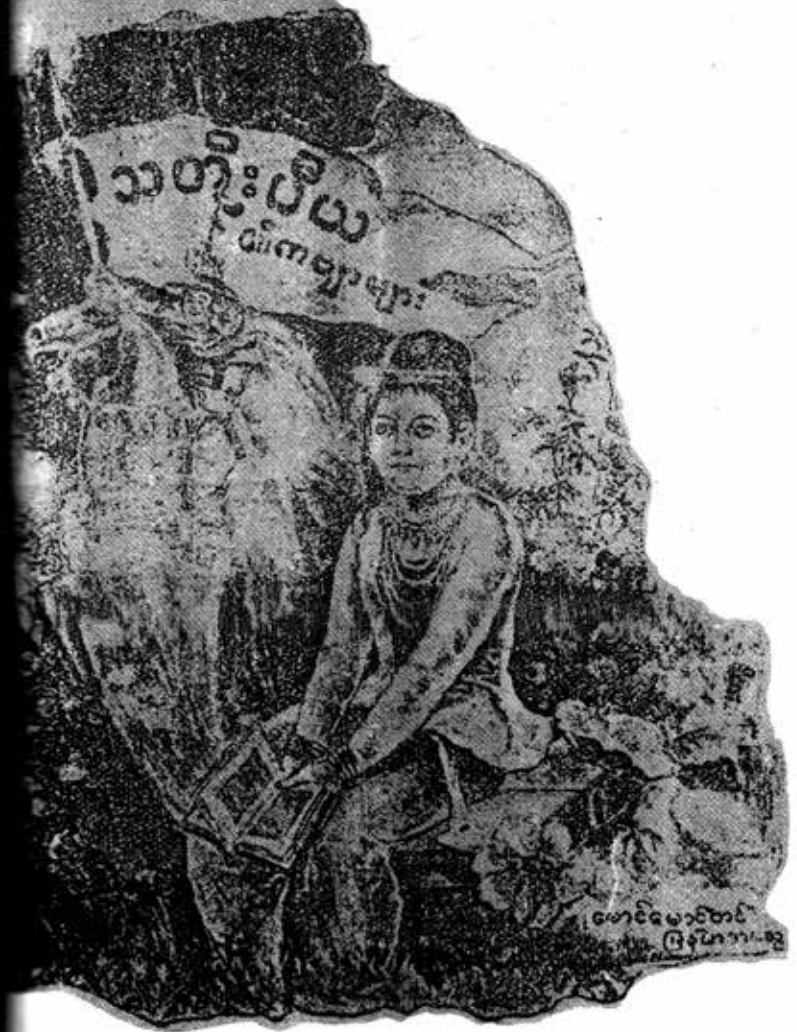
ဒဂုန်မဂ္ဂဇင်း တွင် သီတီးပီယာ တို့ဖြင့် အသား ပေး ဖော်ပြခဲ့သည့်။