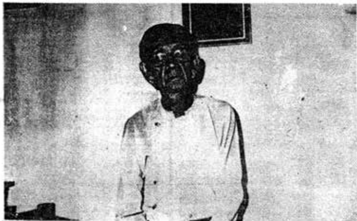
အယ်ကီဂ်ပီဒစ်ဂျီ၊ ချစ်စရာသစ်မိခင် ဒေါ်ဖွား ခင်