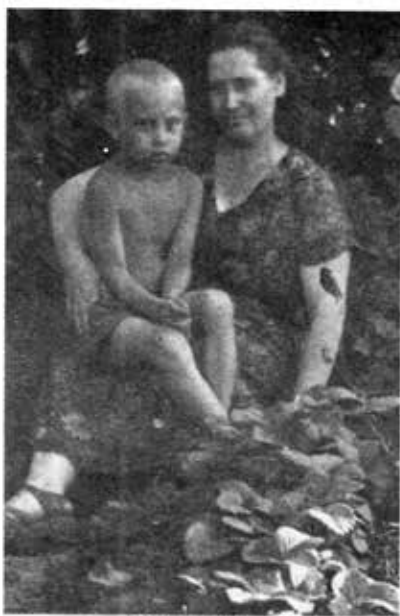
ပူတင်နှင့် မိခင်(၁၉၅၇)