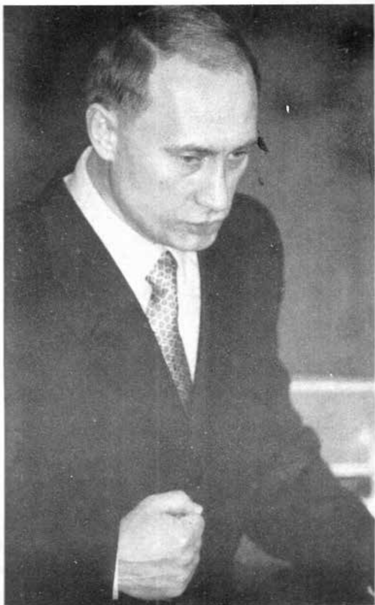
ရုက္ခသမ္မတ ဗလာဒီမာယုတင်