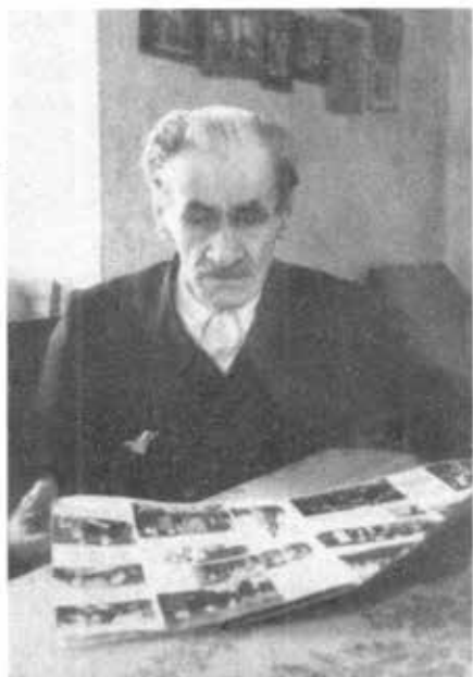
လီနွန်နှင့် စတာလင်တို့၏ စားတော်ကဲ ပူတင်၏ အဖိုး