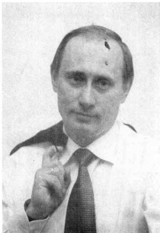
ရန်ပေးသမ္မတ ဗလာဒီမာပူတင်