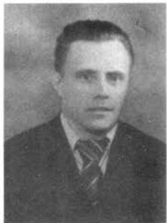
ပူတင်၏ ဖခင်