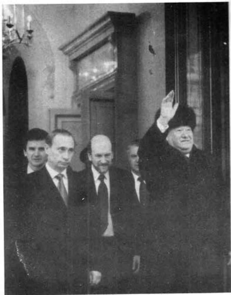
ယဲဆင်နင့်ပူတင်တို့အတူတကွရှိနေစဉ်