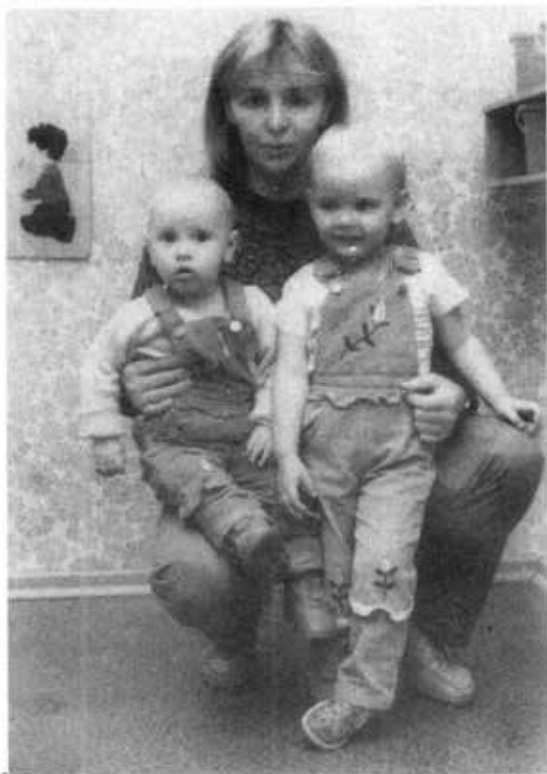
ဇနီးနှင့်သမီးနှစ်ယောက်