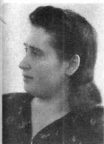
ပူတင်၏ ပိခင်