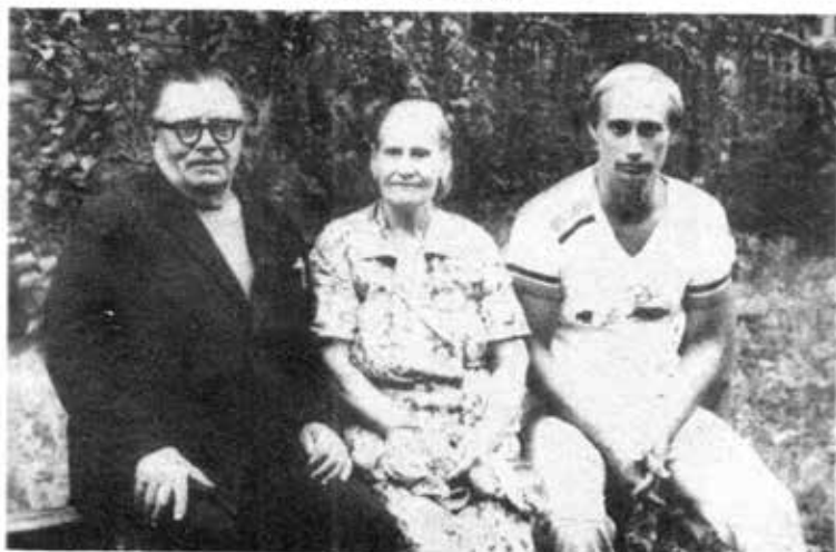
၁၉၇၅ - ဂျာမဏီမသွားခင် မိဘနှစ်ပါးနှင့်အတူ