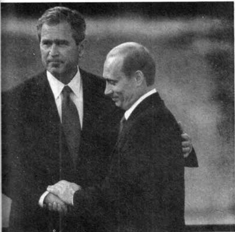
အမေရိကန်သမ္မတဂျော့ဘုချ်နှင့်အတူ