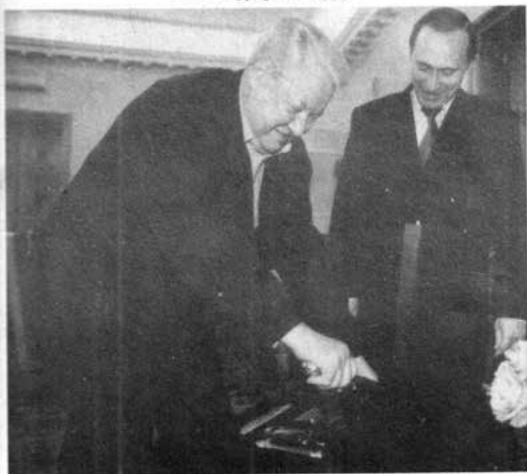
ယဲ့ဆင်မွေးနေ့ပွဲမှာ ယဲ့ဆင်နှင့် ပူတင် (၂၀၀၀ - ဖေဖော်ဝါရီ ၁ ရက်နေ့ )