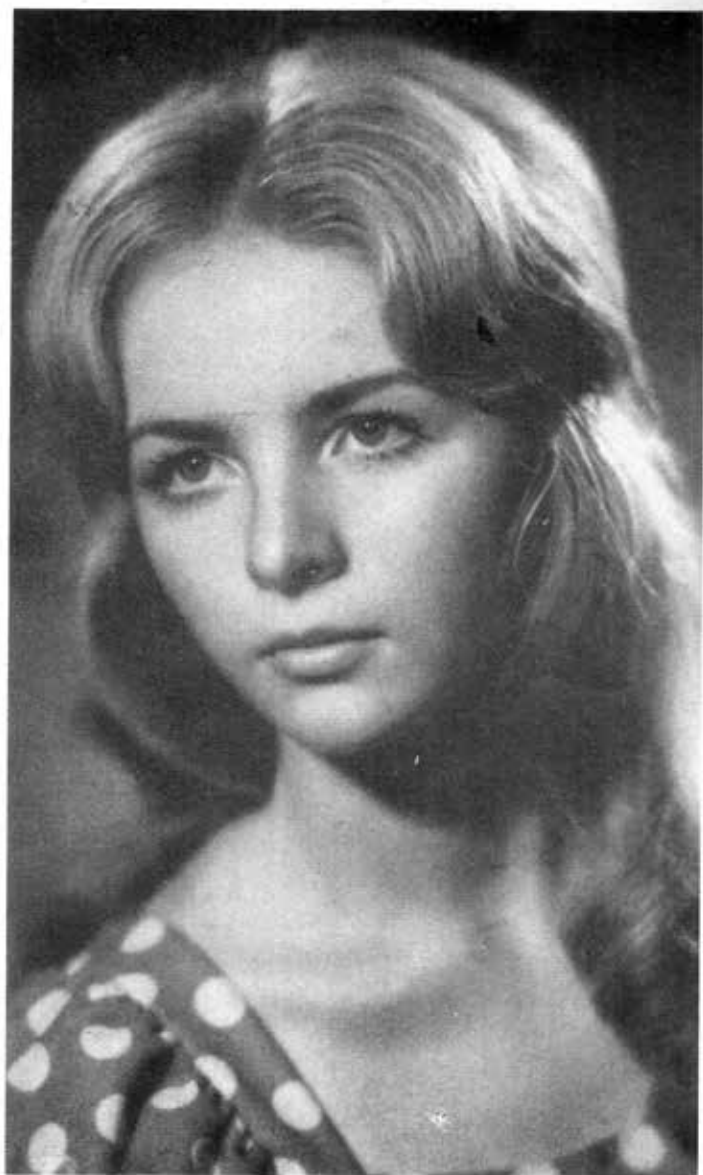
လျှ(ခ)မိလာဇိပုံ