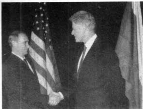
ကလင်တန်နှင့်ပူတင် (၁၉၉၉)