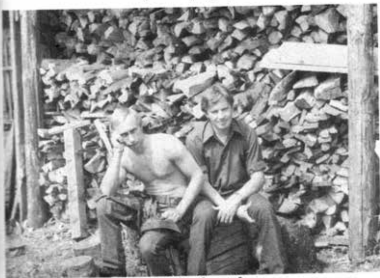
ပုတင်နှင့်ဆာရာဂီရိုဂီယက်(ညာ)တို့ အတူတကွ