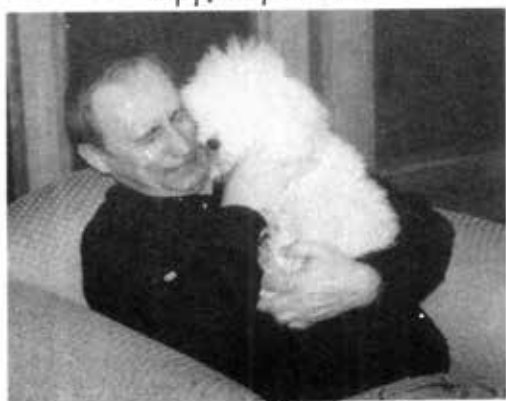
ခွေးကလေးတော့(ခ)ကာနှင့် ပုတင်