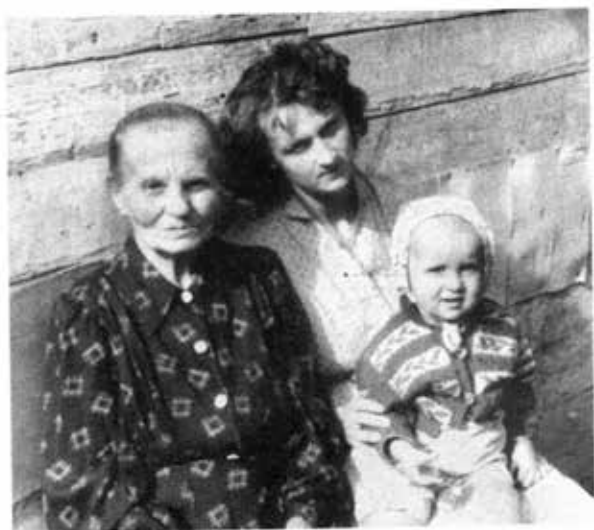
ပုတင်၏အဖွားနှင့် ဝန်း