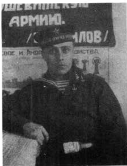
၁၉၃၂ - ရေတပ်ထဲမှာ ပူတင် တာဝန်ထမ်းဆောင်ခဲ့စဉ်က