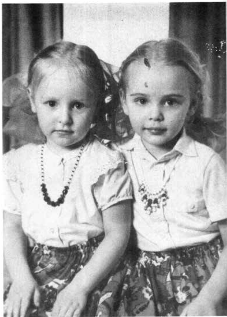
မာရာနှင့်ကာတွဉ်