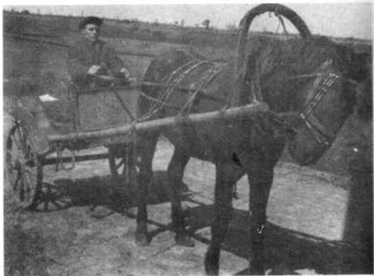
စစ်ပွဲတွင် ဒဏ်ရာရထားသောပူတင်၏ဖခင် စုပေါင်းလယ်ယာတွင် အလုပ်လုပ်စဉ်