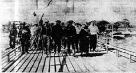
မြောက်ပိုင်းဒေသများရှိ မြို့ကျေးလက်နေပြည်သူများနှင့် ကျေးလက်နေပြည်သူများ နှစ်စဉ်အောင်မြင်စွာ ခြံစည်းရိုးကြက်ဆူငှက်များ စိုက်ပျိုးနိုင်စေရန် အားပေးဆောင်ရွက်ခဲ့ခြင်းဖြစ်သည်။

မိုးခင်း မိုးမခင်း စေ မြောက်ပိုင်းဒေသများရှိ မြို့ကျေးလက်နေပြည်သူများနှင့် ကျေးလက်နေပြည်သူများ နှစ်စဉ်အောင်မြင်စွာ ခြံစည်းရိုးကြက်ဆူငှက်များ စိုက်ပျိုးနိုင်စေရန် အားပေးဆောင်ရွက်ခဲ့ခြင်းဖြစ်သည်။ မြောက်ပိုင်းဒေသများရှိ မြို့ကျေးလက်နေပြည်သူများနှင့် ကျေးလက်နေပြည်သူများ နှစ်စဉ်အောင်မြင်စွာ ခြံစည်းရိုးကြက်ဆူငှက်များ စိုက်ပျိုးနိုင်စေရန် အားပေးဆောင်ရွက်ခဲ့ခြင်းဖြစ်သည်။