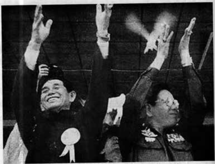
ဖုန်ကြားရှင်အား ဦးခင်ညွန့်နှင့်အတူ တွေ့ရစဉ်

“ဦးဖုန်ကြားရှင်တို့ ရှိနေပြီပဲ။ ကျွန်တော်တို့ လုံခြုံရေးတွေ မလိုတော့ဘူးလေ” ဟုပြောကာ ဖုန်ကြားရှင်နောက်သို့ လိုက်သွားလေတော့သည်။ ကိုးကန့်ခေါင်းဆောင်များ အလွန်သဘောကျ ပီတိဖြစ်သွားကြသည်။ ဖုန်ကြားရှင်နှင့် ဗိုလ်ချုပ်ကြီးခင်ညွန့်တို့ ကားတစ်စီးတည်း အတူစီးကာ ငြိမ်ချမ်းရေးခရီးကို ဆက်ခဲ့ကြသည်။