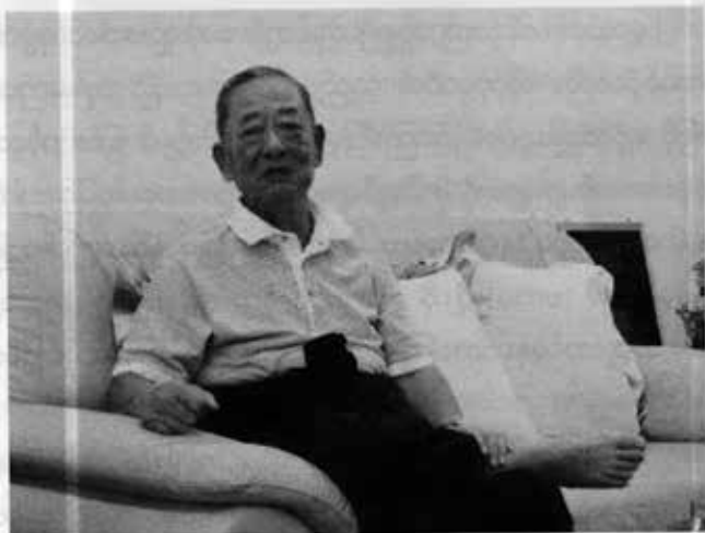
၂၀၁၂ ခုနှစ်က တွေ့ရသည့် လော်စစ်ဟန်