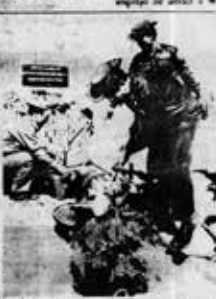
ကျေးလက်နေပြည်သူများသာမက နိုင်ငံတော်အတွက်ပါအကျိုးရှိမည့် ဇီဝိဇယသီတုတ်လုပ်နိုင်မည့် ခြံစည်းရိုးကြက်ဆူငှက်များ တစ်သက်တစ်စပ်တည်း ကေဘဝစံပြုစိုက်ကွက်များထူထောင် ရော့တတိုင်တွင် ခြံစည်းရိုးကြက်ဆူငှက် သုံးနှစ်အတွင်း ကေငါးသိန်းစိုက်ပျိုးနိုင်ရေးဆောင်ရွက်

မိုးခင်း မိုးမခင်း စေ မြို့စည်ရိုးကြက်ဆူငှက် ကာလတိုအတွင်း အကျိုးအမြတ်ရရှိလာသလို ပြည်စိုက်ပျိုးရေးလုပ်ငန်းများအတွက် စက်ယောင်သီတုတ်လုပ်နိုင်စေရန် ဖြန့်ဖြူးပေးခြင်း စိုက်ပျိုးရေးနှင့် မြို့စည်ရိုးကြက်ဆူငှက်များ ကူညီပံ့ပိုးပေးသွားမည်