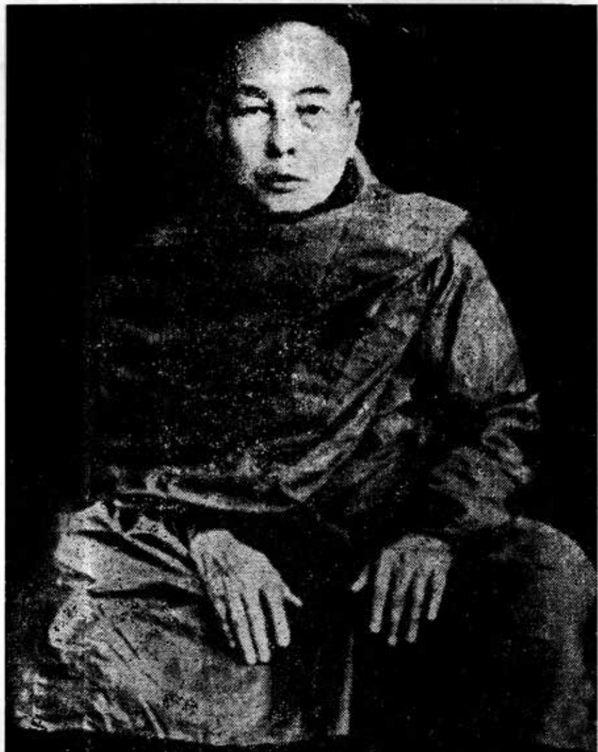
ခေင်ကိုင်းတောင်ရိုး၊ ရွှေဟင်္သာတိုက်သစ် အဂ္ဂမဟာပဏ္ဍိတ ရွှေဟင်္သာဆရာတော်