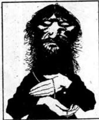
ရုရှားပြည်က မျောက်ဆေးဆရာကြီး ရင်စပြုတင် (၁၈၆၉ - ၁၉၁၆)

သူသည် တန်ခိုးရှင်ပုဂ္ဂိုလ်တစ်ဦးနယ် ဘုန်းကြီးကျောင်းတစ်ခုမှသည် တစ်ခု လှည့်လည်သွားလာလျက်နေခဲ့သည်။ ဖိနပ်မပါ၊ ခြေဖလာဖြင့် ခြေကျင်လျှောက်နေခဲ့တာဖြစ်သည်။ ထိုသို့ဖြင့် ဂိုဏ်းဆရာ ယောင်ယောင်၊ ဘိုးတော်ယောင်ယောင် ဖြစ်လာလျက် နောက်ဆုံး၌ ဇာဘုရင်ကေရာဖိ၏ နန်းတော်တံခါးဝသို့ မခေါ်ပင့်ချေ ရောက်၍လာခဲ့ရတော့သည်။