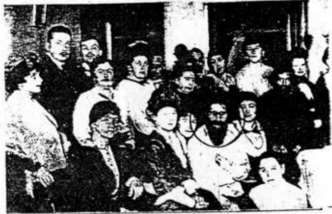
ရုရှားအာဇာနည်နန်းတော်ထဲက ရပ်စပြုတင်

နာမည်ကျော် ရုရှားတော်လှန်ရေး အကြံကလက ရပ်စပြုတင် ဆိုသည့် အူကြောင်ကျား ပျောက်စေဘိုးတော်ယောင်၏ အတ္ထုပ္ပတ္တိကို ထိုသို့ပင် အမှန်ရှိခဲ့ပါသည်။