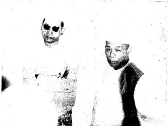
ဗုဒ္ဓိကြီးချုပ် ဦးပေဆွနှင့် ဦးစင်ရတီ ရင်းနှီးစွာ စကား လက်ဆုံ ကျနေသည်ကို ဤသို့ ဖော်ပြရ၏။

တရပ်ပြည်တွင်နောက်ဆုံး ထီးနန်းအုပ်ချုပ်သော မန်ချူးဘုရင် “စွမ်ထုံ” မပြတ်ကျမိတစ်နှစ်တွင် ကျွန်ုပ်သည် တရပ်ပြည်ကြီး၌ရှိနေလေသည်။ ဤအခါက “ပေါင်းကျူးကျော်” ဟူသော တေးဂီတတစ်မျိုး ပေါ်ထွန်းလာဖူးသည်။ ထိုဂီတသံသည် အလွန်ပင် လွမ်းဆွတ်ဆွေးမြေ့ဖွယ်ကောင်းပြီး၊ နားမချမ်းမသာ ဖြစ်ရလေ၏။ အတိတ်နိမိတ်ကောက်တတ်သောပညာရှင်များက “မန်ချူးဘုရင်ပြတ်ကျခါနီးပြီ” ဟူ၍ ပြောဆိုစမှတ်ပြုကြကုန်သည်။ သည်ပညာရှင်များ၏စကားသည် တိုင်းပြည်ဝယ်ခေတ်စားပြီးနောက် နှစ်နှစ် ကြာလေသော်၊ မန်ချူးဘုရင်သည် ပြတ်သွားလေ၏။ ဤဖြစ်ရပ်များကိုသိနှင့်ထားသောကျွန်ုပ်သည် ညီလာခံပြုလုပ်နေသောဖဆပလအဖွဲ့ကြီးသည် ဧကန်ဧကကွဲပေတော့မည်ဟု ယူဆထားလိုက်လေသည်။