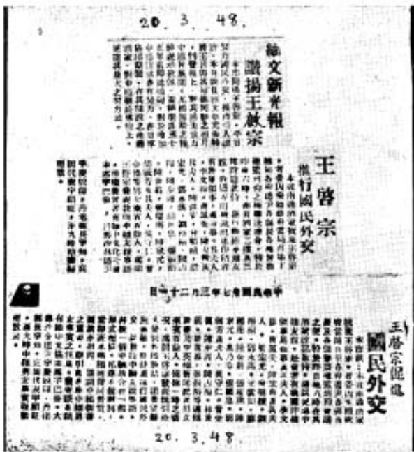
တရုတ်သတင်းစာများ၌ တရုတ်ပြန်မာ ချစ်ကြည်ရေးထမင်းစားပွဲကြီး အကြောင်းကို တရုတ်ဘာသာဖြင့် ဖော်ပြထားသည်။

ဤထမင်းစားပွဲ၌ ဒေါ်မမကြီးသည် သူ၏ကျောက်စိမ်းကြယ်သီးတစ်စုံကို ထုတ်၍ပြရင်း “လွန်ခဲ့တဲ့ နှစ်ပေါင်း ၃၀-ကျော်က ဦးစပ်စုနိုင်ငံခြားကဝယ်လာပြီး လက်ဆောင်ပေးခဲ့တဲ့ပစ္စည်း” ဟူ၍ ပြောပြီးအမှတ်တရ ထုတ်ကာပြသည်။