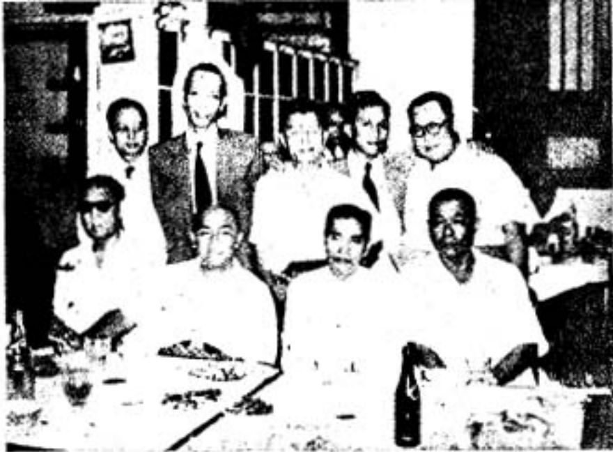
၃-ဝန်ကြီးချုပ်သခင်တင်၊ ဦးကျော်မင်းတို့အား တကြိမ်က ဦးစပ်စုကိုယ်တိုင် ညှိနှိုင်းဆွဲချိတ်၍ သို့ ပျော်ရွှင်စွာ တွေ့ရ၏။

သည်အထဲ မေလ ၁-ရက်(မေဒေနေ့)တွင် ပြည်လမ်းရှိ ဗိုလ်ရှုသဘင်မဏ္ဍပ်တွင် န-တင်၊ ဆွေ-ငြိမ်းအုပ်စုခေါင်းဆောင်များအကုန်လုံးတက်ရောက်ကြသည်။