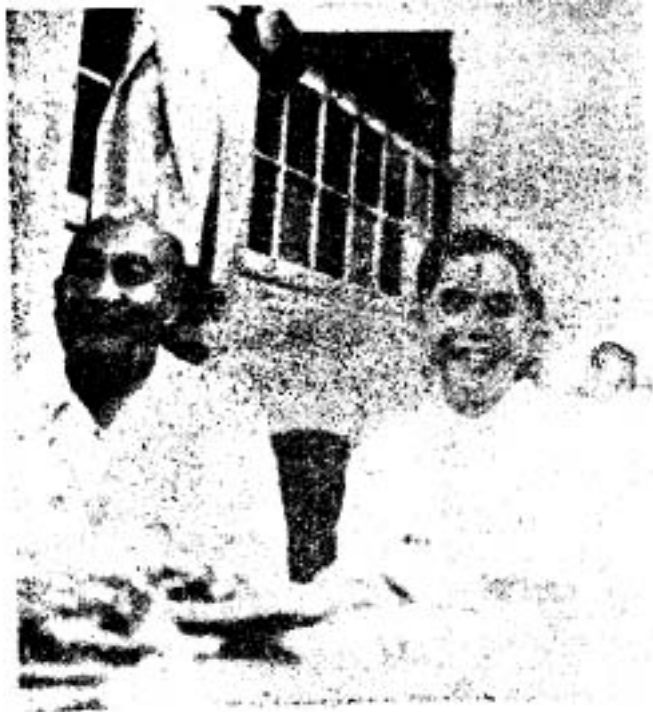
ဝဲမှယာ။ ဦးကျော်မင်းနှင့် သခင်တင်တို့ မြူးမြူးရှင်ရှင်ဖြင့်

၁၉၅၇-ခုနှစ်၊ အောက်တိုဘာလ ၁၀-ရက်နေ့တွင် လွတ်တော်၌ပြဿနာပေါ်သည်။ အဘယ်အကြောင်းကိုအခြေခံ၍ ပြဿနာပေါ်သည်ကိုကား သေသေချာချာမမှတ်မိတော့၊ အဓိက ဦးနုနှင့်ရခိုင်အမျိုးသားခေါင်းဆောင် ဦးကျော်မင်းတို့ မသင့်မသင့်ဖြစ်ကာ စကားများကြသည်ကားမှန်၏။ ထို့ကြောင့်ရခိုင်ခေါင်းဆောင်ဦးကျော်မင်းသည် လွတ်တော်အတွင်းမှစိတ်ဆိုးကာထွက်သွားလေသည်။ ဤတွင် ဦးနုသည် ကိုယ့်မိတ်ဆွေတစ်ဦးယင်းကဲ့သို့စိတ်ဆိုးပြီးထွက်သွားသောကြောင့် စိတ်မချမ်းမသာဖြစ်နေသည်ဟု ကျွန်ုပ်ကြားရသည်။