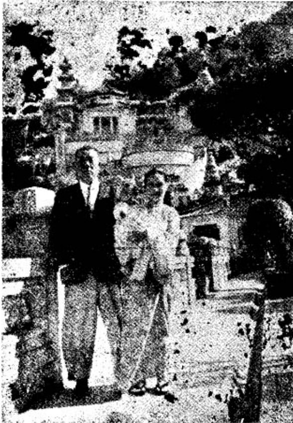
(ဖောင်ကောင်း ကျားခြံဝယ်) ဦးစင်စု၊ မကျင်မြိုင်၊ ကလေးစုစုကြည်။

အနီမြန်မာအမျိုးသားဖိုးစောသည် သူ့ဇနီးမီးခဲမရှိခိုက်ပေမို့ တရပ်မ ဖြူဖြူဖွေးဖွေးလေးများနှင့် ဇိမ်တွေ့နေလေသည်။ ဤအခိုက်အတန့်အချိန်ပိုင်းလေးအတွင်း၌ ကံခေသူအဖို့ ဂြိုဟ်ဆိုးဝင်နှောက်ယှက် လေသည်။ ဇနီးမီးခဲသည် ဓါတ်လှေကားဖြင့်ပြန်တက်လာသည်။ ပြီးလျှင် စည်းစိမ်ရှင်ကိုယ်တော်ချောကို ပတ်ဝန်းကျင်ကိုမမူသောဟန်ဖြင့် လည်စည်းကိုဆွဲ၍ လူပုံအလယ်တွင်ဆွဲခေါ်လေတော့သည်။