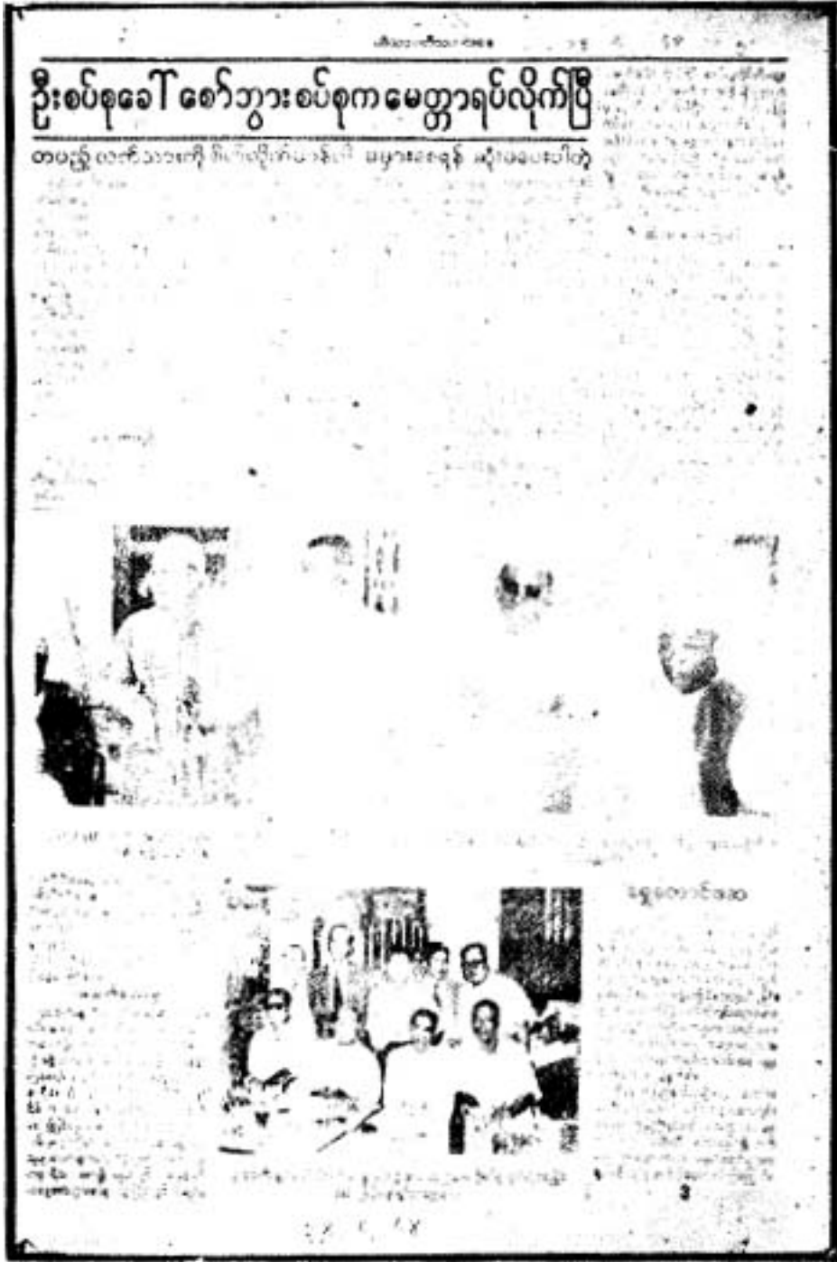
ကြားရသောသတင်းသည် သတင်းကောင်းမဟုတ်၊ သတင်းဆိုးဖြစ်နေသည်။ မေလ ၂၈-ရက်နေ့တွင် ပီကင်းမြို့မှ ဗိုလ်မှူးအောင်ပြန်လာမည်။ ကွမ်းတုံမြို့မှတစ်ဆင့် ဗမာပြည်သို့ပြန်၍လာမည်။ န-တင်နှင့် ဆွေ-ငြိမ်း နှစ်ဘက်သောအုပ်စုဝင်များသည် ဟောင်ကောင်းမြို့နှင့် ကွမ်းတုံမြို့သို့သွားရောက်ပြီး ဗိုလ်မှူးအောင်ကို ကြိုဆိုနေကြသည်။ ဖြစ်ပေါ်လာသောသတင်းစကားစသည်ကား ဗိုလ်မှူးအောင် မင်္ဂလာဒုံ