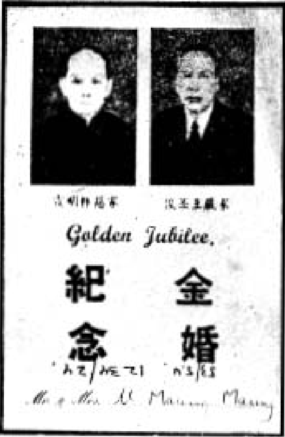
ဦးစင်စင် ဦးဆောင်ချိတိုက် မိဘနှစ်ပါး

၁၉၅၁-ခုနှစ်၊ ဇန်နဝါရီလ ၃-ရက် ဗုဒ္ဓဟူးနေ့၊ ဤနေ့ ဤရက်မတိုင်မီ ဒီဇင်ဘာလတွင် ကျွန်ုပ်သည် ဆွေမျိုးတစ်စုနှင့် တိုင်ပင်ဆွေးနွေးလေသည်။ အကြောင်းအရာကား ကျွန်ုပ်၏မိဘနှစ်ပါး ထိမ်းမြားမင်္ဂလာနှစ်ငါးဆယ်နှစ်မြောက် အထိမ်းအမှတ် ရွှေရတု သဘင်ကျင်းပလို၍ဖြစ်သည်။ ကျွန်ုပ်သည် ယခုအချိန်အထိ ရွှေရတုသဘင်ဖိတ်ကြားလွှာမျိုး တစ်စောင် တစ်လေမျှမရရှိဖူးပေ။ ဤပွဲလမ်းသဘင်မျိုးလည်း တစ်ခါမျှ မတက်ရောက်ဖူးသေးပေ။ ထိုသို့ပြုလုပ်ခြင်းသည် တနည်းအားဖြင့် ထူးထူးခြားခြားဖြစ်သည်ဟုထင်၏။ ကျွန်ုပ်၏ဆန္ဒ အာသီသကို ဆွေမျိုးများနှင့် တိုင်ပင် ဆွေးနွေးကြည့်သောအခါ ကန့်ကွက်သူတစ်ယောက်မျှမရှိပေ။