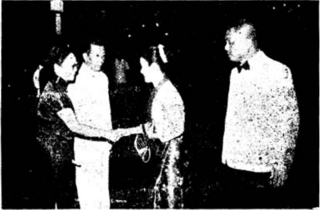
၁၉၅၃ ခုနှစ် သံအမတ်ကတော် အောင်ရီ၊ တရုတ် သံအမတ် လီအမ် ဘင်၊ မကျင်မြိုင်၊ ဦးစစ်ရ။

ထိုအချိန်၌ကား ဟယ်လပင်လမ်းရှိ ၁၉၆၂-ခုနှစ်တွင် ပြီးစီးသွားသော သံရုံးအဆောက်အဦသစ် ကြီး၌ ဧည့်ခံကျွေးမွေးသည်ကို မြင်တွေ့ရပေသည်။ သံရုံးမှပြုလုပ်သော ဧည့်ခံပွဲကြီးပွဲကောင်းများသို့ တက်ရောက်၍ ကိုယ့်ပေါင်းဟောင်းသင်းဟောင်းများနှင့် တဖန်တွေ့ကြရသည်။ စကားစမြည်ပြောကြားရသည်။ ရယ်စရာမောစရာလေးများကြားရသည်။ မသေမပျောက် ကျန်းကျန်းမာမာနှင့် တစ်ဦးကိုတစ်ဦးတွေ့ရ၍ စိတ်၏ စိမ်းမြေ့မှုသည်ပင်လျှင် အမြန်ဟုခေါ်ဆိုရမည်သာဖြစ်လေသည်။