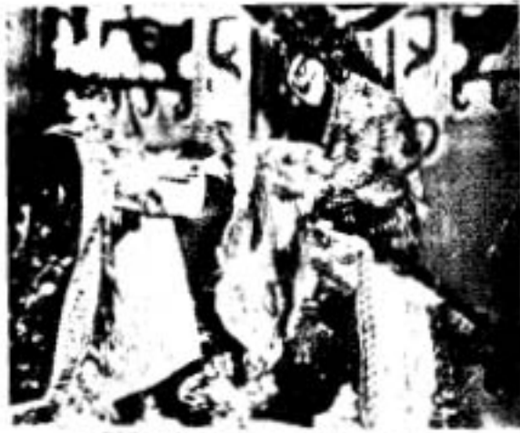
THE RULER DOES FAREWELL TO HIS FAVORITE