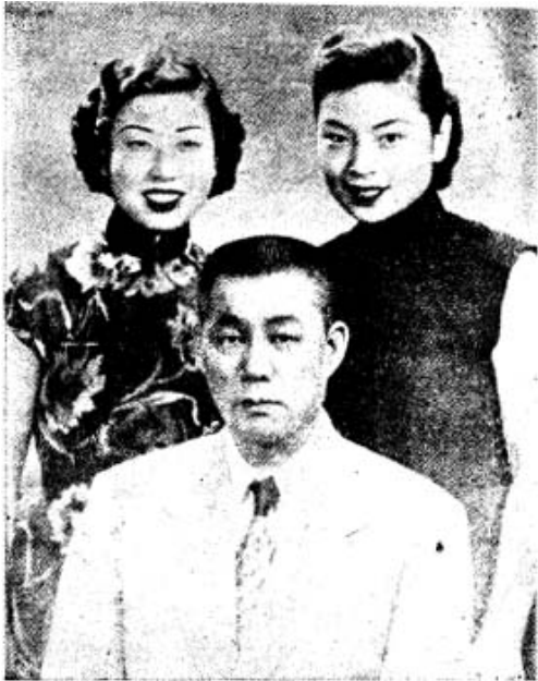
ဦးစင်စု ဖောင်ကောင်း၌ ကြီးပွားနေစဉ် ဝဲမှယာ။ ဦးစင်စုနှင့် ကျွန်ုပ်၏၊ ကျွန်ုပ်၏၊ ကျွန်ုပ်၏၊ ကျွန်ုပ်၏။

ကျွန်ုပ်ပေ့ရှုပ်ခဲ့သော ဘဝဇာတ်ခုံ ပေါ်မှ တစ်ခန်းသောဇာတ်ကွက်တစ်ကွက် ကို ထုတ်နှုတ်တင်ပြ ရပါလေသော် ....။