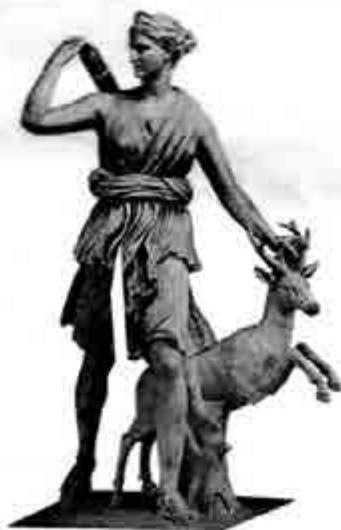
အားတမစ်(စ်)

အပိုးလိုးအကြောင်း ဖတ်ပြီးသော စာရှုသူသည် သူ့အစ်မ အားတမစ်(စ်)ကို မှတ်မိပေလိမ့်မည်။