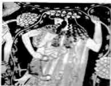
ဒိုင်အာနီးဆက်စ်

အရှေ့တိုတယ်လ်၏ ပိုး အက်တစ်(စ်) ခေါ် ကဗျာသဘော တရား (တစ်နည်း) စာပေသဘော တရား ကျမ်းကြီးအရ ခေါမ ထရက်ဂျဒီပြဇာတ်ကြီးများသည် အခေါင်အထွတ် ရောက်အောင် ပြည့်စုံပြီးမြောက်သော ကဗျာ (ဝါ) စာပေ ဖြစ်သည် ဆို၏။