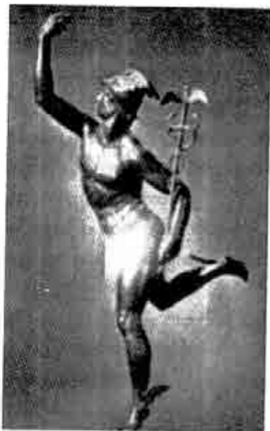
ဟားမီးစ်

ဇူးစ်ကြီးနှင့် ပေါင်းဖက်သဖြင့် မေးယာသည် စီလီးနီ (Cyllene) တောင်ထိပ်၌ ဟားမီးစ်ကို မွေးခဲ့သည်။ ဟားမီးစ်ကား မွေးစကတည်းက အငြိမ်မနေနိုင်သူ၊ အဖမ်းရ ခက်သူ ဖြစ်လေသည်။ ပြဒါးဓာတ်သည် ဟားမီးစ်၏ သဘာဝစရိုက်ကို ပြသည်။ နောင်သော် ရောမလူမျိုးတို့က ဟားမီးစ်ကို မာကျူရီဟု ခေါ်ကြသည်။