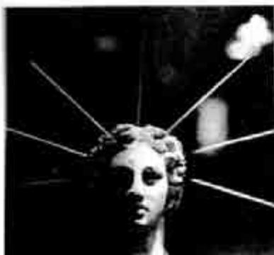
ဟီလီးယက်စ်

ဒီမီတာသည် လယ်ခင်း၊ ယာခင်းနှင့် မျိုးဆက်ပြန့်ပွားရေး ဆိုင်ရာ တန်ခိုးရှင်မ ဖြစ်ကြောင်း ဆိုခဲ့ပြီ။ ယခု ဇူးစ်တို့ ဟေးဒီးစ်တို့ အပေါ် မနိုင်သမျှ ဒီမီတာက သူ့တန်ခိုးဖြင့် အဖျက်လုပ်ငန်းကို ကမ္ဘာမြေပေါ် မဲ၍ချသည်။