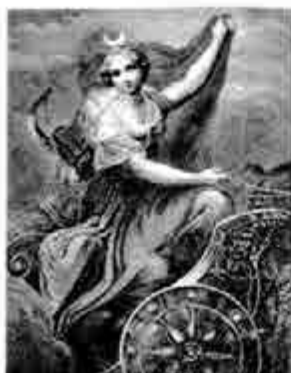
နိုင်ယင်နာ

ထိုနောက် အားတမစ်(စ်)သည် ဦးချို ရှိသော သမင်နီ လေးကောင်ကို အရှင် ဖမ်းယူပြီး ရွှေစက်သွားခွံ၍ ရွှေရထားတွင် ကကြီး တပ်ဆင်လျက် ဆွဲစေသည်။