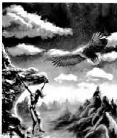
ပရမီးသီအက်စ်

ပရမီးသီအက်စ် ဟူသော စကားက 'ကြိုတင်တွေးဆမြော်မြင်ခြင်း' ဟု အဓိပ္ပာယ်ရှိသည်။ အက်ပမီးသီအက်စ်ကား 'နှောင်းခါမှ ပြန်လည်တွေးတော သုံးသပ်ခြင်း' ဟု အဓိပ္ပာယ်ရ၏။