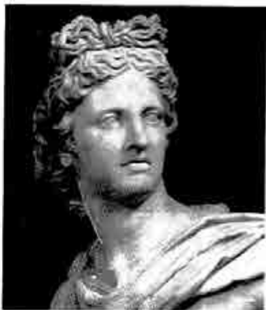
ဒါဗီးလီး

ဇူးစ်ကြီး၏ များလှစွာသော မိဖုရားတွေအနက် လီးတိုး တစ်ယောက် ပါဝင်ကြောင်း ဆိုခဲ့ပြီ။