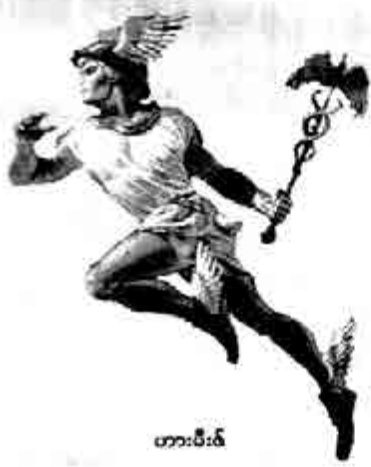
ဟားမီးစ်

ပလီးယားဒီးစ် ခြောက်ဦးက နတ်တွေနှင့် ညားကြရာ၌ ဇူးစ် တစ်ယောက်တည်းနှင့်ပင် သုံးယောက် ညားသည်။