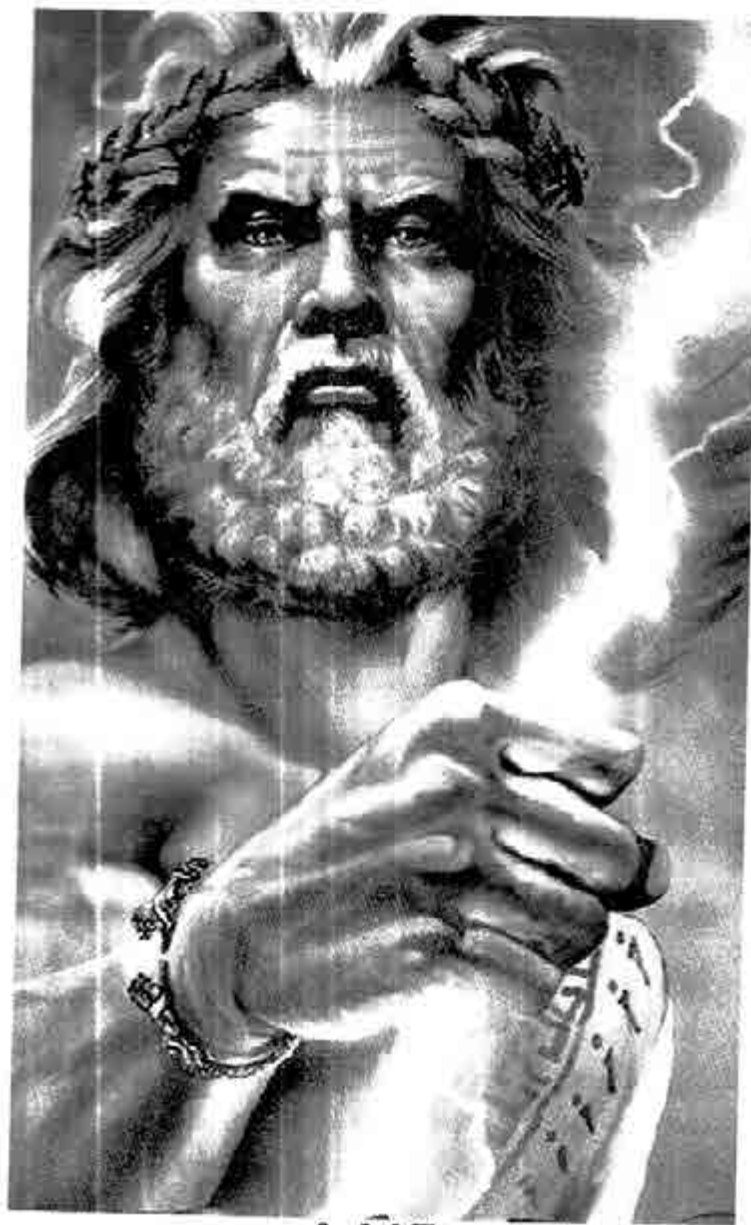
ဇူးစ်နတ်မင်းကြီး