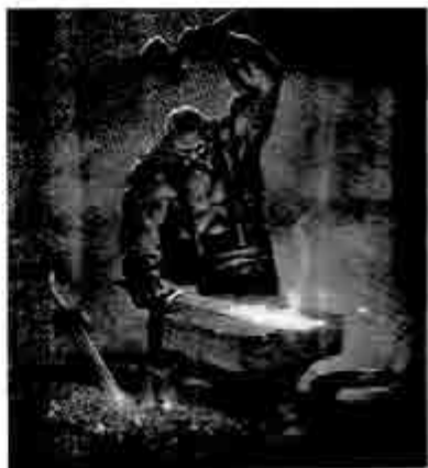
ဟီဖီထက်စ်

မွေးစက သူ့ခမျာမှာ ကြံ့ကြံ့လို့လို့ သေးသေးကွေးကွေး နှင့် မစွမ်းမသန်လေး ဖြစ်လေရာ ဝံ့ရာစက်ဆုပ်သော သူ့အမေ ဟီးရာ