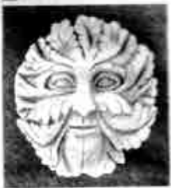
လင်းမနက်စ်

“မောင့်ကိုလည်း ခွင့်လွှတ်ပါဦး ချစ်ဇနီး ရေ... မောင်လည်း ပန်းတယ်ကွယ်၊ မောင့် အသည်းစွဲ လင်းမနက်စ် (Lemnos) ကျွန်းမှာ သွားအနားယူဦးမယ်”