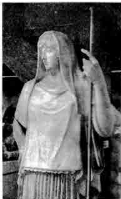
ဟက်စတီယာ