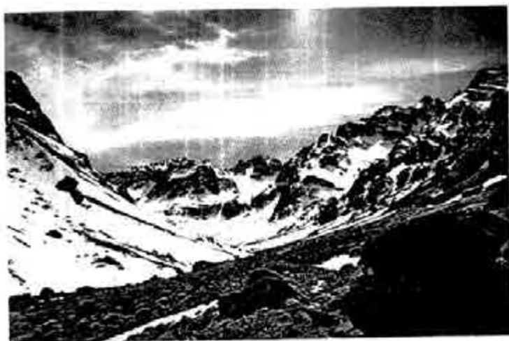
အက်တလက်(စ်)တောင်