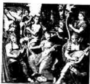
မူးမိညီအစ်မများ

သည်အချိန်အထိ ဂီတပညာရှင်ဟန် နှင့် မျက်နှာချိုချို ထားနေသော အပိုးလိုး ဇာတ်အမုန် ပြတော့၏။