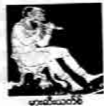
မားသီးယက်စ်

ပလွေလေးကို သူ ကောက်ရသည်။ နှုတ်ခမ်းပေါ် တင်မိရုံရှိသေးသည်။ အသီးနီးဓာတ်ဝင်၍ ပလွေ