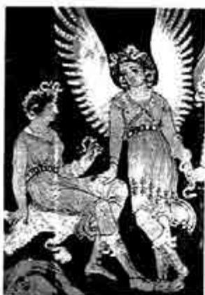
အီရစ်နစ်(၆)