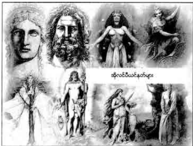
ဆိုလင်ပီယင်နတ်များ

အချို့တစ်သောအခါ ဖြတ်ရမည့် နေရာ အတိအကျကို လက်ကဆစ်(စ်)နတ်သမီးကြီးက ပြသည်။ ထိုအခါ အက်တရာပေါ့စ်နတ်သမီးကြီးက ကတ်ကြေးကြီးဖြင့် တိခနဲ ဖြတ်ချလိုက်သည်။ သေခြင်းဟူသည် 'ပျက်'ပေတည်း။