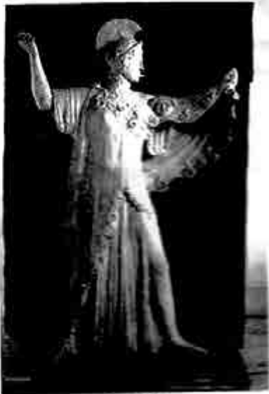
မီးတစ်(စ်)

တောင်ငူ နတ်သျှင်နောင် ကမူ သနားအောင် စွဲခဲ့သည်။