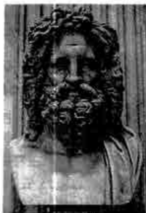
ယူးရေနက်စ်