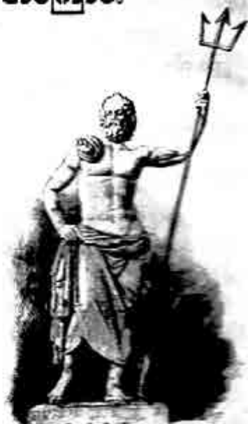
ပိုးဆိုက်ဒင်

ခေါ်မနတ်တို့ကို အင်္ဂလိပ် ဘာသာဖြင့် ဂျေဒ် (god) ဟု *ဂျီ* အသေးနှင့် ရေးကြပါသည်။ ဘာသာကြီးများမှ အနန္တတန်ခိုးရှင် များကို ဂျေဒ် (God) ဟု *ဂျီ* အကြီးနှင့် ရေးကြသည်။ ခေါ်မ