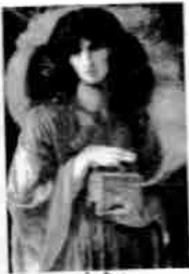
ပင်ဒေါရာ

ထိုအိုးကို ပင်ဒေါရာ တွေ့သွားသည်။ မချောက လက်မနေနိုင် ခြေမနေနိုင်ဘဲ အိုး အဆို့ကို ဆွဲဖွင့်လိုက်ရာ အိုးတွင်းမှ ဒုက္ခတရား တို့ အငွေ့တွေအဖြစ် ထွက်လာသည်။ ထိုအငွေ့ တွေက အက်ပမီးသီအက်စ်နှင့် ပင်ဒေါရာတို့ကို တစ်ကိုယ်လုံးအနှံ့ ပျားတုပ်သကဲ့သို့ တုပ်တော့ သည်။ ထိုမှတစ်ဖန် လူသားမျိုးနွယ် တစ်နွယ် လုံးကို လိုက်တုပ်သည်။ လူပြည်၌ ဒုက္ခတရား တို့ ပျံ့နှံ့လေတော့သည်။