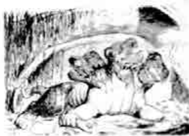
ဆားဘာရက်စ်

တမလွန်ဘဝသား တစ္ဆေများက ကူးတို့ခဲ ပေးမှသာ ကံရင်နီက သူ၏ လှေဖြင့် တစ်ဖက်ကမ်းသို့ ခို့ပေးသည်။ ကူးတို့ခဲ မပါသော တစ္ဆေတို့မှာ ဤဘက်ကမ်းတွင်သာ ဟိုမရောက် သည်မရောက်ဘဝနှင့် ဒုက္ခဖြစ် ကျန်နေရသည်။