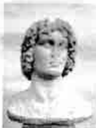
ဒစ်ဆူးလီးစ်

“အောင်မယ်လေး... ငါ့အိမ်တစ်ခုလုံး ကံဆိုးမိုးမှောင်ကျပါပေါ့”