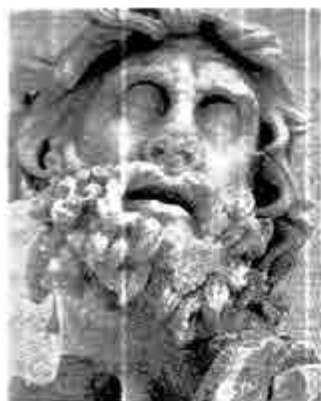
ကရီးနက်စ်