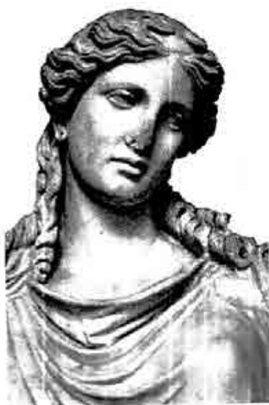
ကလိုးသိုး