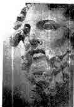
ကောတက်စ်