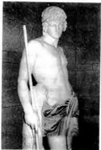
အဒိုးနစ်(စ်)

ထိုအချိန်၌ အက်ဖရာဒိုက်တီး ပေါ်လာသည်။ မိမိ၏ လက်စားချော့မှာ ပြင်းထန် ရက်စက်လွန်းသွားပြီဟု အက်ဖရာဒိုက်တီး ဖောင်တရနေ၏။ ထို့ကြောင့် စင်နီးရက်စ်၏ ဓားကြီး ဆမားန၏ ကိုယ်ပေါ် ကျလာခဲ့ကိစ္စ၌ အချိန်မီ အက်ဖရာဒိုက်တီးက ဆမားနကို ဓားရံ (Myrrh) ဟု ခေါ်သည့် နံ့သာစေးပင်အဖြစ် ပြောင်းပစ်လိုက်သည်။ စင်နီးရက်စ်၏ ဓားကြီးက နံ့သာစေးပင်ကို နှစ်ခြမ်း ခွဲချလိုက်ရာ ပင်စည်တွင်းမှ ကလေးငယ် အဒိုးနစ်(စ်) (Adonis) လိမ့်ကျထွက်လာ၏။