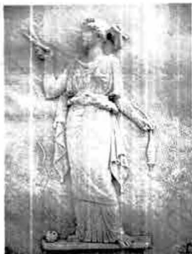
အက်တရာပေါ့စ်

ဆီးဇင်းစ်၏ အဓိပ္ပာယ် ကား ရာသီဥတု ဖြစ်သည်။ ဖိတ်စ် ၏ အဓိပ္ပာယ်က ကြမ္မာ။