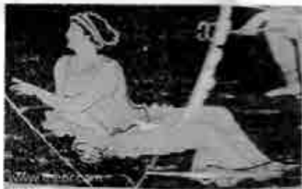
ဒိုင်ယိုနီ

ဒိုင်အာနီးဆက်စ်သည် မိခင် ဆင်မလီကို အိုလင်ပီယင်တောင်ထိပ်သို့ ပင် ခေါ်လာပြီး ဒွါဒဿမ မဟာဒေဝီတွေနှင့် ခပ်တည်တည် မိတ်ဆက်ပေး သည်။ အခြား မရဏလောကသားတွေနှင့် တစ္ဆေတွေ ကြာဆူလွှင် စိတ်ဓာတ် တွေ မကျကြအောင်၊ မနာလို မဖြစ်ကြအောင် သူ့မိခင်၏ နာမည်ရည်ကိုတော့ သူ မသုံး။ သေတ္တုပြန် ဆင်မလီ ကို သိုင်ယိုဗီနီ (Thyone) ဟု သော အမည်သစ် ဒိုင်အာ နီးဆက်စ်က ပေးထားသည်။ ဇူးမဲကြီးက သားတော်မောင် ‘နတ်လည်’ လုပ်ခြင်းကို မကန့်ကွက်သည့် အပြင် သဘောအများကြီး ကျ၏။