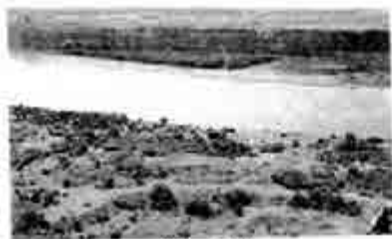
တိုက်ဂရစ်မြစ်

နောက် မြစ်တစ်ခုဆို သူ ရောက်လာပြန်၏။ ဤအကြိမ် တွင်ကား ခမည်းတော် စူးစံကြီးက သူ့ထံသို့ ကျားတစ်ကောင် စေလွှတ်ပေးသည်။ ထိုကျား၏ အကူအညီနှင့် ဒိုင်အာနီးဆက်စ်က မြစ်ကို ကူးသည်။ မြစ်အမည်က တိုက်ဂရစ်(စ်) (Tigris) မြစ်၏။