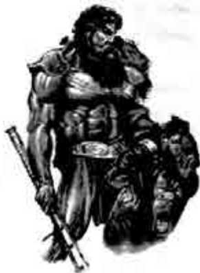
ဟာရကလီးစ်

နောင်သော် ဟာရကလီးစ်သည် သူ့ညီတော်များအတွက် ကမ္ဘာမြေ၌ ပထမဆုံး ဖြစ်သော အိုလံပစ်စ် (Olympic) ပြိုင်ပွဲကြီးကို ကြီးမှူးကျင်းပပေးသူ ဖြစ်လာသည် ဆို၏။ ပီးအင်နီးယက်စ်မှာလည်း ဤကမ္ဘာမြေ၏ ပထမဆုံးသော အိုလံပစ်ချန်ပီယံ ဆိုသတည်း။