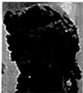
ရိုင်အာနီးဆက်စ်

ခေါမတိုင်းတွင် ရှေးအကျဆုံးမြို့ ဖြစ်သည့် 'သီးဘီးစ်' ဟု ခေါ်သော မြို့ကြီး တစ်မြို့ ရှိသည်။ ထိုမြို့ကြီးကို အသိန်း နတ်ဒေဝီ၏ လမ်းညွှန်စောင်မမှုဖြင့် လူမင်းသား သူရဲကောင်း 'ကက်ဒမက်စ်' (Cadmus) က တည်ဆောက်ခဲ့သည်။