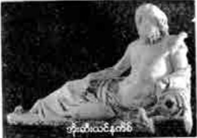
အိုးဆီးယင်နက်စ်

နင်မဆစ်(စ်)သည် လက်တစ်ဖက်က ယန်းသီးပင်၏ အကိုင်းကြီး တစ်ကိုင်းကို ကိုင်ထားပြီး အခြားလက်တစ်ဖက်က ဘီးပိုင်းတစ်ပိုင်းကို ကိုင်ထား သည်။