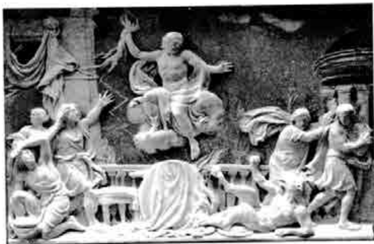
ရှမ်းနှင့် လိုင်ကေးယင်၏ သားများ

လိုင်ကေးယင်၌ သားနှစ်ဆယ် ကျန်ရစ်သည်။ အချို့ကမူ သားငါးဆယ် ကျန်ရစ်သည်ဟု ဝင် ဆိုကြ၏။ ဤသားများကလည်း လူ့ပြည်တွင် ဆက်ဆံသွမ်းနေကြ၏။