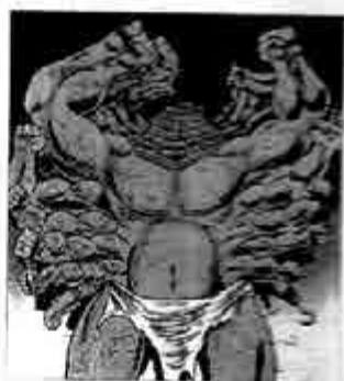
ဂျိုင်းဂျီးစ်