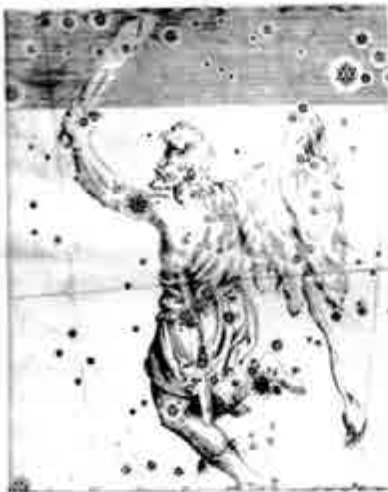
အိုရီယန်

စတစ်ကစ်မြစ် ဟိုဘက်ကမ်း ရောက်လျှင် အက်စ်ဖဒဲလ်လွင်ပြင် (Asphodel Fields) များဟု ခေါ်သော လွင်ပြင်ကြီးကို ဖြတ်ကြရသည်။ အက်စ်ဖဒဲလ် ဆိုသည်မှာ ဂမုန်းပင်၊ နှင်းပန်းပင်ကဲ့သို့ ဥ ရှိသော အပင်ငယ် တစ်မျိုး ဖြစ်လေသည်။