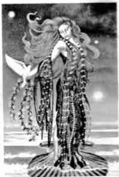
အာဘိဓရာဒိဂ်တီး

နေမိဘုံ ခန်းပျို့ကြီး၌ ရှင်အဂ္ဂသမာဓိက ဗိရုဏီနတ်သမီး ၏ အလှကို-