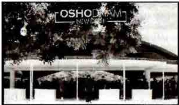
အိုဆိုင်း တရားရိုက်သ Everyday Meditation at OSHODHAM

တကုပြုသတဲ့ မင်းမှာ ခြင်္သေ့ရဲ့ နှိပ်စားခံစား မြင်လှည့်ခြင်းမရှိမင်း မြင်လှည့်