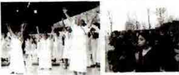
Everyday Meditation at OSHODHAM

သတ္တုပုလဲ (Intuition) သို့ ထင်ထင်လို သို့ရာ ရုတ်တရက်က ငြိမ်သပ်ပေးရာ အစောတစ်ခု ဂရုတို့ နေထိုင် ကျင့် (Tuition) ဦးစွာနေပြန်သေး မဟုတ်ဘဲ မရှိဘယ် ဂင်ဖြစ် (tuition) ဝိုးက ဆရာတို့က အခြေခံပေး ဘဝက ဝါးကို အလုပ် (Intuition) ပေးသော စံချာန် ပေါ်ပေါက် သဘာဝတို့ ပြန်ပြန်ဆိုရာ မိတ်တပေးက မဟုတ်ဘဲ မှတ်တော်) မဟုတ်ပေ။ * ထင်မြင်ပြုချက်ကား "ဗျာဒိတ်ဖြင့်ပင် ဖြစ်လာခဲ့ ကြောင်း စိတ်ဝင်တဲ့ စံချာန် ဖြစ်ပေါ်စေခြင်း ဘေးရာ ဝယ်ပေး ဖြစ်သော် အားကိုး သတိထားရာကို မဟုတ်ရာ မှုပင် ဖြစ်လာသိတယ် ဖြစ်သော် အသွေတစ်ခုက သူ ရှိခဲ့သော တစ်ခယာကို ပြန်ပြန်ဆိုရုံ အင်တော့ မဟုတ် ဝါးပေ။"