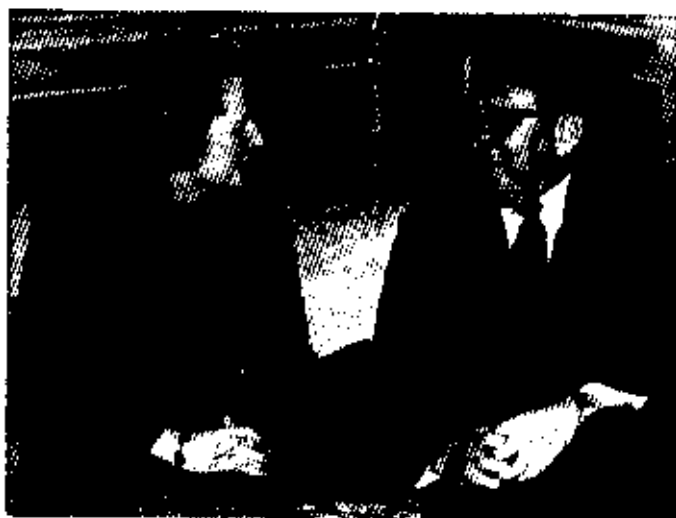
နာမည်ကျော် ဒေါက်တာ တစ်ဆင်းကူးနှင့် ၁၉၇၅