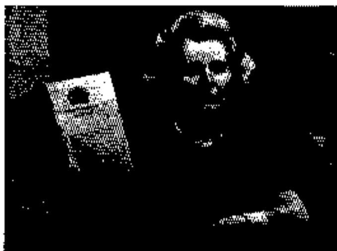
တတ်လှက်ကို လေ့ကျင့်ပေးရန် မန္တလေး ၉ ဘ/၂ (တို့အောင်ပိုင်-တစ်ပိုင်) နာမည်ရင်းစိမ်း ၁၉၇၄