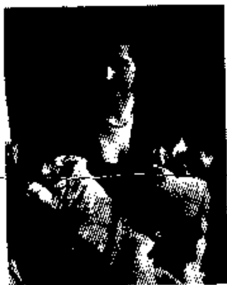
အမြင့်ကလေးရှစ်လောက်၏ မိခင်၊ ၁၉၅၃