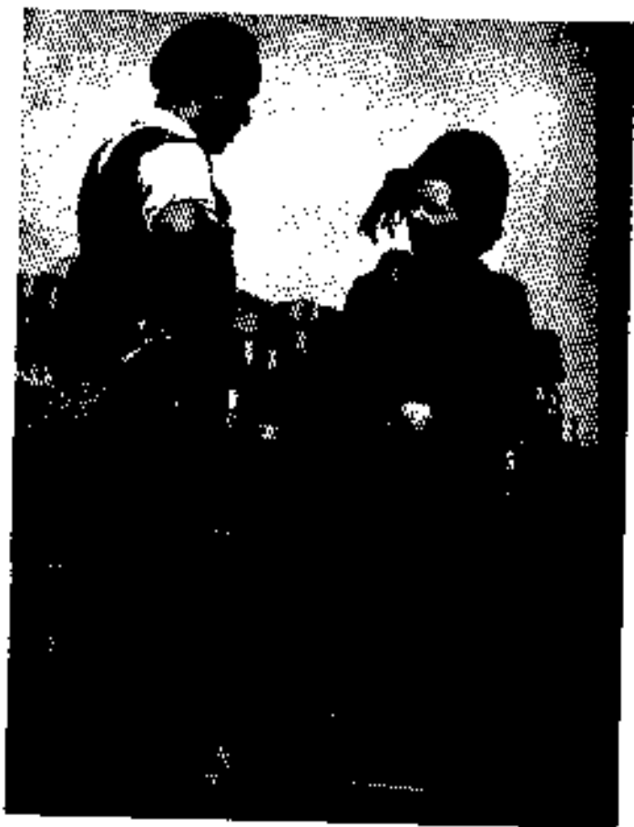
၁၉၅၁ခုနှစ်အောက်တိုဘာလတွင် တွက်တော်အမတ်ရွေးကောက်ပွဲခင်းရန် အလုပ်သမားများနှင့် တွေ့ဆုံမိဆွယ်နေစဉ် (ဖြိုဦးထွက်တွင် ရှောင်ခိုခဲ့သည်။)