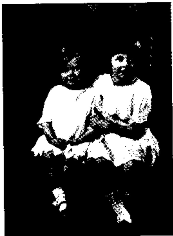
မာဝရက်နှင့် ဖြူနုပန်း၊ ၁၉၂၉