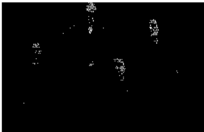
မြို့တော်ဝန်မိသားစု ၁၉၄၅ (မာဂရက်သက်များ၏ အခင်ကြီးသည် ဂရင်သစ်မြို့ကလေး၏ မြို့တော်ဝန်ဖြစ်ခဲ့ဖူးသည်။)