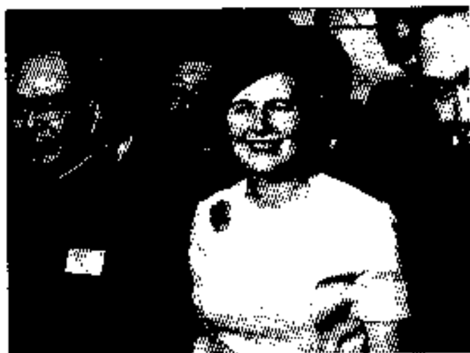
အောင်စွယ်စုံစာအုပ်အဖွဲ့ဝင်၊ ၁၉၇၂