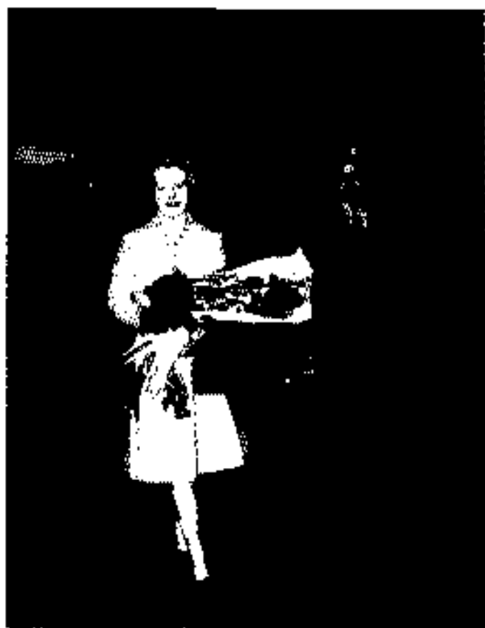
မရီသတ်၏ အချစ်ထော်ဘာစ ၁၉၃၅