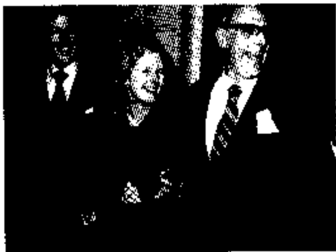
ခင်ပွန်းနှင့် သားနှင့် ဖော်ရွှင်စွာ ၁၉၇၅