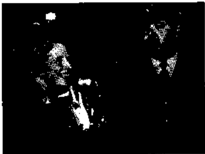
အောင်ပွဲရသူ၏ မိမိကပြော ၁၉၇၅