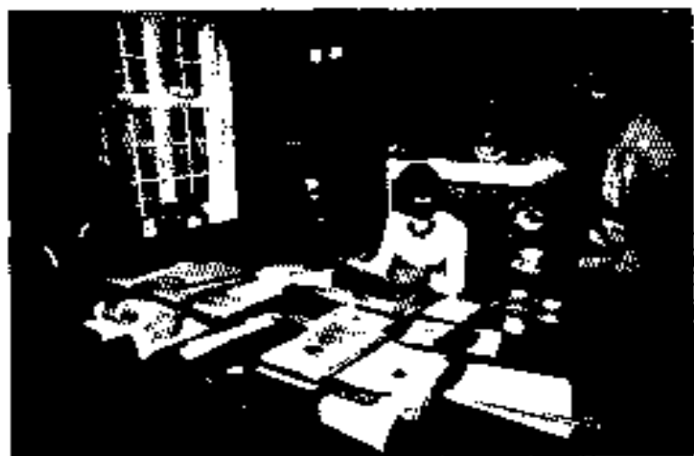
ဒေါ်အေး နိုင်ငံရေး ၁၉၇၅