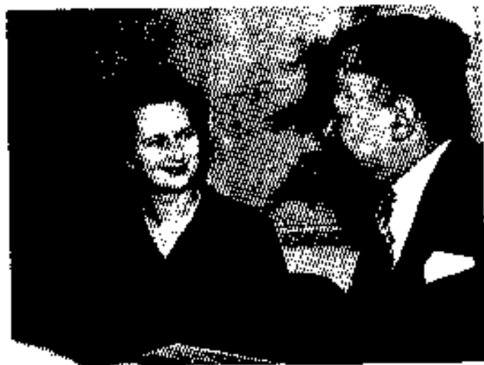
ဒုတိယသန်းကြီးတော် ၁၉၆၀