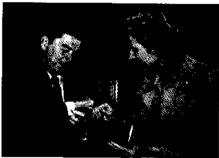
အမေရိကန်သမ္မတ ရေဂင်နှင့် စတင်ရင်းနှီး၊ ၁၉၇၅။