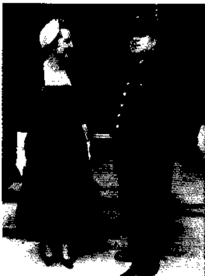
ပထမဆုံးလွှတ်တော်တက်သည့်နေ့၊ ၁၉၅၉