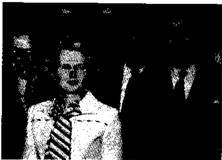
ကွန်ဆာဗေးတစ်ပါတီ ခေါင်းဆောင်အဖြစ်၊ ၁၉၇၅