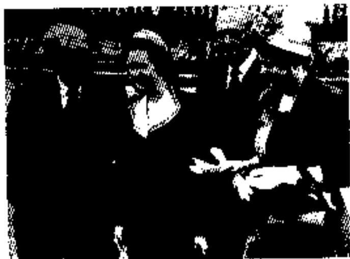
ပထမဆုံးလွှတ်တော်တက်သည့်နေ့၊ ဝါရင့်နိုင်ငံရေးသမားကြီးများက ကြိုဆိုခဲ့ကြသည်။ ၁၉၅၉