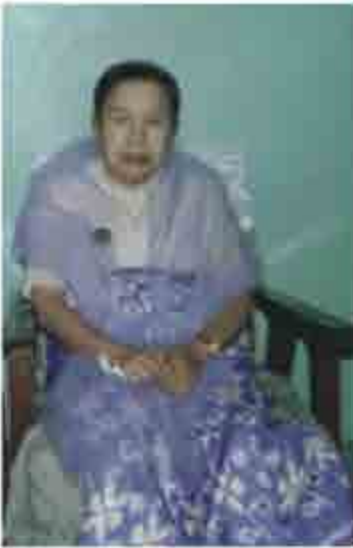
ရိုးရိုးသားသားနေခဲ့တယ်။

ဦးလေးရဲ့နောက် ကောက်ကောက်ပါအောင် လိုက်လာစ ဦးလေးကဆိုင်ကယ်ပေါ်တင် ခရီးနှင့်ကြတော့ နောက်ကဒေါ်ဒေါ်ခပြာ လမ်းတဝက်မှာလိမ့်ကျ ဦးလေးကမသိ တွေးမိတွေးရာအာရုံစိုက် တိုက်ကြီးရောက်မှသိသတဲ့ ပြန်လှည့်ပြီးပြန်ခေါ်ရ တော်လှန်ရေးသမားတယောက်ရဲ့ဇနီးဘဝ ကျင့်သားရအောင်နေခဲ့တယ်။