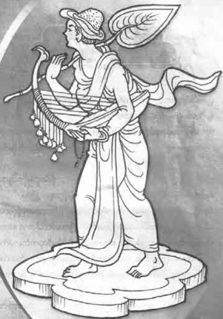
ရှင်တော်နတ်