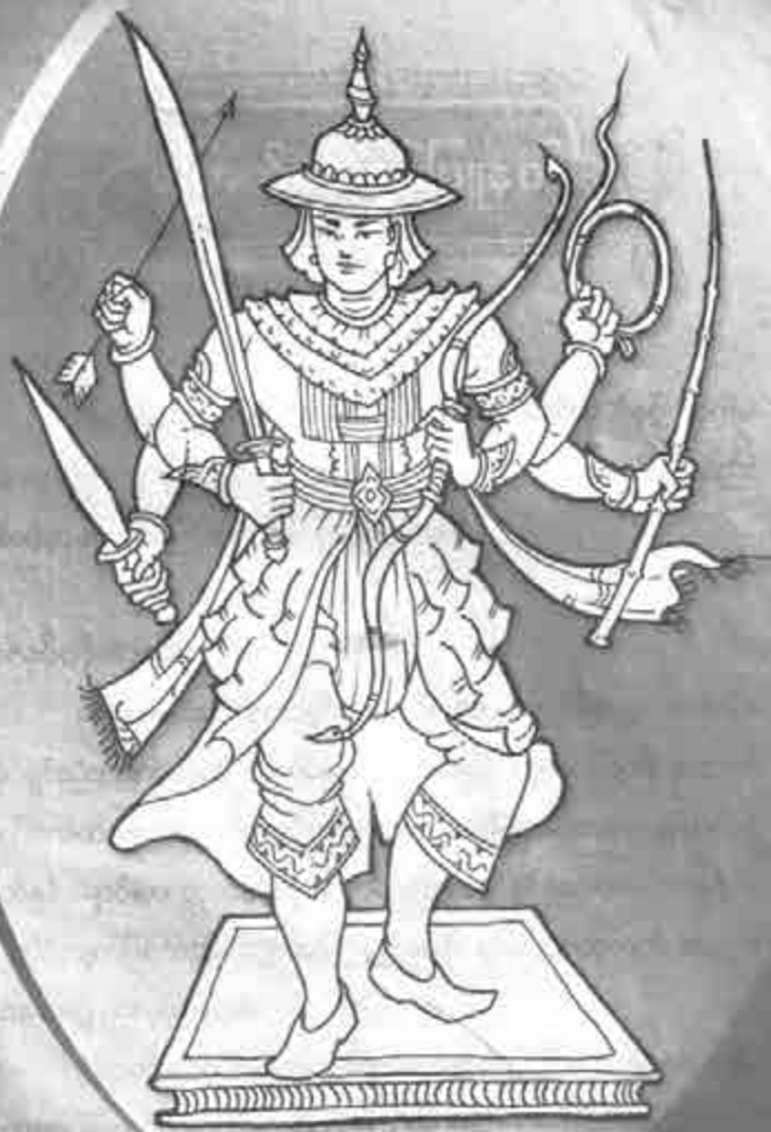
မြောက်မင်းရှင်ခြံနတ်