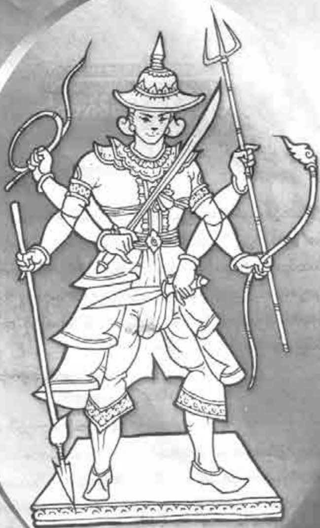
တောင်ကြီးရှင်ညိုနတ်