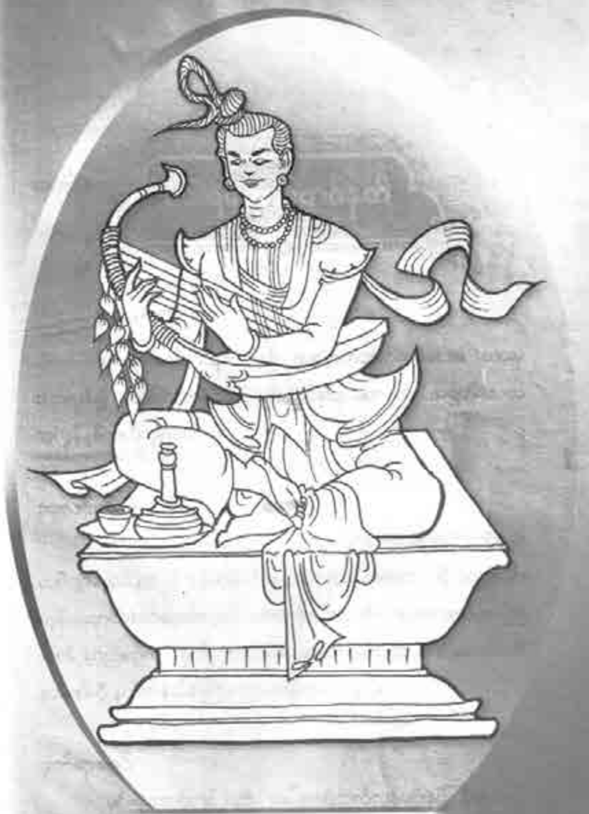
မင်းရဲအောင်တင်နုတ်