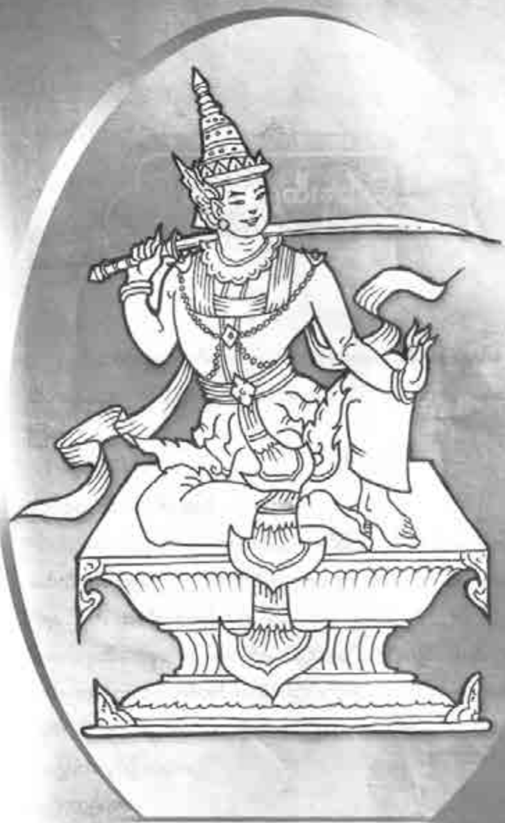
တဝင်းရွှေထီးနတ်