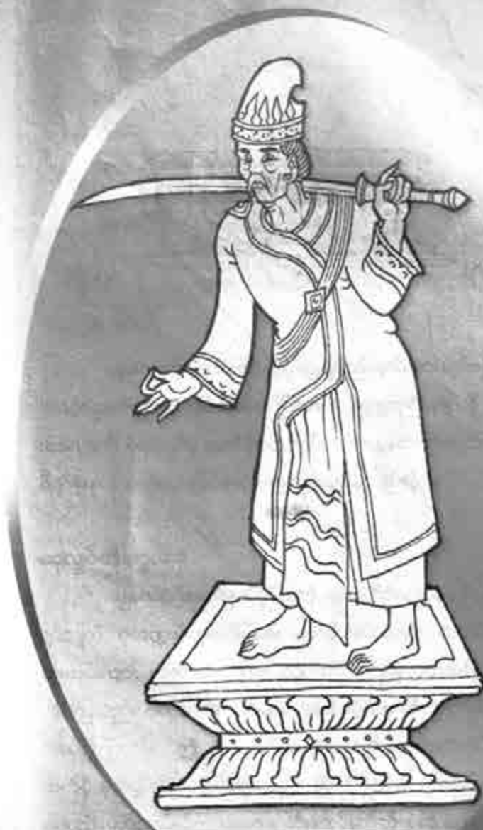
မန္တလေးဘိုးတော်နတ်