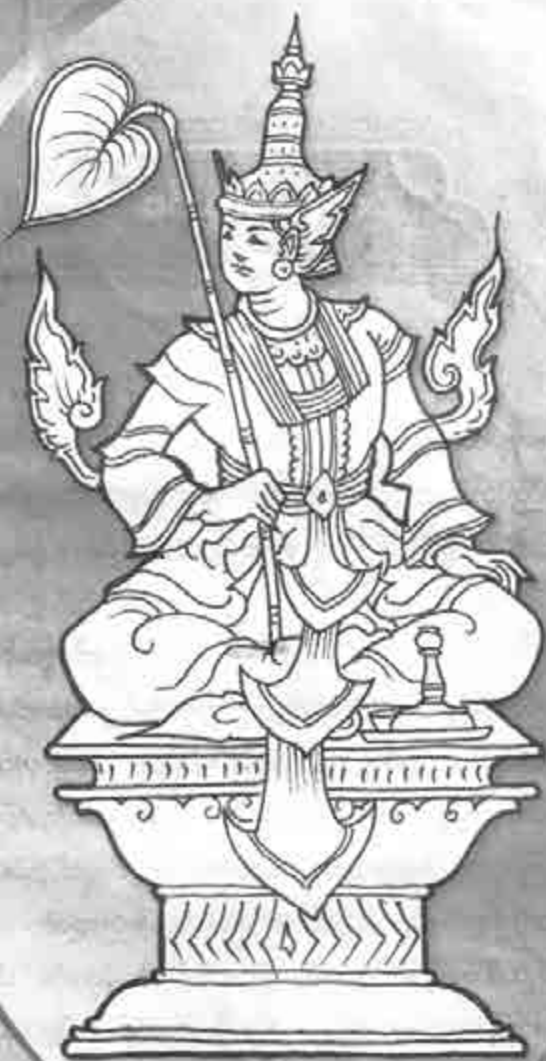
မင်းတရားနတ်