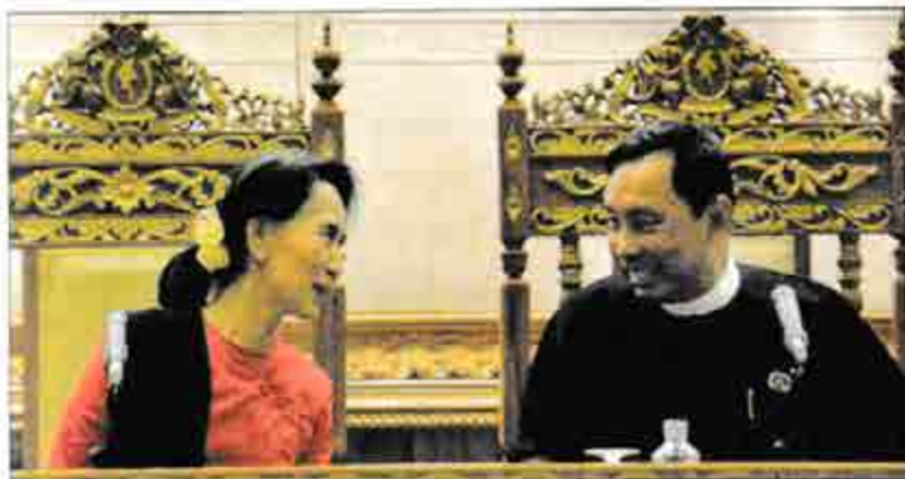
ဒေါ်အောင်ဆန်းစုကြည်နှင့် သူရဦးရွှေမန်းတို့ ၁၈-၇-၂၀၁၃ ရက်နေ့ ၁၂:၀၀ နာရီအချိန်တွင် ဗဟိုသို့ဆောင် မိန့်ခွာခန်းမ၌ ပီဒီယာအဖွဲ့ဝင်များနှင့် တွေ့ဆုံစဉ်

ပြောင်းသွားကြပါတယ်။ ဘယ်သူကမှ ဒါကို ထာဝရအစဉ်အမြဲ သာနေတယ်ဆိုတာ မရှိနိုင်ပါဘူး။ အဲဒါကြောင့်မို့လို့ ကိုယ်သာတယ်။ သူသာတယ်ဆိုတာ ပြောစရာ အကြောင်းမရှိပါဘူး။ နောက်ဆုံးကျတော့ ပြည်သူလူထုက ရွေးချယ်မှာပဲ။ အဲဒီတော့ နိုင်အောင်လုပ်မယ်ဆိုတာဟာ အလုပ်တစ်ခုကို လုပ်လို့ရုံရင် မှန်မှန်ကန်ကန်နဲ့ ပြတ်ပြတ်သားသားလုပ်လို့ ရှိရင်တော့ အနိုင်ရနိုင်တယ်လို့ ကျွန်မတို့ ဒီလိုပဲ ယုံကြည်တယ်။ ဒီအတိုင်းပဲ ကျွန်မတို့ဆက်လက်လုပ်သွားမှာပဲ။ ဒါက ကိုယ်ကသာလို့ သူကသာလို့ ဒီလိုသဘောနဲ့ မဟုတ်ပါဘူး။ ပြည်သူလူထုရဲ့ ထောက်ခံမှုရ အောင်လို့ ကျွန်မတို့ မှန်မှန်ကန်ကန်လုပ်နိုင်တယ်လို့ ယုံကြည်တဲ့ သဘောနဲ့ လုပ်ဆောင်တာ ဖြစ်ပါတယ်။”