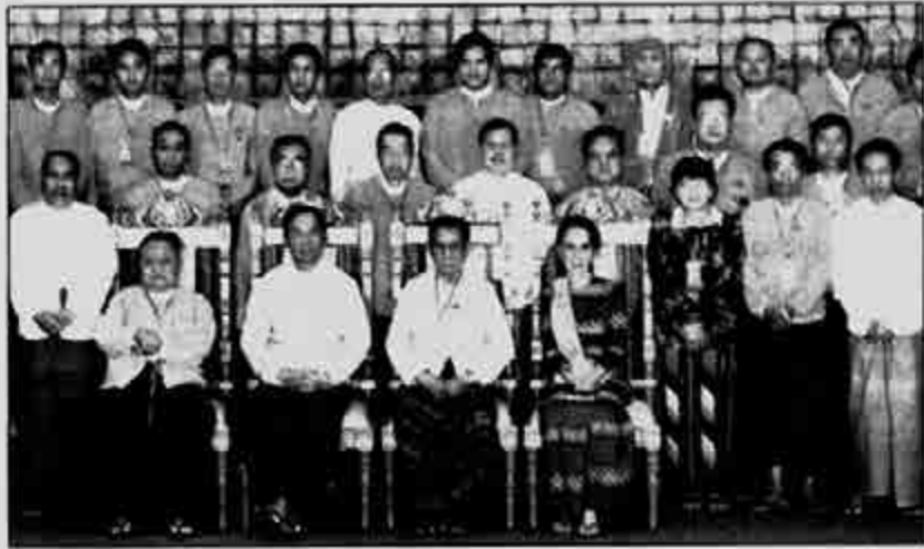
တိုင်းဒေသကြီးနှင့် ပြည်ထောင်စုကြီးချုပ်များ၊ လွှတ်တော်ဥက္ကဋ္ဌများအဖြစ် တာဝန်ပေးရန်လျာထားခံထားရသူများအား စပျူသီရိခန်းမဆောင်တွင်အုပ်ချုပ်ရေးနှင့် လွှတ်တော်အတွေ့အကြုံဆိုင်ရာ အလုပ်ခွဲအဖွဲ့ခွဲတိုက်ပေးအပြီး မှတ်တမ်းတင်ဖတ်ပုံမှိုက်စဉ်