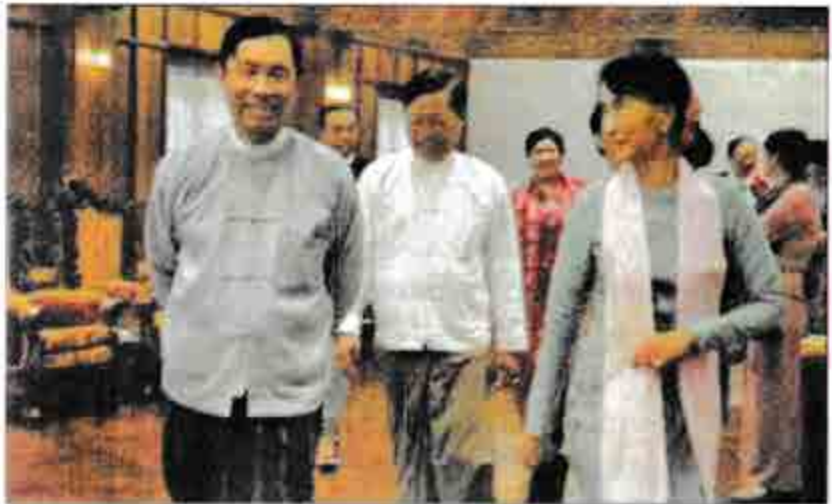
ဒေါ်အောင်ဆန်းစုကြည်၊ သူရဦးရွှေမန်းနှင့် သူရဦးအောင်တို့

ပါတီ၏ မူဝါဒ၊ သဘောထား၊ ဆုံးဖြတ်ချက်များကို ရလှူကာ ပြည်ထောင်စုအဖိုရအဖွဲ့တွင် မါဝင်သွားသည့် ပါတီဝဟိုအလုပ်အမှုဆောင်များနှင့် ပါတီဝဟိုအလုပ်အမှုဆောင် လွှတ်တော်ကိုယ်စားလှယ် ဖြစ်နေသူများ ညှိနှိုင်းကြရသည်။ အခြေခံဥပဒေကို ပြင်ဆင်ရန် မလိုလားသူများလည်း ပါတီခေါင်းဆောင်ပိုင်းတွင် အများအပြား ရှိနေခဲ့သည်။