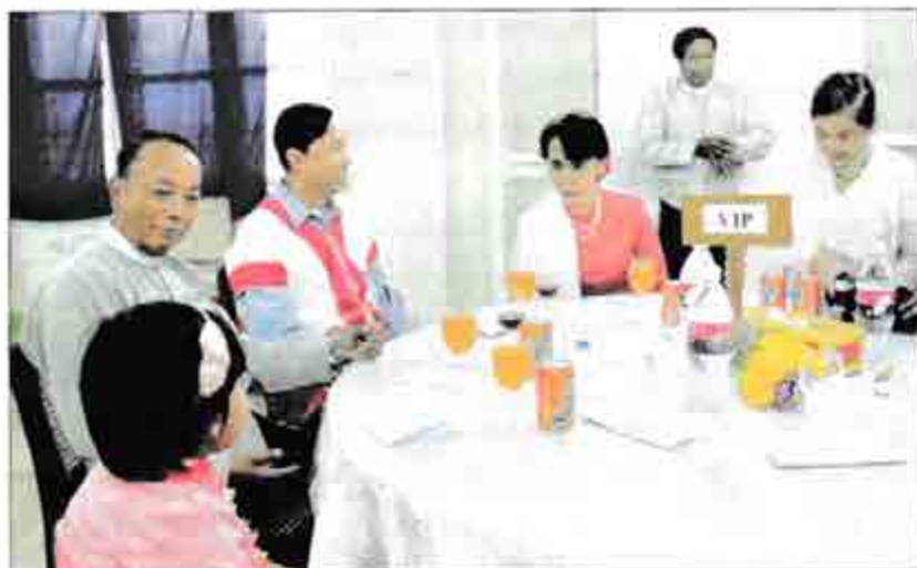
ဒေါ်အောင်ဆန်းစုကြည်၊ သူဇွန်၊ ငွေမန်းနှင့် ဦးခင်အောင်မြင်တို့ ကရင်ပြည်နယ်နေ့ ဂုဏ်ပြုညစာစားပွဲသို့ တက်ရောက်စဉ်