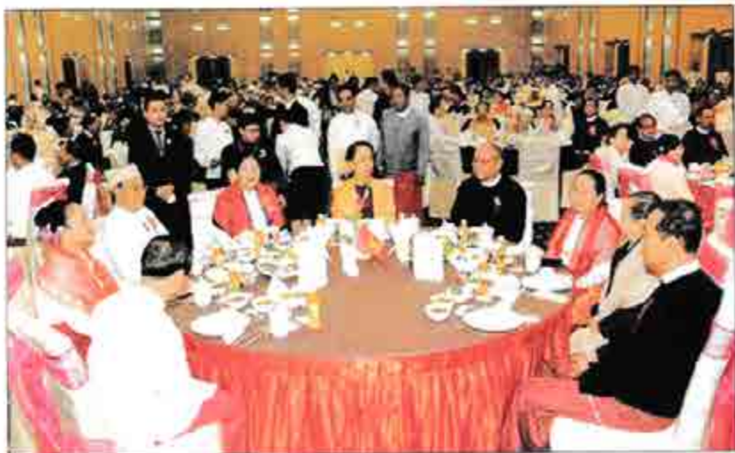
ဒေါ်အောင်ဆန်းစုကြည်၊ သူရဦးရွှေမန်းနှင့် ဦးခင်အောင်မြင်တို့ မွန်ပြည်နယ်နေ့ ဂုဏ်ပြုညစာစားပွဲသို့ တက်ရောက်စဉ်