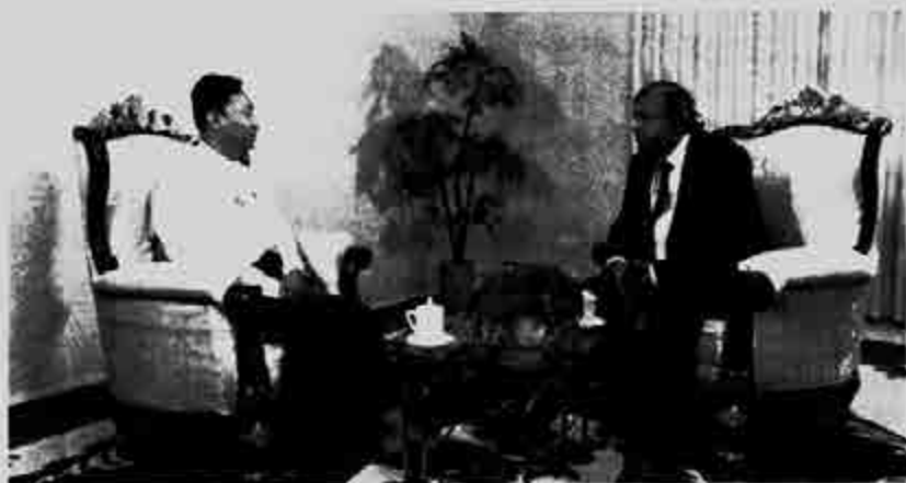
သူရဦးရွှေမန်းအား ဘီဘီစီမှ ၂၈-၇-၂၀၁၅ ဝက်နေ့တွင် သီးသန့်တွေ့ဆုံမေးမြန်းစဉ်

ဘီဘီစီ - ဟုတ်ကဲ့ပါခင်ဗျား ဒီ ၂၀၁၅ ပေါ့လေ၊ ဒီရွေးကောက်ပွဲဟာ ဥက္ကဋ္ဌကြီး အတွက် တယ်လောက်များ အရေးပါ ပါသလဲ ခင်ဗျား။