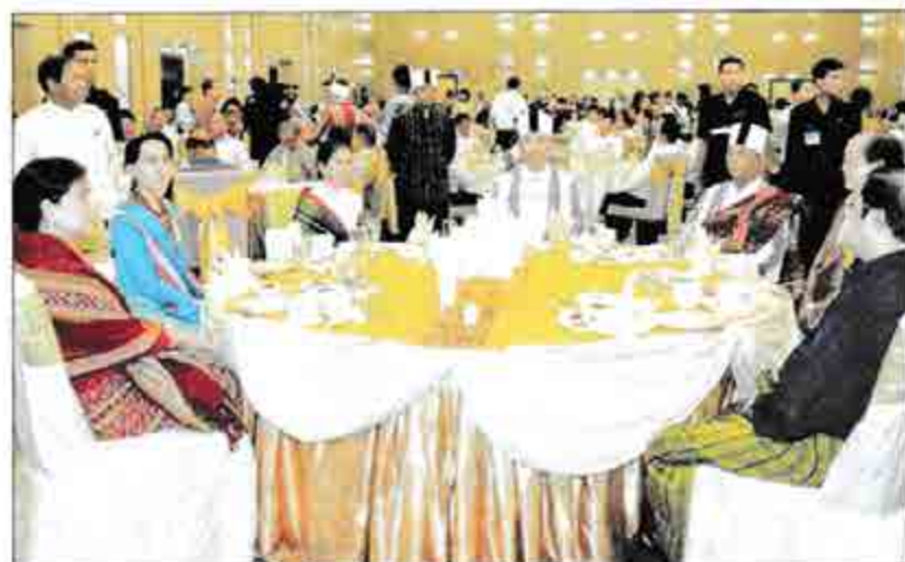
ဒေါ်အောင်ဆန်းစုကြည်၊ သူဇွန်၊ ငွေမန်းနှင့် ဦးခင်အောင်မြင်တို့ ချင်းပြည်နယ်နေ့ ဂုဏ်ပြုညစာစားပွဲသို့ တက်ရောက်စဉ်