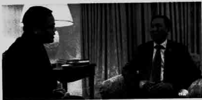
သူရဦးရွှေမန်းအား အာရ်အက်စ်အေက ၁၁-၆-၂၀၁၃ ရက်နေ့တွင် သီးသန့်တွေ့ဆုံမေးမြန်းစဉ်

အမေရိကန်ပြည်ထောင်စုမှာ ရောက်ရှိနေတဲ့ ပြည်သူ့လွှတ်တော် ဥက္ကဋ္ဌ သူရဦးရွှေမန်းကို ဝါရှင်တန်ဒီစီမြို့တော်မှာရှိတဲ့ မြန်မာသံရုံးမှာ ကျွန်တော်မနေ့က သီးသန့်တွေ့ဆုံ မေးမြန်းထားပါတယ်ခင်ဗျာ။