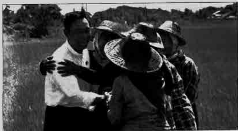
သူရဦးရွှေမန်း ၉-၈-၂၀၁၅ ရက်နေ့က ငြိမ်း-ဘန်းလောင်း လမ်းတစ်လျှောက် ဖြတ်သန်းသွားတာစဉ် ကော်လံကြီးရွာနှင့် အကျပ်အင်မာတို့မှ ကောက်ခိုက်သယံဇာတ ရင်းရင်းနှီးနှီး နှုတ်ဆက်အားပေးခဲ့ကြသည်