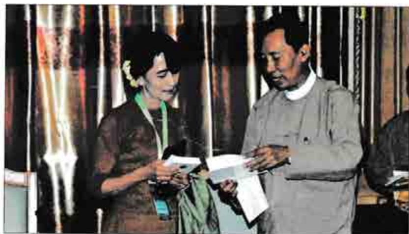
ဒေါ်အောင်ဆန်းစုကြည်နှင့် သူရဦးဌေးမန်း၊ ၂၃-၁-၂၀၁၁ ဇန်နဝါရီ ၁၃၊ ၃၀ နာရီအချိန်တွင် ပြည်သူ့လွှတ်တော်ဥက္ကဋ္ဌမှူးခန်း၌ တွေ့ဆုံခဲ့စဉ်