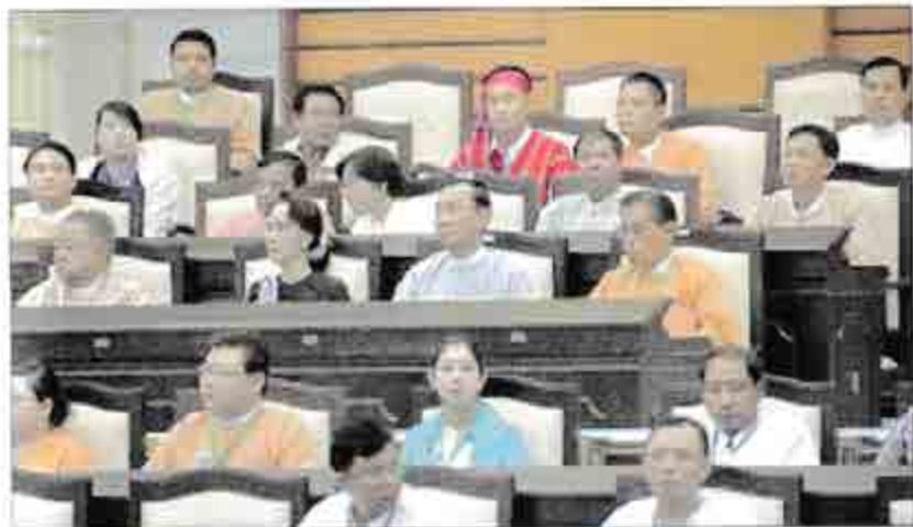
ဒေါ်အောင်ဆန်းစုကြည်၊ သူရဦးရွှေမန်း၊ သူရဦးတင်ဦး၊ ဦးဝင်းထိန်၊ ဒေါက်တာဇော်မြင့်မောင်နှင့်အဖွဲ့ဝင်များ၊ ၃-၂-၂၀၁၆ ရက်နေ့ ခုတ်ယူအကြိမ် အမျိုးသားလွှတ်တော်ပထမပုံမှန်အစည်းအဝေး၊ ပထမနေ့ကျင်းပမှုကို ကြည့်ရှုလေ့လာစဉ်