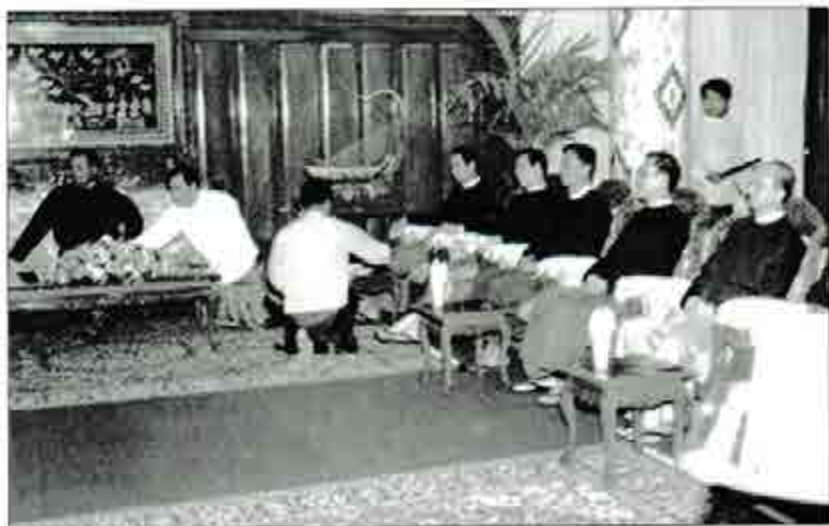
၂၀၁၂ ခုနှစ် ဇူလိုင်လ၊ အမှတ် (၁၄) အင်းလျားလမ်း၊ တပ်မတော်ဌေးလောကတွင် မှာယက်ကွဲက ဒေါ်အောင်ဆန်းစုကြည်၊ ဦးအောင်မွေ သူဌေးဟင်ဦး၊ ဦးလွင်တီနှင့် တွေ့ဆုံပုံစဉ်

လိုက် သကဲ့သို့ ရှိသည်။ ယင်းနေ့တွင် ပြည်သူ့လွှတ်တော် အစည်းအဝေးကျင်းပနေပုံအား လေ့လာကြည့်ရှုသွားသည်။