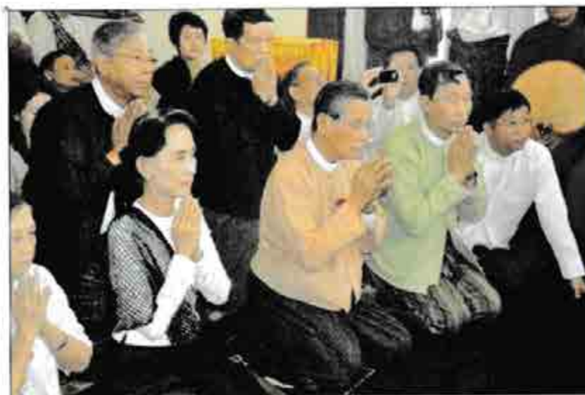
အာဇာနည်ခေါင်းဆောင်ကြီးများအား ရည်စူး၍ ခေါင်းဆောင်ဆန်းစုကြည်နေ့အိမ်တွင် သံဃာတော်များထံမှ ပရိတ်တရားများယူခဲ့စဉ်