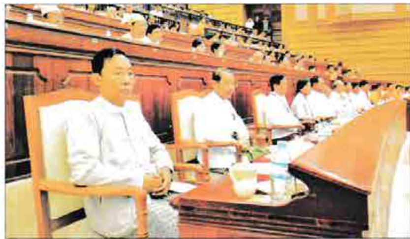
သုခဦးရွှေမန်းနှင့်အစွဲဝင်များ၊ ၁-၂-၂၀၁၆ ရက်နေ့ ဒုတိယအကြိမ် ပြည်သူ့လွှတ်တော်ဝယ်မဟုံမှန်အစည်းအဝေး၊ ပထမနေ့ကျင်းပမှုကို ကြည့်ရှုလေ့လာစဉ်