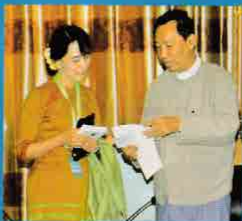
ကျေးဇူးတင်လှ

လျော်ရင်းတက်မကျိုးရအောင်၊ သွားရင်းလမ်းမပျောက်ရအောင် သတိနှင့်ပီရိယထားရသည်။ ဟန်ချက်မပျက်ရန်၊ မယိုင်လဲရန်၊ ထိုအခြေအနေမျိုး ကြုံတွေ့ပါက ဉာဏ်အမြော်အမြင်နှင့် သတ္တိကိုတွဲ၍ ရည်မှန်းချက် မျက်ခြည်မပြတ်ဆောင်ရွက်ခဲ့ကြသည်သူထဲမှာ သူနှင့်ကျွန်တော် ဝါဝင်နေမည်ထင်ပါသည်။ သို့ရာတွင် အထင်သည် အထင်သာဖြစ်၍ မှန်ချင်မှမှန်မည်။ ထိုအတူ မိမိကိုယ်မိမိ ယုံကြည်မှုရှိတာကောင်းသည်။ လွန်ကဲသော ယုံကြည်မှုသည် မကောင်း။ “ကိုယ် အားလုံးမသိ၊ အားလုံးမတတ်၊ အားလုံးမမှန်နိုင်”သည်ကိုတော့ ဆင်ခြင်နိုင်မှတော်ရုံကျမည်။