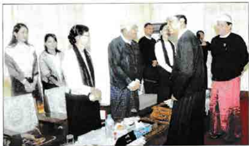
(၆၀)နှစ်ပြောက် အာဇာနည်နေ့ အခမ်းအနားသို့ တက်ရောက်လာကြသည့် သူ့ရခီးရွှေမန်းနှင့် ဦးထွန်းထွန်းတို့က အာဇာနည်ခေါင်းဆောင်ကြီးများ၏ မိသားစုဝင်များအား ရင်းရင်းနှီးနှီးနှုတ်သက်စဉ်