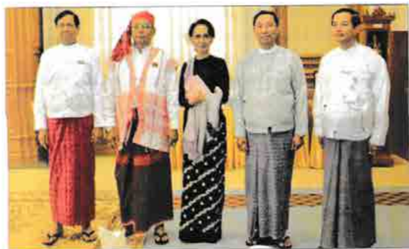
ပြည်ထောင်စုလွှတ်တော်နာယကအား ၃-၂-၂၀၁၆ ရက်နေ့ တာဝန်လွှဲပြောင်းပြီး အမှတ်တရ