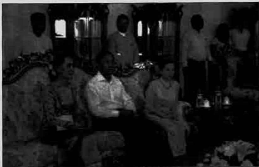
ဒေါ်အောင်ဆန်းစုကြည်၊ သူရဦးရွှေမန်းနှင့် ဇနီးဒေါ်ခင်လေးသက်တို့ ဒုတိယသမ္မတ ဦးဟင်နရီစန်ထီးယူ၏ နေအိမ်တွင်ပြုလုပ်သော အိမ်သစ်တက်မင်္ဂလာပွဲသို့ တက်ရောက်စဉ်