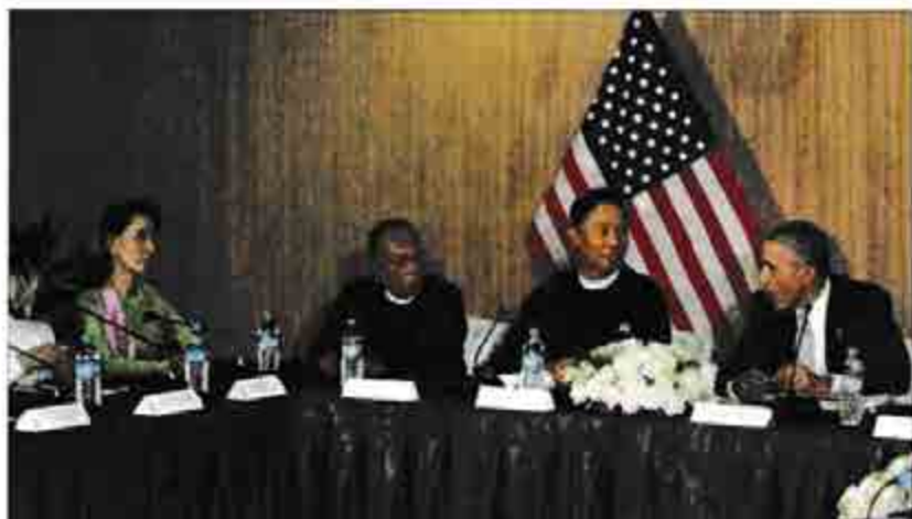
ဒေါ်အောင်ဆန်းစုကြည်၊ သုတေသန၊ ဦးခင်အောင်မြင့်နှင့် အပေမိုက်သမ္မတ အိုဘားမားတို့ ၁၃-၁၁-၂၀၁၄ ရက်နေ့ ၁၅:၀၀ နာရီအချိန်တွင် နေပြည်တော်ရှိ နန်းဝတီဟိုတယ်၌ တွေ့ဆုံဆွေးနွေးစဉ်

စစ်သားတစ်ယောက်ဖြစ်ခဲ့သလို ဝိုင်းရံချုပ်အောင်ဆန်းပြောခဲ့တဲ့စကား အတိုင်းပါပဲ။ "Hope for the best, Prepare for the worst" အကောင်းဆုံးအတွက် မျှော်လင့်ထားသလို အဆိုးဆုံးအတွက်လဲ ပြင်ဆင်ထားပါပြီ။ အဲဒီလို ပြင်ဆင်တဲ့ နေရာမှာ ကျွန်တော့်ရဲ့ ပြင်ဆင်မှုက ကျွန်တော်တို့အသက်ရှင် ကျန်းမာနေသရွေ့ နိုင်ငံနှင့်နိုင်ငံသားအကျိုးစီးပွားအတွက် ဆောင်ရွက်မယ်။ တာဝန်ပေးရင်ပေးတဲ့အပေါ် မူတည်ပြီး ဆောင်ရွက်မယ်။ ပြည်သူများရဲ့ အဆုံးအဖြတ်သာဖြစ်ပါတယ်။"