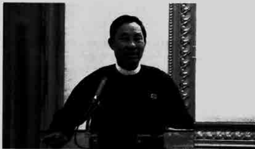
သူရဦးရွှေမန်း ၁၅-၁၀-၂၀၁၅ ရက်နေ့ ပြည်ထောင်စုငြိမ်းချမ်းရေးညီလာခံတွင် အမှာစကားပြောကြားစဉ်