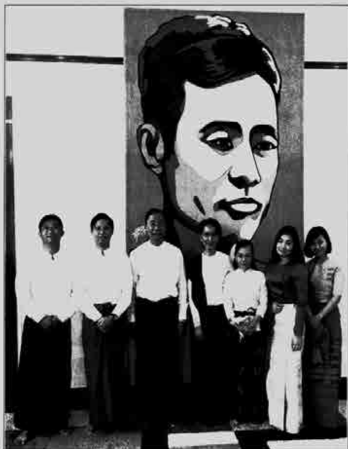
မိုးသားမှူး၊ ပွင့်လင်းမှူး၊ နားလည်မှုတိုက် ယုံကြည်မှုကိုပေးသည်။ ယုံကြည်မှု၊ လေးစားမှုတို့က ပူးပေါင်းဆောင်ရွက်မှုကို တိုးမြှင့်စေသည်။ သူနှင့်ကျွန်တော်မိသားစုများအကြား အပြန်အလှန်နားလည်မှု၊ ယုံကြည်မှု၊ စာနာမှုတို့ရှိသည်။ စေတနာနှင့်မေတ္တာသည် အလျားအနံ့မသိသော်လည်း အသွားအပြန်ရှိသည်ကို ကျွန်တော်တို့ နားလည်ယုံကြည်ထားကြပါသည်။ [မိသားစုနှင့် နှစ်စဉ်တက်ရောက်ပြုလုပ်သည့် ဝိလ်ချပ်အောင်ဆန်းနှင့် အာစာနည်ခေါင်းဆောင်ကြီးများအား ရည်စူး၍ ဒေါ်အောင်ဆန်းစုကြည်နေ့အိမ်၌ သံဃာတော်များအား ဆွမ်းဆက်ကပ်လှူဒါန်းကြရာ (၆၉) နှစ်ပြောက် အာစာနည်နေ့ (၁၉-၇-၂၀၁၆) တွင် မိသားစုများ အမှတ်တရဓာတ်ပုံ]