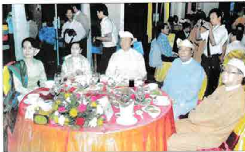
ဒေါ်အောင်ဆန်းစုကြည်၊ သူရဦးရွှေမန်းနှင့် ဦးခင်အောင်မြင်တို့ မွန်ပြည်နယ်နေ့ ဂုဏ်ပြုညစာစားပွဲသို့ တက်ရောက်စဉ်