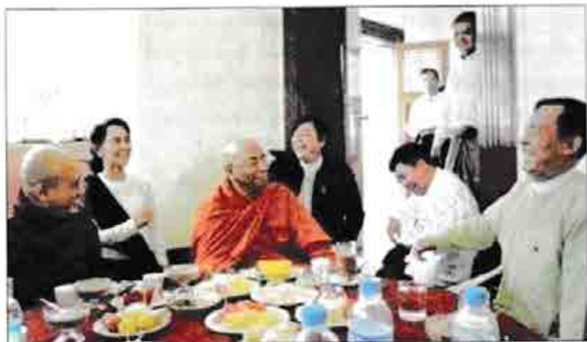
အာဇာနည်ခေါင်းဆောင်ကြီးများအား စည်စူး၍ ၁၉-၇-၂၀၁၄ ရက်နေ့တွင် သီတဂူဆရာတော်၊ အပိုင်ဆရာဝန်နှင့် သံဃာတော်များအား ခေါ်ဆောင်ဆန်းစုကြည့်နေ့အိမ်တွင် ဆွမ်းသက်တပ်လှူဒါန်းစဉ်