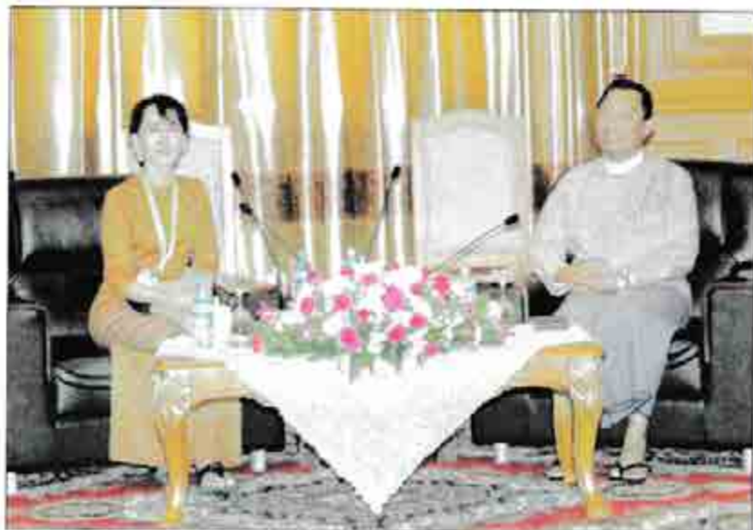
ဒေါ်အောင်ဆန်းစုကြည်နှင့် သူရဦးဌေးမန်း၊ ၂၃-၁-၂၀၁၁ ဇန်နဝါရီ ၁၃၊ ၃၀ နာရီအချိန်တွင် ပြည်သူ့လွှတ်တော်ဥက္ကဋ္ဌမှူးခန်း၌ တွေ့ဆုံခဲ့စဉ်