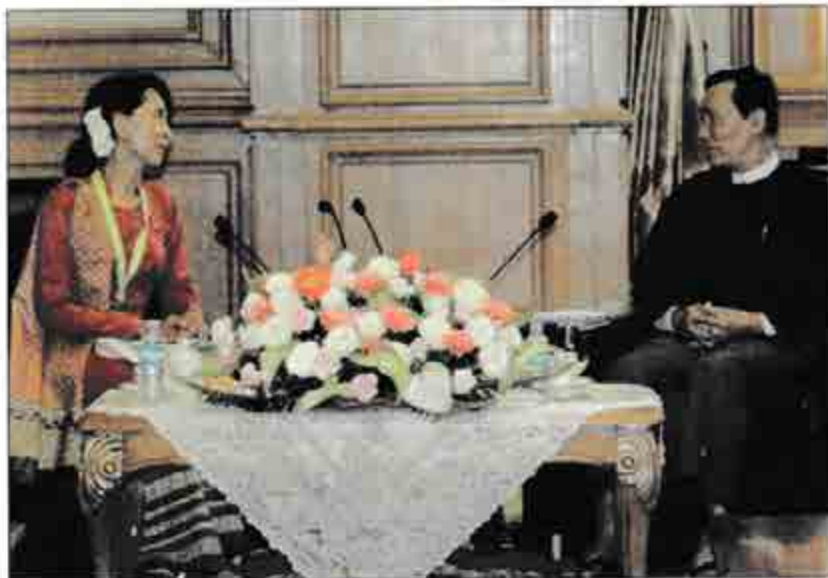
ဒေါ်အောင်ဆန်းစုကြည်နှင့် သုရဦးရွှေမန်း ၂၀၁၃-၂၀၁၂ ခုကနေ ၈၃၀၀ နာရီအချိန်တွင် ပြည်သူ့လွှတ်တော်ဥက္ကဋ္ဌမှူးခန်း၌ တွေ့ဆုံဆွေးနွေးစဉ်

သူနှင့် ကျွန်တော်တို့ ညှိနှိုင်းပြီးနောက် ပြည်သူ့လွှတ်တော် တရားဥပဒေစိုးမိုးရေး နှင့် တည်ငြိမ်အေးချမ်းရေး ကော်မတီ၏ ဥက္ကဋ္ဌအဖြစ် သူ့တာဝန်ယူခဲ့သည်။ ယင်းတာဝန်အား သူကဥက္ကဋ္ဌအဖြစ် တာဝန်ယူခဲ့ခြင်းကြောင့်သာ များစွာခရီးရောက်ခဲ့သည်ဟုပြောနိုင်ပါသည်။ ကော်မတီဥက္ကဋ္ဌ တာဝန်ယူပြီးနောက် ကော်မတီ၏လုပ်ငန်းများ နှင့် စပ်လျဉ်း၍ မကြာခဏ တွေ့ဆုံဆွေးနွေးဖြစ်ကြသည်။ လုပ်ငန်းတာဝန်ဖြင့် ရန်ကုန်မြို့သို့ ရောက်ရှိစဉ်တွင်လည်း သူသည်ကျွန်တော်၏နေအိမ်သို့လာရောက်တွေ့ဆုံဖူးသလို အင်းလျားလမ်းရှိ ရန်ကုန်လွှတ်တော်ရုံးခွဲတွင်လည်း မကြာခဏတွေ့ဆုံဆွေးနွေးဖြစ်ခဲ့ကြသည်။ ရန်ကုန်လွှတ်တော်ရုံးခွဲတွင်လုစံနိုင်ခြင်းကြောင့် သူ၏တရားဥပဒေစိုးမိုးရေး ဆိုင်ရာလုပ်ငန်းများ ဆောင်ရွက်ရာတွင် များစွာအဆင်ပြေခဲ့သည်။