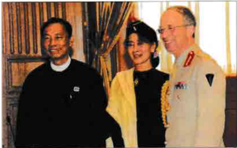
ဒေါ်အောင်ဆန်းစုကြည်၊ သုခဦးရွှေမန်းနှင့် ဗြိတိန်နိုင်ငံ ကကွယ်ရေးဦးစီးချုပ် General David Richards တို့ ၃-၆-၂၀၁၃ ရက်နေ့ ပြည်သူ့လွတ်တော်ဥက္ကဋ္ဌခန်းတွင် တွေ့ဆုံဆွေးနွေးပြောဆိုချက် မှတ်တမ်းတင်စာတိုပိုက်စဉ်

“ရှိပါတယ်။ နားလည်မှု၊ သဘောတူညီမှု၊ ယုံကြည်မှုတွေရှိပါတယ်။ ဒါကဘာလဲဆိုရင် ကျွန်တော်တို့နိုင်ငံတော်နဲ့ နိုင်ငံသားအကျိုးစီးပွားအတွက်ဆိုရင် ကျွန်တော်တို့