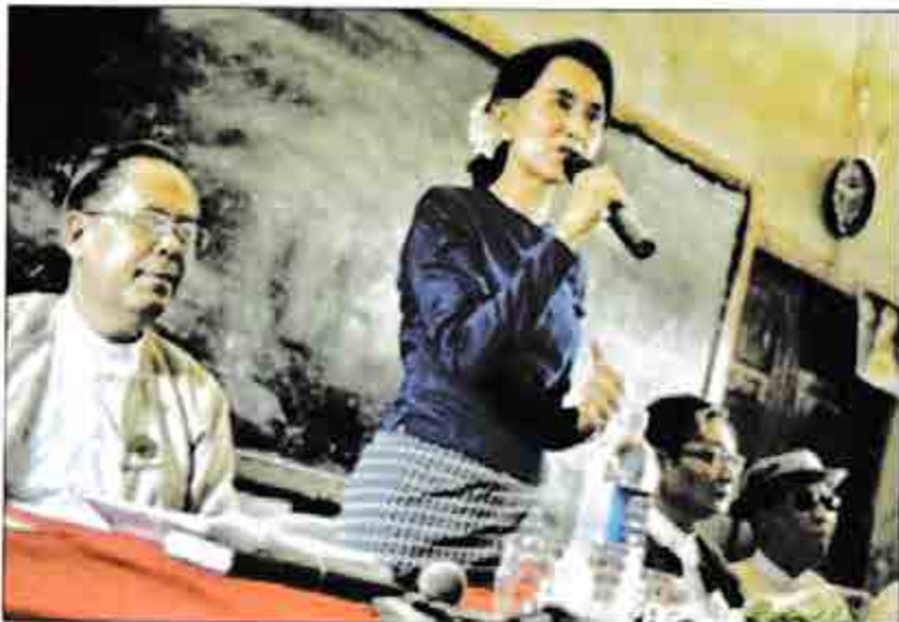
လက်ပံတောင်းတောင်ကြားနီမီမံတိန်းစုံစမ်းစစ်ဆေးရေးကော်မရှင်၏အစီရင်ခံစာနှင့် စပ်လျဉ်း၍ ဒေါ်အောင်ဆန်းစုကြည်က ၁၃-၃-၂၀၁၃ ရက်နေ့တွင် ဒေသခံများအား ရှင်းလင်းဆွေးနွေးခဲ့စဉ်

၂၀၁၂ ခုနှစ်တွင် လက်ပံတောင်းတောင် အရေးအခင်းသည် ကြီးမားကျယ်ပြန့်လာခဲ့ရာ အစိုးရအတွက် အကျပ်အတည်းတစ်ရပ် ဖြစ်စေခဲ့သည်။ သူသာလျှင် ထိုကိစ္စကို ကိုင်တွယ်ဖြေရှင်းနိုင်လိမ့်မည်ဟု နိုင်ငံတော်သမ္မတက ယူဆပုံရသည်။ ဒါကြောင့်ပင် ဒီတာဝန်ကို လက်ခံဆောင်ရွက်ပေးနိုင်ရေးအတွက် အကူအညီတောင်းလိုကြောင်း နိုင်ငံတော်သမ္မတက ကျွန်တော်ထံ ဆက်သွယ်ပြောကြားလာရာ ကျွန်တော်က ကောင်းပါတယ်ဟု ထောက်ခံပြောဆိုခဲ့သည်။ ထိုအခါ သမ္မတက သူပြောရင်ရမှာမဟုတ်ဘူး၊ ကိုရွှေမန်းပြောပေးမှရမယ်ထင်တယ်ဟု ဆိုလာသည်။ ကျွန်တော်မှာ ပြည်ပခရီးစဉ် ထွက်ခွာမည့်ဆဲဆဲ လေယာဉ်ပေါ်တက်ခါနီးဖြစ်၍ အချိန်လျဉ်း သူထံ ဖုန်းဆက်၍ တိုက်တွန်းမေတ္တာရပ်ခံခဲ့ရသည်။ ထိုအခါ သူက ကျွန်တော့၏ မေတ္တာရပ်ခံချက်ကို အလေးထား