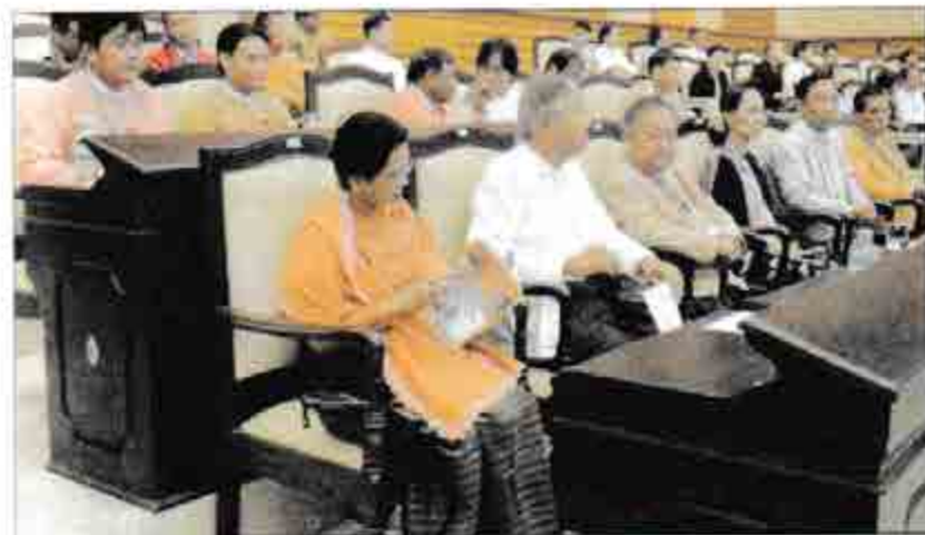
ဒေါ်အောင်ဆန်းစုကြည်၊ သူရဦးရွှေမန်း၊ သူရဦးတင်ဦး၊ ဦးထင်ကျော်၊ ဒေါ်စုစုလွင်၊ ဦးဝင်းထိန်နှင့်ဒေါက်တာဇော်မြင့်မောင် ခုတ်ယူအကြိမ်အမျိုးသားလွှတ်တော် ပထမပုံမှန်အစည်းအဝေး၊ ပထမနေ့ကျင်းပမှုကို ကြည့်ရှုလေ့လာစဉ်