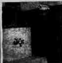
ပြည်ထောင်စုမြောက်ပိုင်းတော် ဝန်ထုပ်ဝန်ပိုးများအဖွဲ့အစည်းတော်မှလွှတ် ပြန်သောမြို့ပေါ်မြို့နယ်အောက်ရပ်ကွက် ၂၃၅၅ ဝယ်ပေးသည့်ပုံစံဖြင့် နှိုင်းယှဉ်ခြင်းအခါ အပူပေးပေးရာ မဲပုံအပူပေးပုံစံ (သတင်းစဉ်)