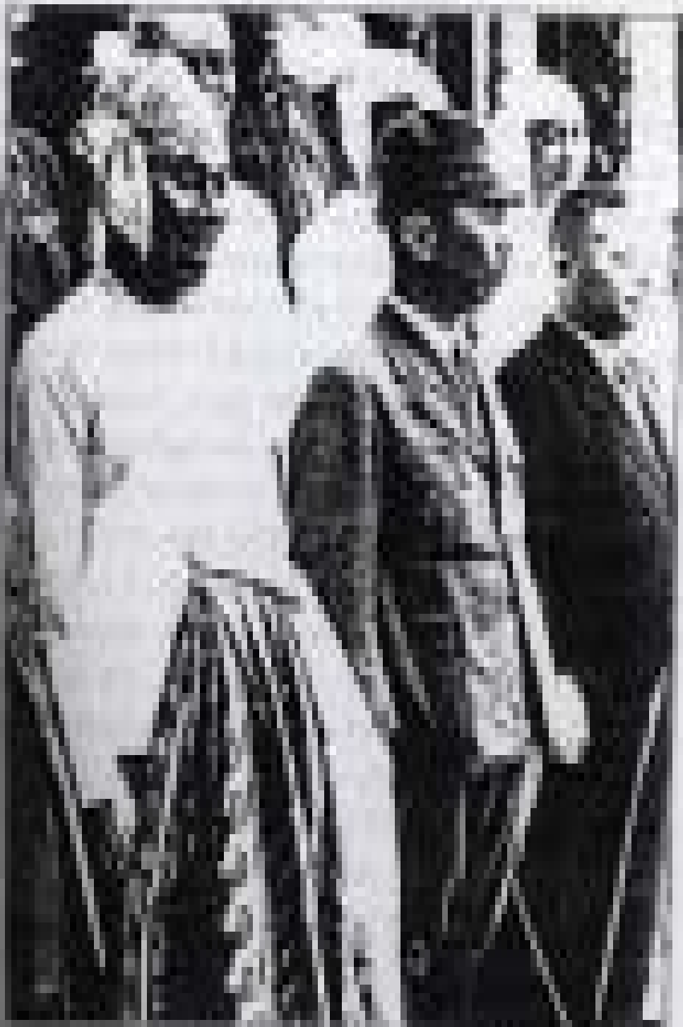
မြန်မာနိုင်ငံသို့ဂျပန်တို့ဝင်လာခြင်းနှင့် ရခိုင်ဒေသ ဖက်ဆစ်တော်လှန်ရေး