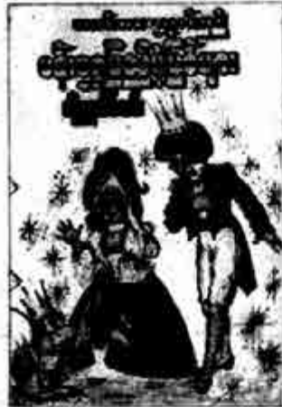
စာမူစွန့်ပြန်ချက် - ၁၉၆ / ၉၁ (၉)

တိုက်ရင်းခိုက်ရင်းကြားက အသက်ရှူချိန်ကလေးကို အရယူ၍ မက်ကဘက်က ခြိမ်းချောက်လိုက်၏။