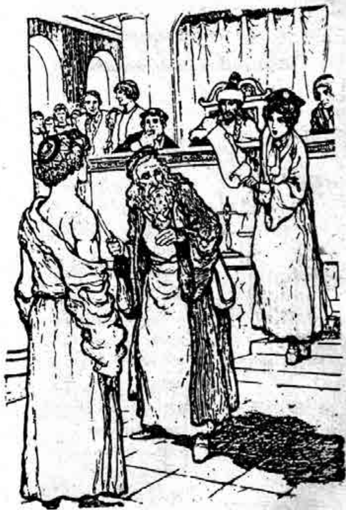
'စင်းနှစ်မြို့က ကျန်သည်' မှ