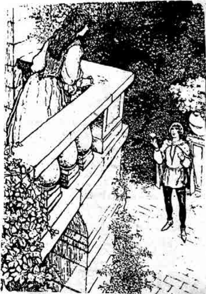
'ရိုမီယိုနှင့်ဂျူလီယက်' မှ