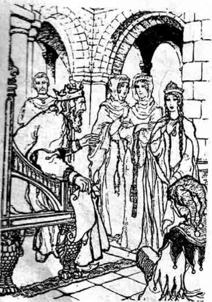
'လိယာဘုရင်ကြီး' မှ