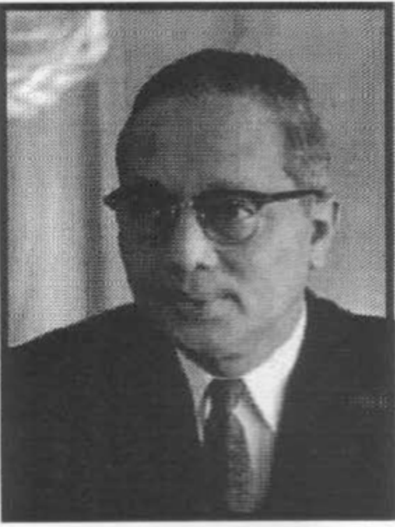
ကုလသမဂ္ဂ အတွင်းရေးမှူးချုပ်ဟောင်း ဦးသန့် (၁၉၀၉ - ၁၉၇၄)

ယဉ်ကျေးသော ကျောင်းသူ ကျောင်းသားများဖြစ်ကြ၍ စည်းကမ်းရှိကြပါသည်။ သုံးယောက်တစ်တွဲ တက္ကသိုလ်အလိုက် စီတန်းနေရာယူပြီး ရန်ကုန်စက်မှုတက္ကသိုလ်မှ ကားတစ်စီး၊ ဝိဇ္ဇာနှင့် သိပ္ပံတက္ကသိုလ်မှ ကားတစ်စီး၊ အသံခွဲစက်များနှင့် “ကျွန်တော်တို့ ကျောင်းသားထုသည် ငြိမ်းချမ်းရေးစိသုကာကြီး ဦးသန့်၏ နောက်ဆုံးခရီးသို့ လိုက်ပါပို့ဆောင်ရန်နှင့် နောက်ဆုံး ဂါဝရပြုလုပ်ရန် စည်းကမ်းတကျ ချီတက်လာကြောင်း ကြေညာပါသည်” လမ်းခရီးတစ်လျှောက်မှာလည်း ကျေနပ်ခြင်းအပြုနှင့် လူအုပ်ကြီးများက ကြိုဆိုကြသည်သာမက သောက်ရေများ၊ ဖီးကြမ်းငှက်ပျောသီးများ ဝေငှပေးခြင်းဖြင့် ခြေကျင်လျှောက်လာသော