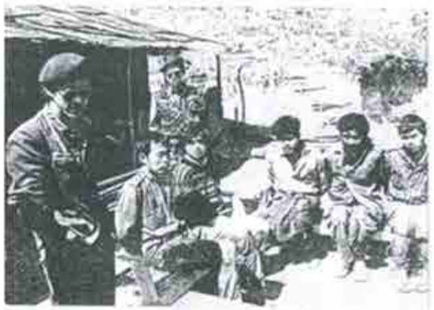
အောင်နိုင်နီနှင့် အသံတို့

"ရှေ့နယ်အောင်နိုင် ရဲ့ အသံကို ကြားရတိုင်း ပါဂျောင်စခန်းမှာ ညှင်းဆဲ နှိပ်စက်ခံရတဲ့ အသံတွေကို ကြားနေရတယ်။ သူ့အသံမှာ မကောင်းဆိုးဝါး တစ်ကောင်ရဲ့ အစိုးအငွေ့တွေ ရိုက်ခတ်နေတယ်" လို့ အသက်မသေပဲ ပြည်တွင်းကို ပြန်ရောက်သွားတဲ့ ကျောင်းသားတပ်မတော်ရဲဘော်ဟောင်း တွေက ရင်ဖွင့်ပြလေ့ရှိကြတယ်။ တကယ်တော့ ရှေ့နယ်အောင်နိုင် ဆိုတဲ့သူဟာ လွန်ခဲ့တဲ့အနစ် (၂၀) လောက်က မြောက်ပိုင်းဒေသမှာ မတရားသဖြင့် စွပ်စွဲ သတ်ဖြတ် ခဲ့တဲ့ အစုလိုက်အပြုံလိုက် လူသတ်မှု တွေကို လူတွေမေ့ပျောက်လောက်ပြီ လို့ ထင်နေသလားမသိပါဘူး။