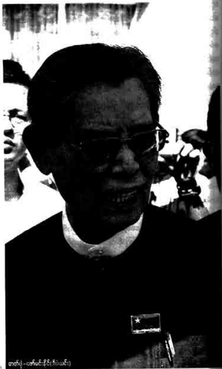
တော်လှုံ - ငွေတိုက်ဆိုင် (ဒီပဲယင်း)