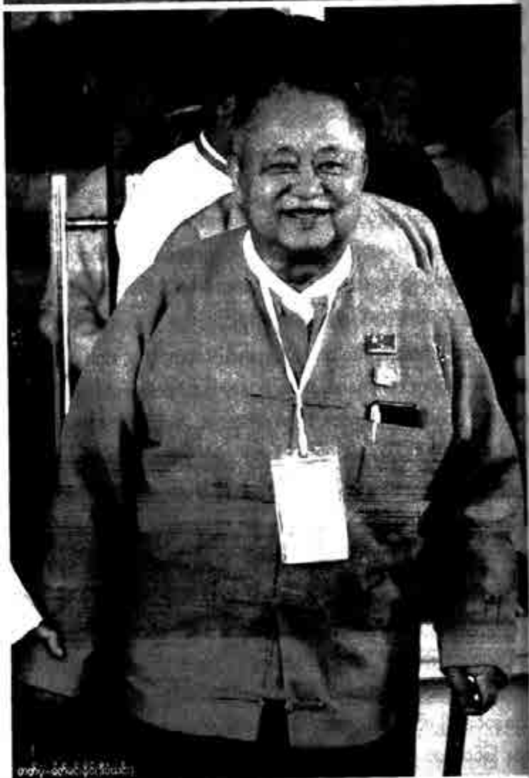
တက္ကသိုလ်ကျောင်းတော်