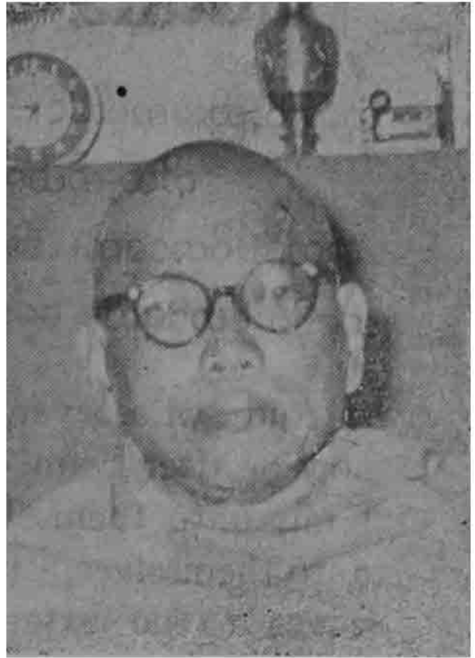
တောင်တွင်းအကျော်- ဆရာတော် - သျှင် ဥက္ကဋ္ဌ