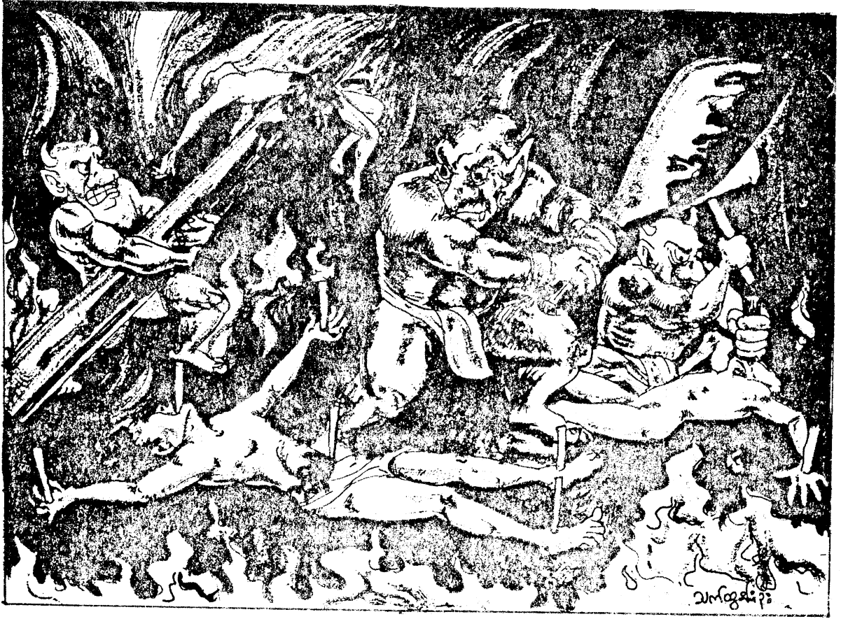
ကန္ဓသုတ်ငရဲ