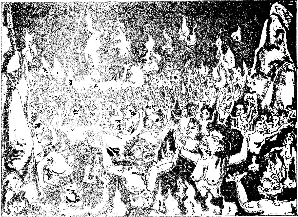
သံဃာတင်ရံ