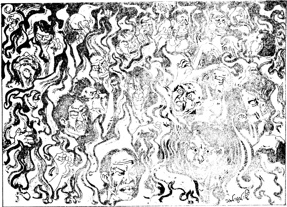
အဝိစိငရဲ