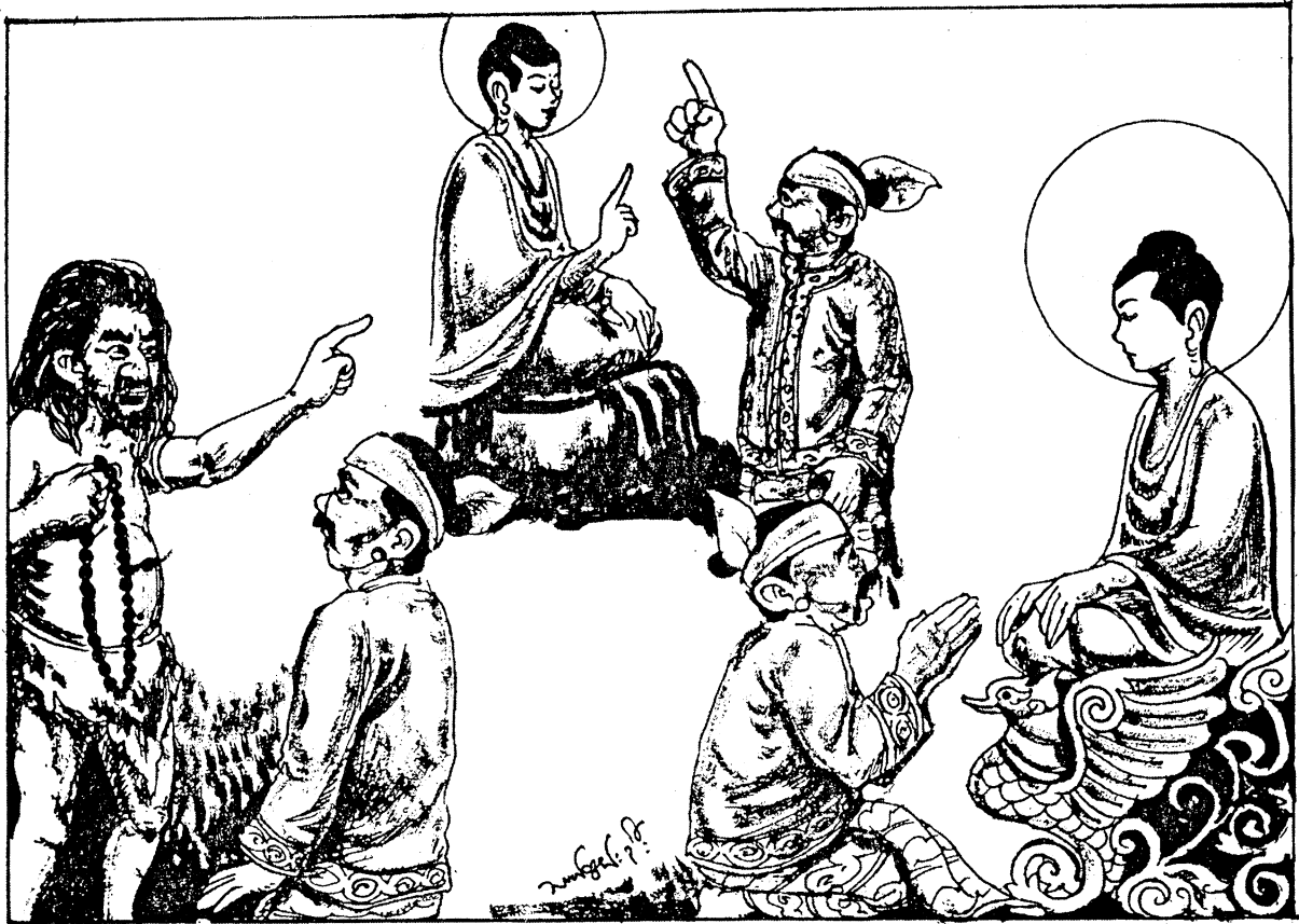
ဥပါသိကောဏ်ပွဲ