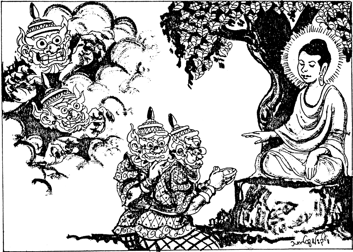
သုခိလကမ္ဘာ ခုရကမ္ဘာအောင်ပွဲ