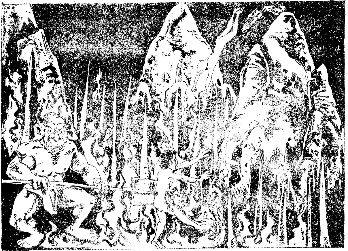
မဟာတာပနငှါ