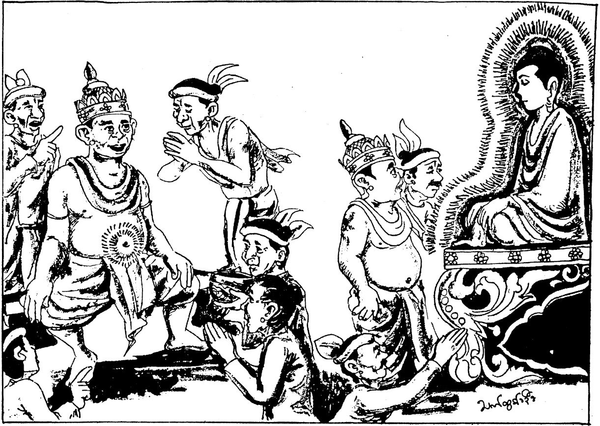
ဝိနာအောင်ပွဲ