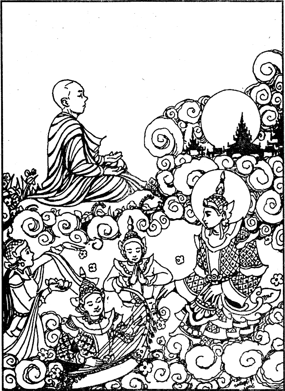
အရှင်မောဂ္ဂလာန်သည် နတ်ပြည်၌ နတ်သားနတ်သမီးတို့၏ စည်းစိမ်ချမ်းသာကို တွေ့မြင်ရပုံ