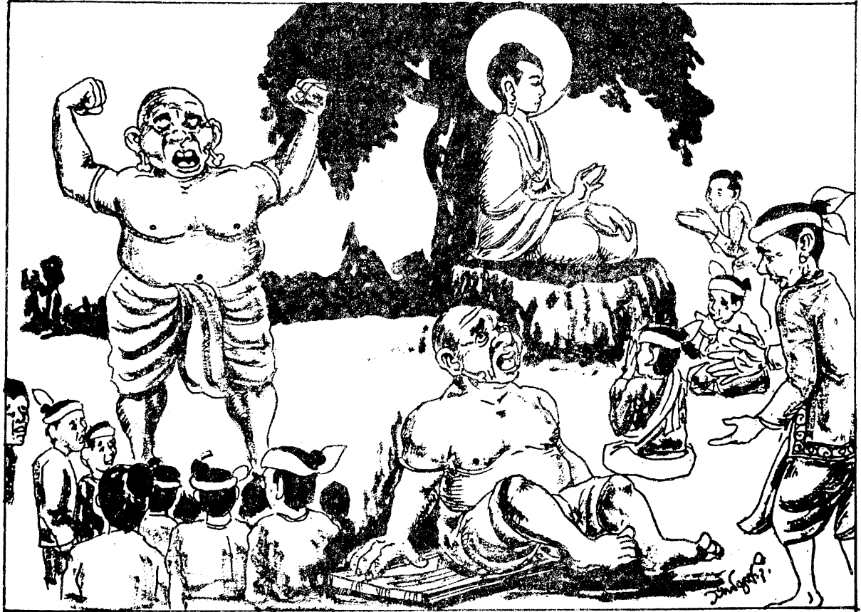
ပါထိကပုတ္တအောင်ပွဲ