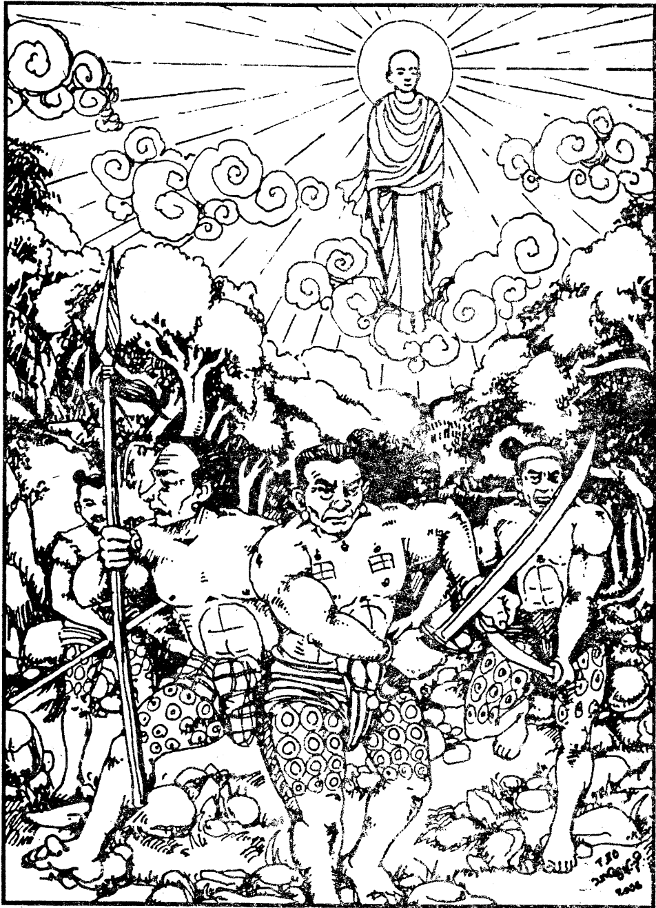
အရှင်မောဂ္ဂလာန်သည် လူသတ်သမားတို့ လာသည်ကိုသိ၍ တန်ခိုးတော်ဖြင့် ရှောင်တိမ်းနေပုံ