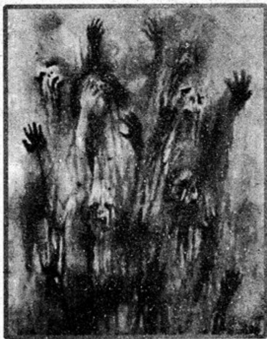
အရှေ့ဘက်ကောင်းကင် စာပေ