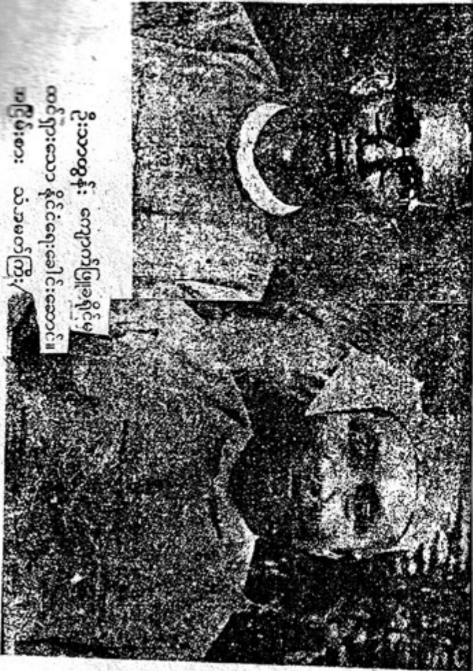
ဦးသာထွန်း ကျောက်ဖြူခရိုင်မှ ထင်ရှားသော နိုင်ငံရေးခေါင်းဆောင်။ အငြိမ်းစား သံအမတ်ကြီး

ဖက်ဆစ်ဂျပန်တော်လှန်ရေးအတွက် ကျောက်ဖြူခရိုင်၊ လေထီးစစ်သည် ဦးဘဇော်