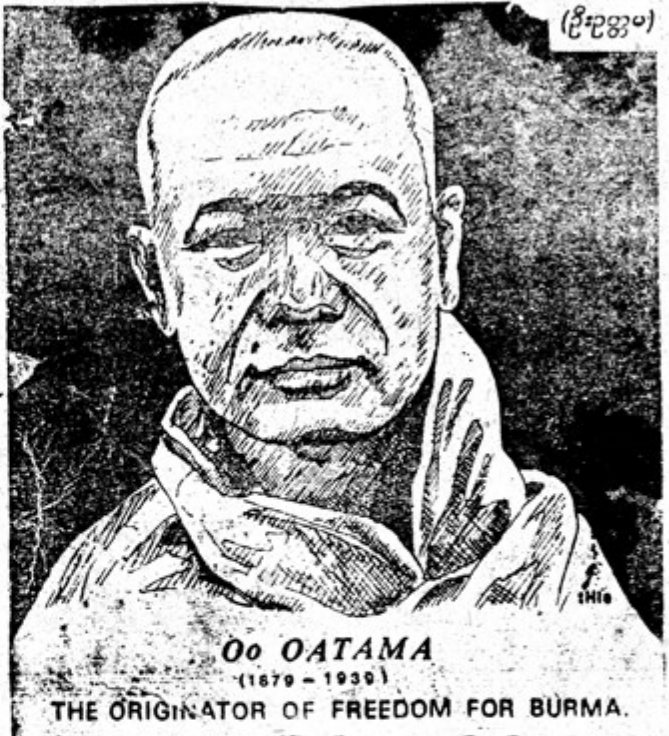
Oo OATAMA (1879 - 1939) THE ORIGINATOR OF FREEDOM FOR BURMA.