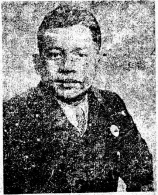
ကိုညိုထွန်း

ဖက်ဆစ်ဂျပန်တော်လှန်ရေးအတွက် ကျောက်ဖြူခရိုင်၊ လေထီးစစ်သည် ဦးဘဇော်