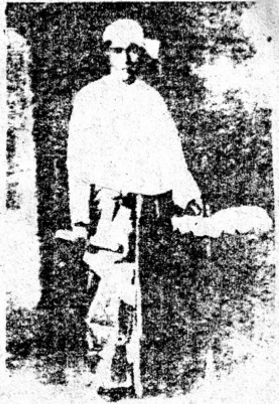
ဦးအောင်စံစေ (ဝန်ကြီးဟောင်း)