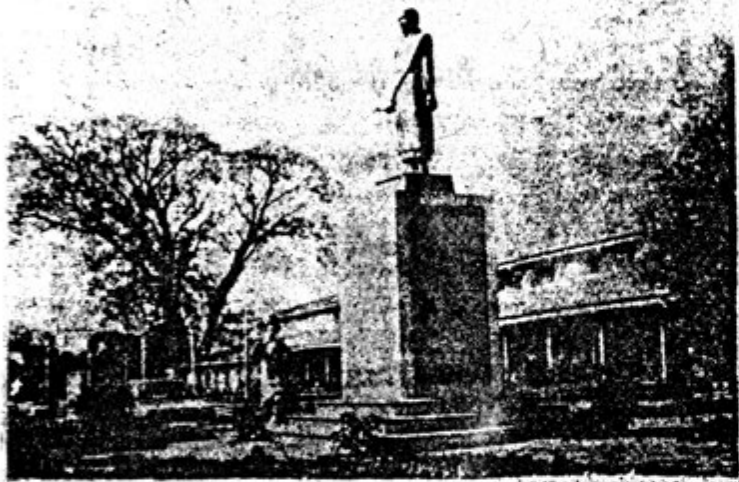
ရန်ကင်းရပ်ကွက်၊ ဝမ်းကျောင်း၊ ဦးညွန့်အောင်၏အမှတ်ပေးခြင်းကို နှိုက်ထုတ်ထားသော ဦးညွန့်အောင်ရုပ်တု