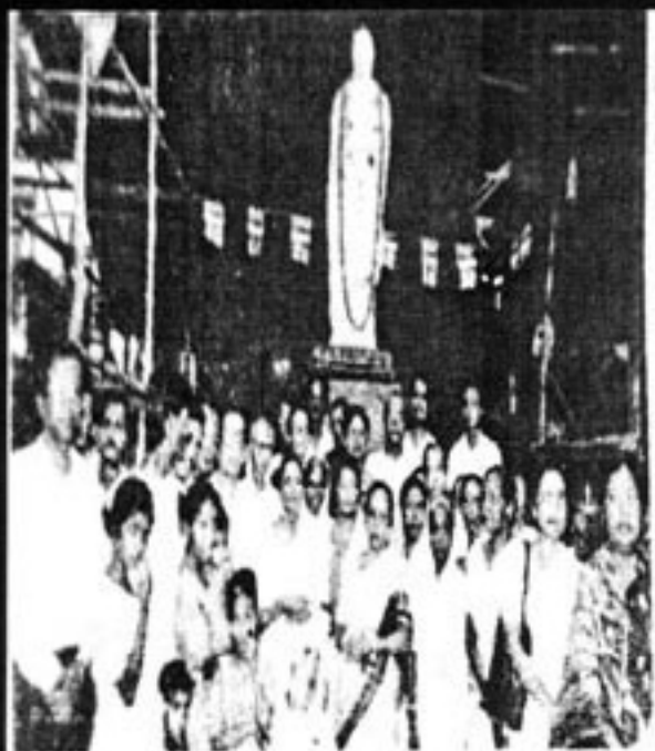
Dharmapala Day Celebrations – Devotees before the Dharmapala statue