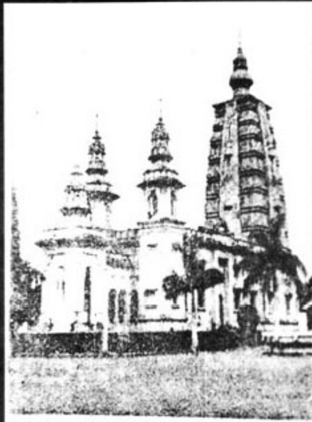
The Mulagandhakuty Vihara at Sarnath