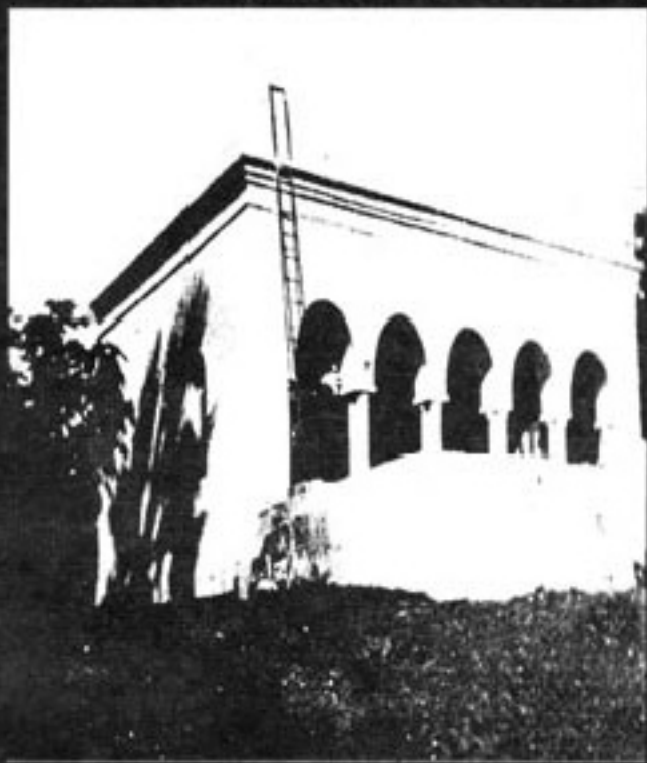
သီပေါမင်းကြား၊ ကုသိုလ်တော်ဇရပ်