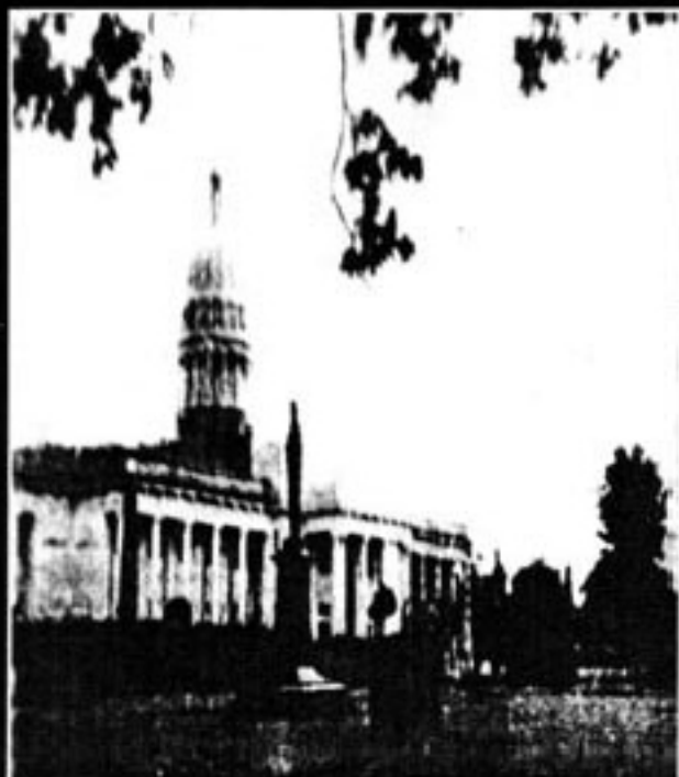
Valparaíso. National Congress Building in Valparaíso (over Park, Chile), Schaeffer against the Town Hall.

ကိုလန်ဘိုမြို့၊ မြို့တော်ခန်းမရှေ့ရှိ ဓမ္မပါလ ကြေးရုပ်