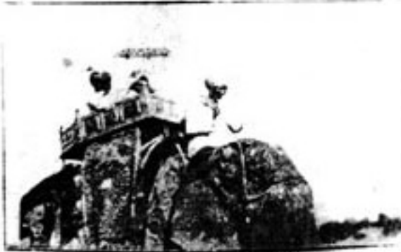
မြတ်စွာဘုရားအောင်သာတော်ကို ဝမ်းသာစွာ ကြိုဆိုကြောင်းနှင့် ပညာတော်ကို ကျင့်ကြံကြောင်း

အရှင်ဗုဒ္ဓအား ဝမ်းသာစွာ ကြိုဆိုကြောင်း ဝမ်းသာစွာ ကြိုဆိုကြောင်း ပညာတော်ကို ကျင့်ကြံကြောင်း ပညာတော်ကို ကျင့်ကြံကြောင်း ဝမ်းသာစွာ ကြိုဆိုကြောင်း ဝမ်းသာစွာ ကြိုဆိုကြောင်း ပညာတော်ကို ကျင့်ကြံကြောင်း ပညာတော်ကို ကျင့်ကြံကြောင်း ဝမ်းသာစွာ ကြိုဆိုကြောင်း ဝမ်းသာစွာ ကြိုဆိုကြောင်း ပညာတော်ကို ကျင့်ကြံကြောင်း ပညာတော်ကို ကျင့်ကြံကြောင်း ဝမ်းသာစွာ ကြိုဆိုကြောင်း ဝမ်းသာစွာ ကြိုဆိုကြောင်း ပညာတော်ကို ကျင့်ကြံကြောင်း ပညာတော်ကို ကျင့်ကြံကြောင်း ဝမ်းသာစွာ ကြိုဆိုကြောင်း ဝမ်းသာစွာ ကြိုဆိုကြောင်း ပညာတော်ကို ကျင့်ကြံကြောင်း ပညာတော်ကို ကျင့်ကြံကြောင်း