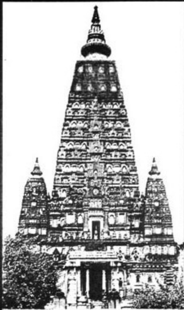
MAHASTUPA TEMPLE - BUJANGAYA