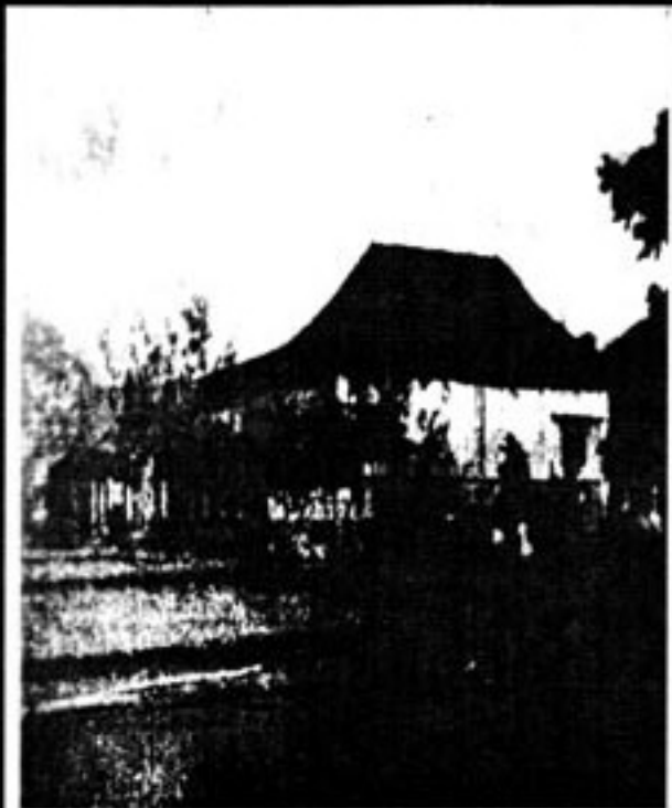
Location : Deewanala Vshakaya, Colombo, Ceylon, where the Hon. Mrs. Sirimavo Bandaranaike, Prime Minister of Ceylon, laid the Foundation Stone of a hall costing Rs. 30,000 to commemorate the Birth Centenary.

တို့လန်တိုဝန်ကြီးချုပ် ဖွင့်လှစ်ပေးသော၊ ဓမ္မပါလအိမ်နေရာ ကျောက်တိုင်