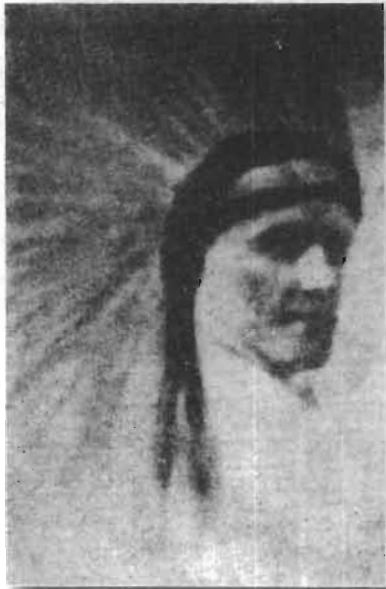
အက်စတယ်ရောဘတ်၏ လမ်းညွှန်နတ် “တိမ်နီ” (Red Cloud) က ကိုယ်ထင်ပြသဖြင့် ရိုက်ကူးထားသည့် ဓာတ်ပုံ