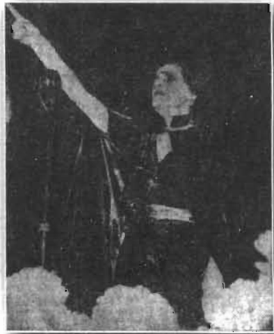
တမလွန် လောကမှ သတင်းစကားကို လူထုပရိသတ် အတွင်းရှိ သက်ဆိုင်ရာ ပုဂ္ဂိုလ်တို့အား လက်ညှိုးထိုးကာ အက်စတယ်ရောဘတ် ပြောကြားနေပုံ... (စာမျက်နှာ ၉၂ ရှု)