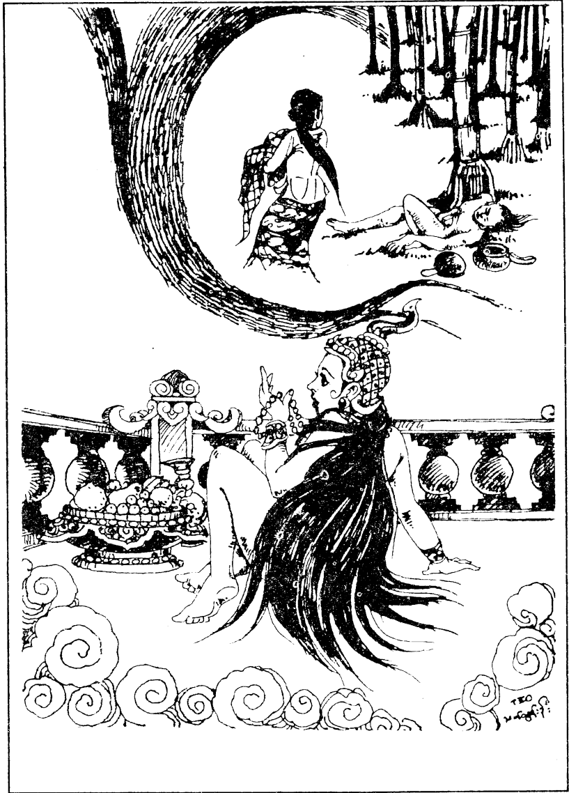
ခေါင်းတုံးမ