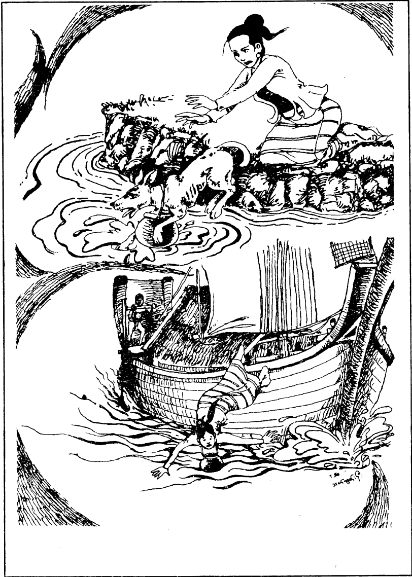
ငွေ့ချစ်ပိန်းယ