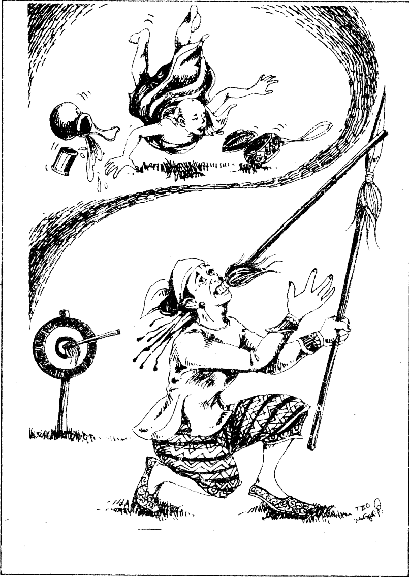
သေသောက်ရဟန်းနှင့် လှံခန်သမား