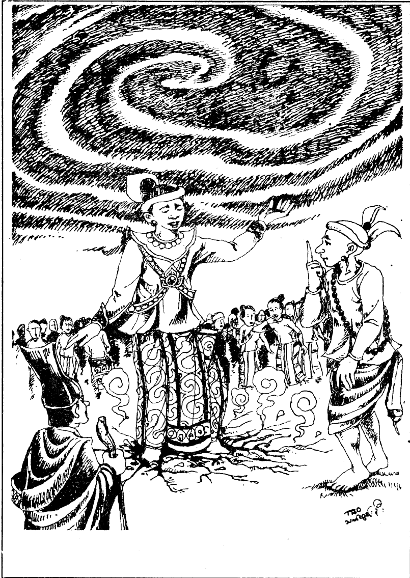
ဆိုရဲဘုရင်