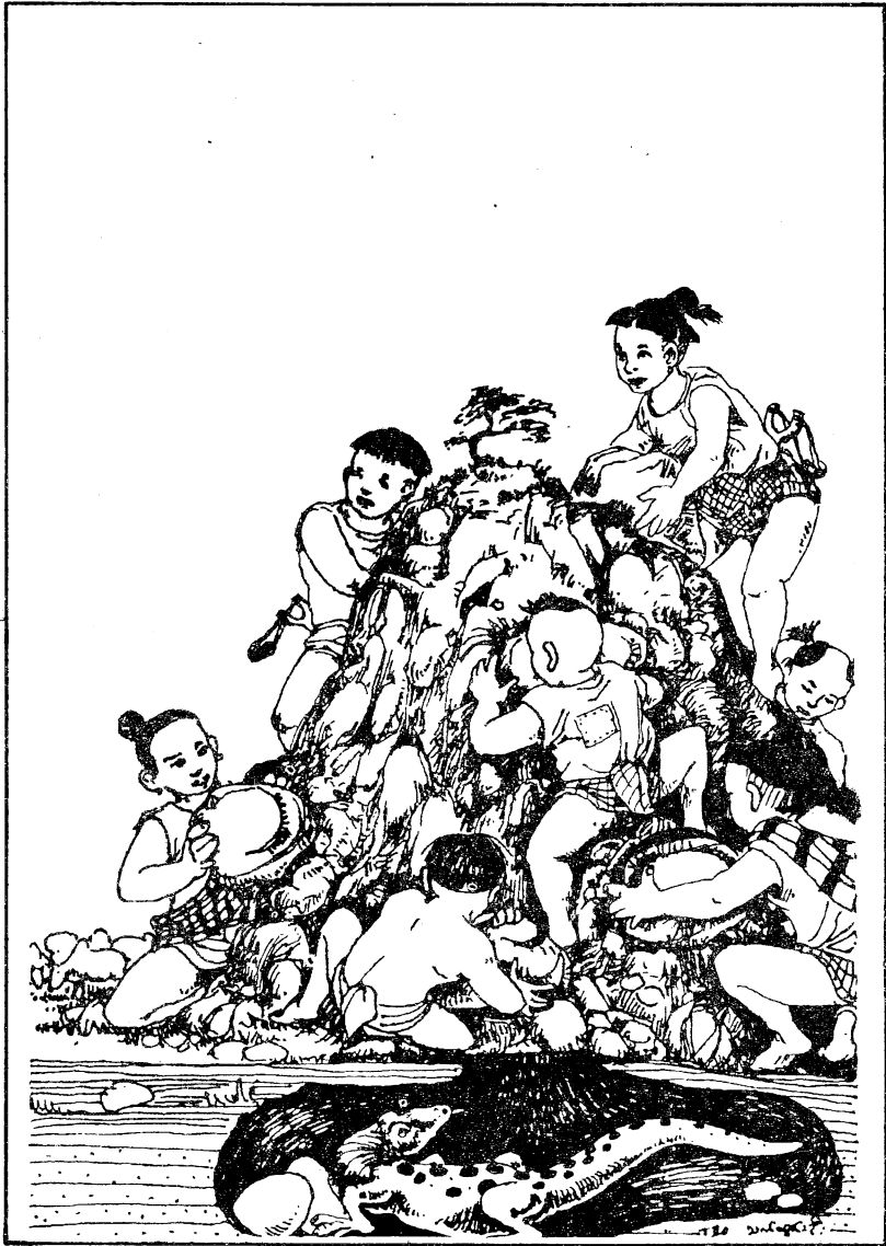
နွားကျောင်းသား ၇ ယောက်