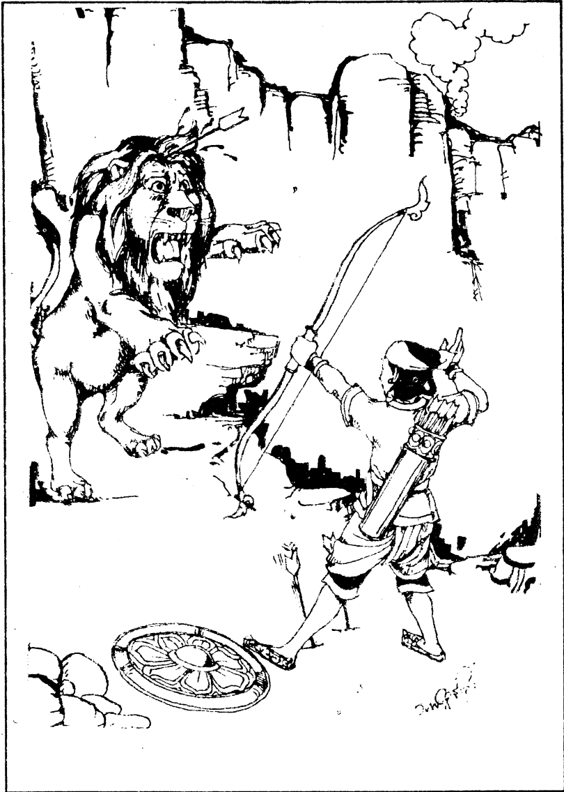
မေတ္တာနှင့်ဒေါသ သရုပ်ဖော် “သီဟဗဟုဝတ္ထု”