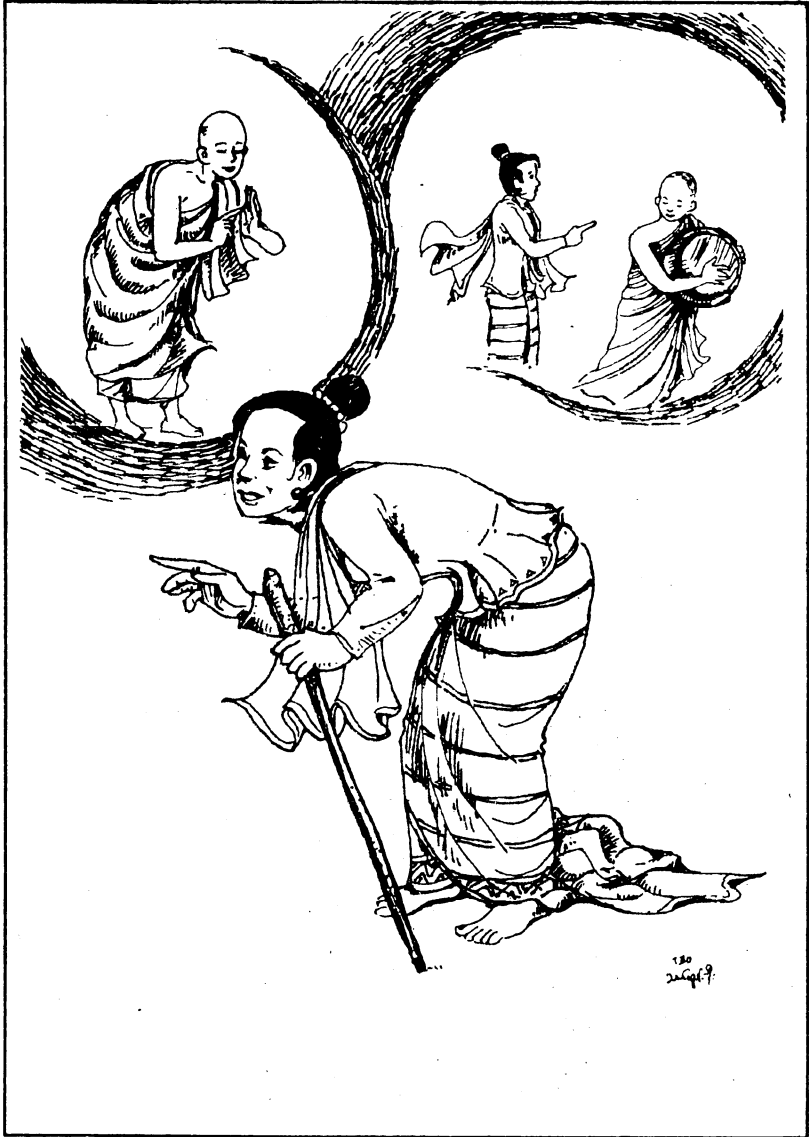
ခါးကုန်းမ