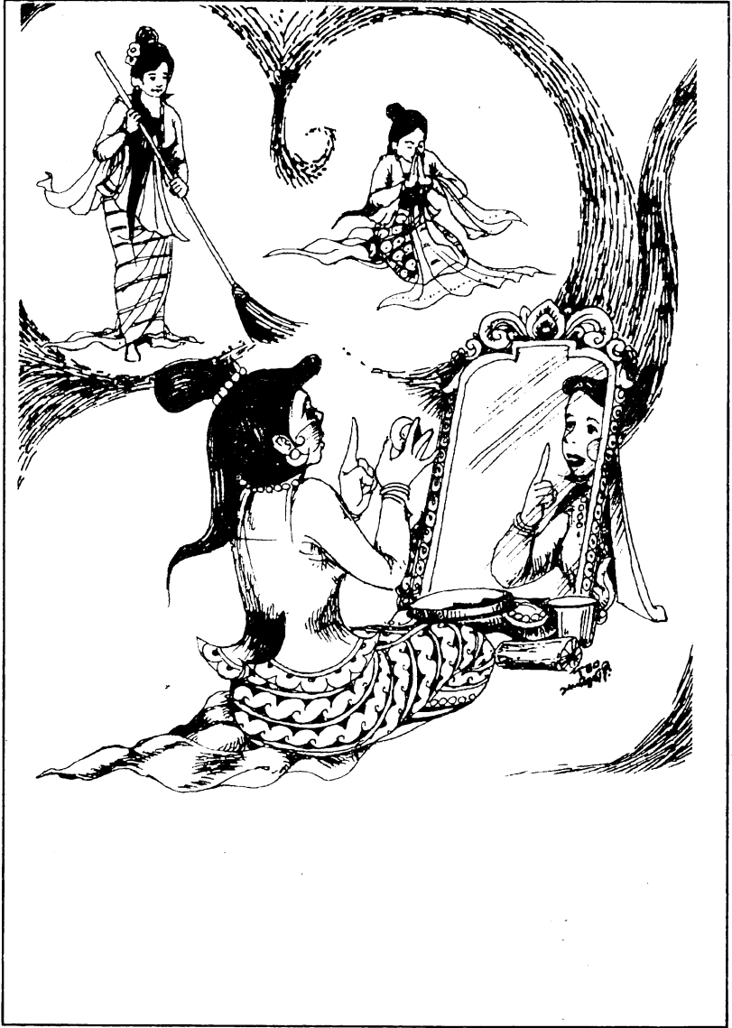
လှဆိပ်တင်