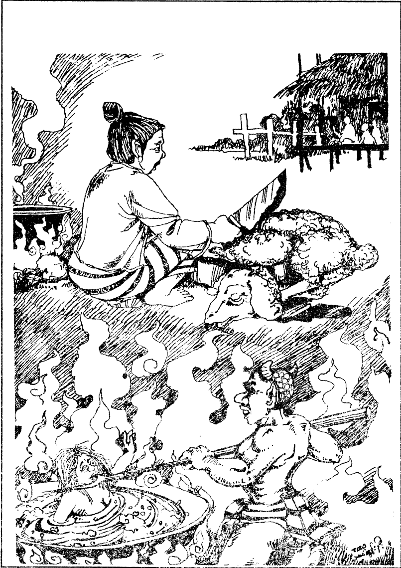
အိမ်ရှင်မ