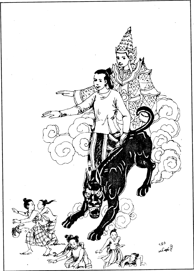
ဘိုးတော်သိကြားမင်း