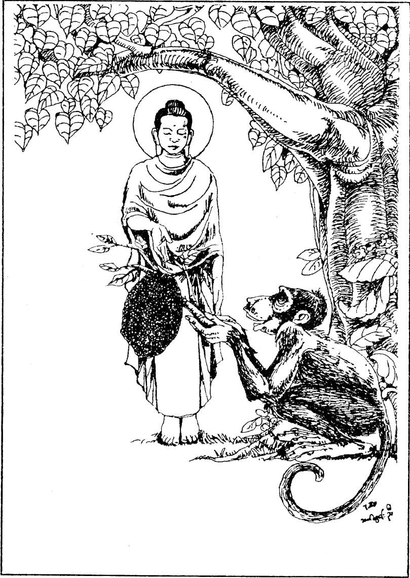
ကံကောင်းတဲ့မျောက်ကြီး