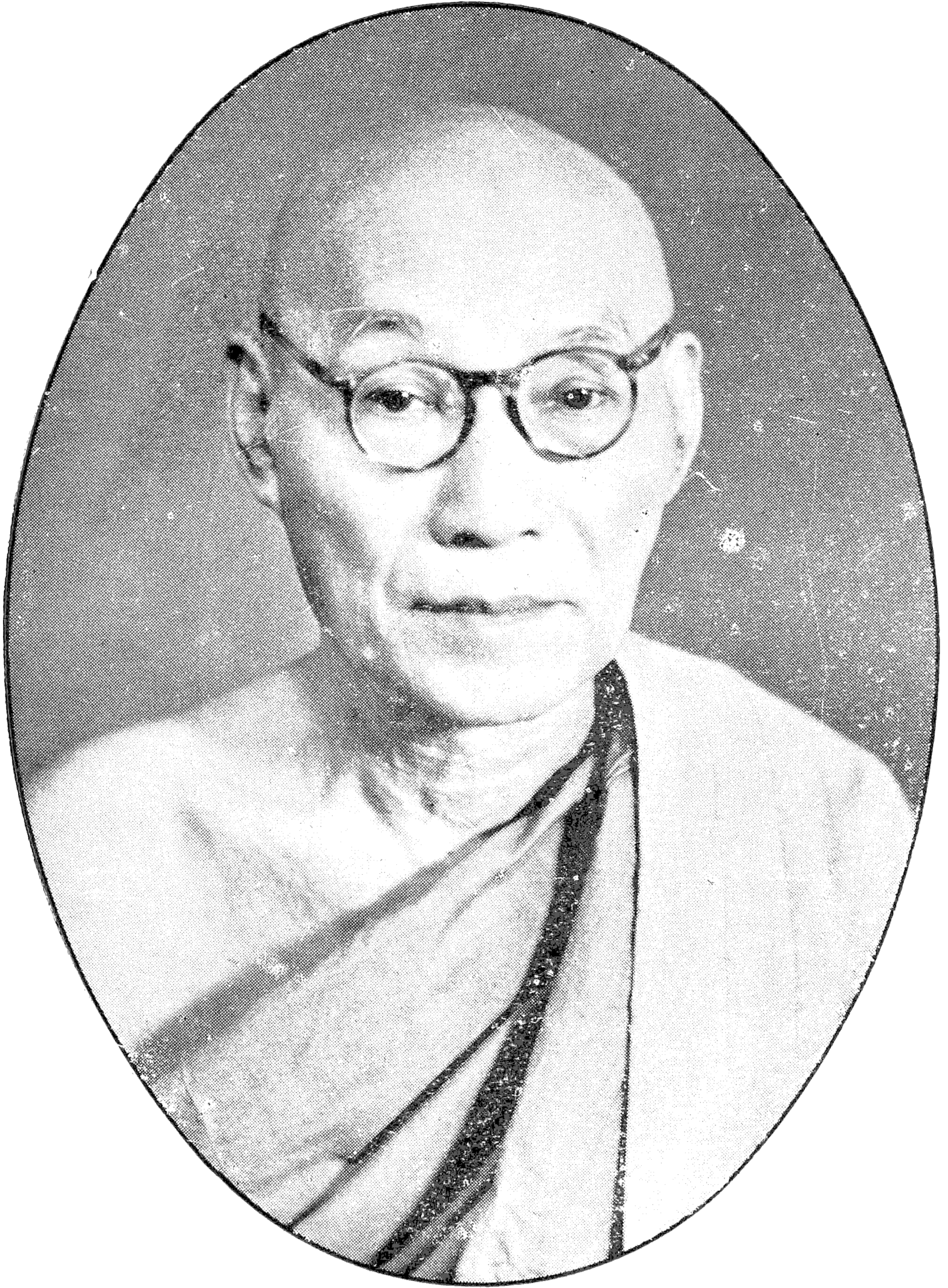
ကျမ်းပြု - အဖျောက် ဆရာတော် - ဘဒ္ဒန္တအာစာရ