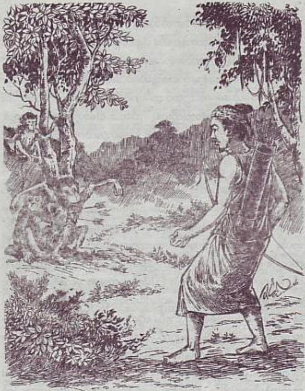
မိခင်မပျက်ဘဲမကြီးကို ပြုစုလုပ်ကွဲ၊ ခေတ္တတစ်ခဏသာ မဟာသန့်ယူ (တုရားအာဇာနည်၊) စုလသန့်ယူ (ညီမတော်အာသန့်အာဇာနည်၊) ခုဂ် မိခင်ဘိကြီးတို့ကို ခဒဝတိအာဇာနည်၊ မုဆိုးမှ မညှာမတာ ရက်စဝ်စွာ သတ်ဖြတ်ခေပုံ။