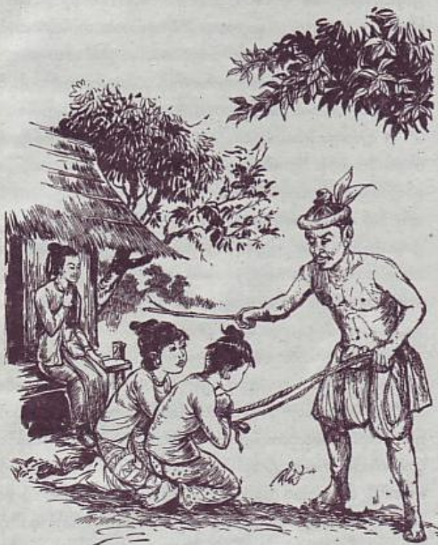
ဝေဝေသန္တရာမင်းကြီးတောဝတွင် သမီးနှင့် သားကို စုခကာပုလူများက လှုပ်နှိုးခတ်