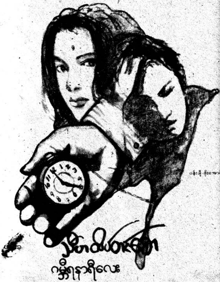
ဂမ္ဘီရဆန်းကြယ်စက္ကူပျား