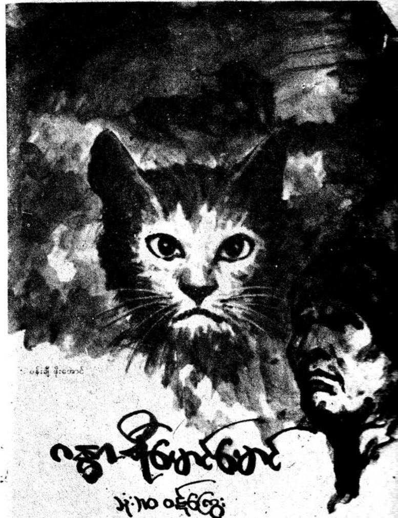
ဝန်းချီ မိုးဝဘာင်