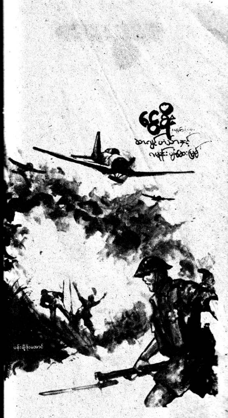
ပန်းချီဆွဲအောင်