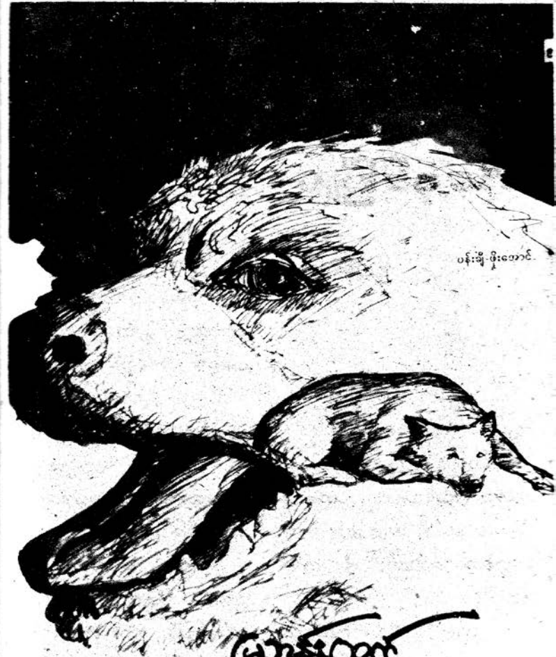
ပန်းချီ-စိုးလောင်