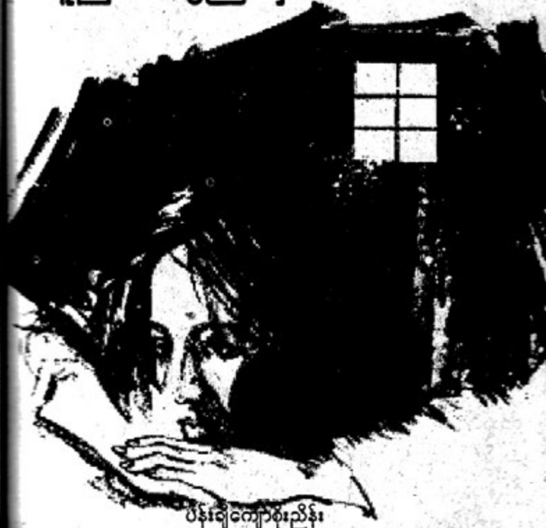
ပန်းချီကျော်စိုးညိုနိုး