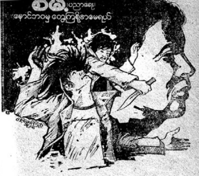
အောင်ဘဝမှ တွေ့ကြုံခဲ့ရမရယ်

အမေ အမေ ရေတိုက်ပါ အမေ။ ကျနော် သေရ တော့မှာပါ ..... ရေ ..... ရေ။