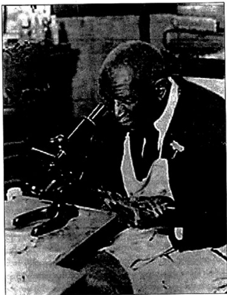
သိပ္ပံဓာတ်ခွဲခန်းထဲမှာ