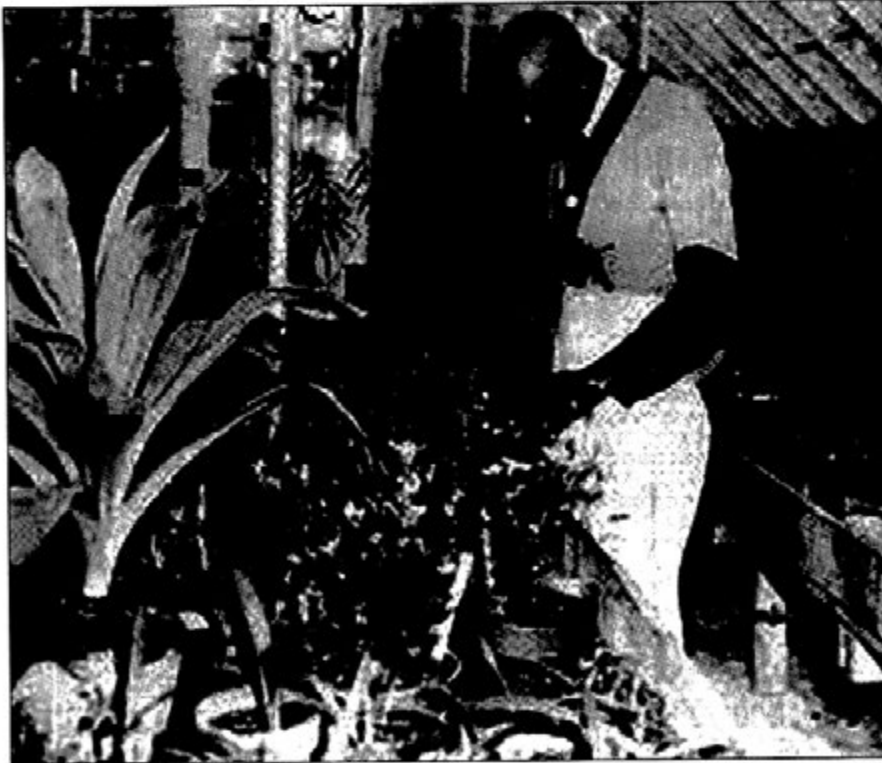
ဖန်လုံအိမ်ထဲမှာ သစ်ပင်မျိုးစုံနှင့် ဒေါက်တာကားဗား ရာပြည့်စာအုပ်တိုက်

သို့ရာတွင် သူတို့နှစ်ဦး တောင်ကုန်းတစ်ခု၏ ထိပ်သို့ ရောက်လာပြီး သူတို့၏ရှေ့မှာ အစိမ်းရောင် ကမ္ဘာလှည့် ခင်းဖြန့်ထားသကဲ့သို့ တည်နေသော မစ္စတာဂျေးဂါး၏ စပျစ်ခြံကို မြင်တွေ့လိုက်ရသည့်အခါ ကျေးငှက်တို့၏ ဂီတသံနှင့် ဆောင်းဦးရာသီ၏ တောတောင်အလှတို့ကို မေ့သွားတော့သည်။ စပျစ်ခြံသည် တောင်ကုန်းနံဘေးတစ်လျှောက်၌ တစ်တန်းပြီး တစ်တန်း၊ တစ်တန်းပြီး တစ်တန်းဖြင့် တောင်ကြားချိုင့်ဝှမ်းထဲသို့တိုင် ဆင်းသွား၏။ ခြံ၏ အောက်ခြေတွင် အဖြူရောင် အိမ်ကလေးတစ်လုံး တည်နေ၏။ အိမ်ရှေ့တွင် ပန်းဥယျာဉ်တစ်ခုလည်း ရှိနေသည်။ ဂျောသည် သူ့တစ်သက်တွင် ဤသို့သော ဥယျာဉ်မျိုးကို မမြင်ဖူးခဲ့သေးပါပေ။ ဥယျာဉ်ကို မှန်များဖြင့် ကာရံထားပြီး ထိပ်ပိုင်းတွင်လည်း မှန်ဖြင့်ပင် မိုးထားသည်။ မစ္စတာ