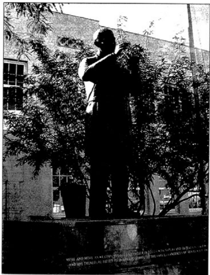
ရှော့ ဝါရှင်တန် ကားဗား၏ ကြေးရုပ်တု