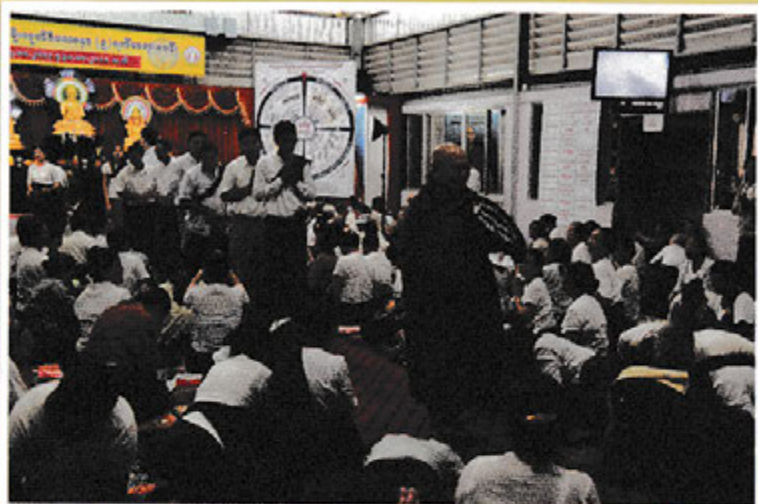
အောင်သမာဓိ မိုးကုတ် ဝိပဿနာ တရားစခန်း