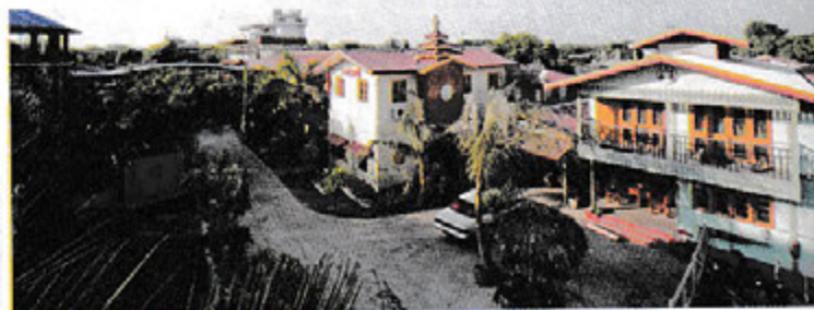
၁၄လမ်း အောင်သမာဓိအလုပ်ရုံ