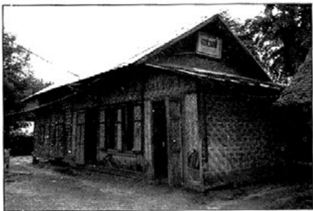
တပည့်များသို့ပေးခဲ့သော ကျောက်ကြိတ်စက်

အစ်မတော်ဝင်းထဲတွင် လှော်ဖိုလုပ်ငန်းကအဆင် ပြေသည်။ ကျည်တောက်ပေါက်၊ နွယ်ရုံ၊ ဇရပ်ကွင်းတို့မှ ကုန်သည်များ၊ မိတ်ဆွေများ အားပေးမှုဖြင့် လုပ်ငန်းအောင်မြင်လာခဲ့သည်။ အစ်ကိုက ကျည်တောက်ပေါက် ရွှေဆိုင်ကို မရပ်ဘဲ မမော်စီညီမ တစ်ယောက်ကို ချန်ထားခဲ့ပြီး ဆက်ဖြင့်ထားသည်။ အစ်ကိုအိမ်မှာ တယ်လီဖုန်းမရှိ၍ ဆက်သွယ်ရေးလွယ်ကူစေရန် အစ်ကိုက ၁၉