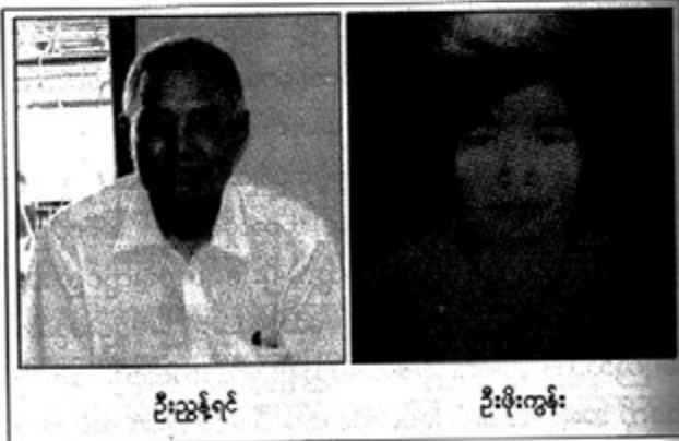
ဦးညွှန်ရင်

ဆရာဦးမန်းရီက စီစဉ်ပေးသည်။ အောင်အောင်နဲ့ တွဲလုပ်ပါလားတဲ့ပြောသည်။ 'ကွမ်းယာရောင်းတဲ့ အောင်အောင်လား'ဟု