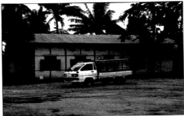
ဆွမ်းစားကျောင်း

ဗွက်တောမှာ မုန်စုပ်စက်မောင်းနေစဉ် ကျွန်တော် အိမ်ထောင် ကျသည်။ အစ်ကိုက ကျွန်တော့်ကို မိန်းမ လိုက်တောင်းပေး သည်။ ကျွန်တော် မိန်းမသွားတောင်းရတာက မိုးကုတ်ဖြစ်သည်။