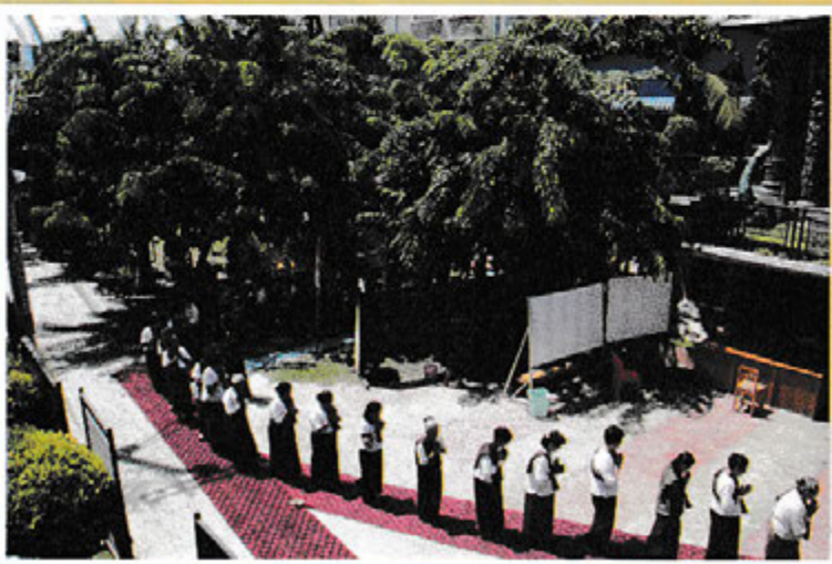
အောင်သမာဓိ မိုးကုတ် ဝိပဿနာ တရားစခန်း ရိပ်သာဝင်ကြသူများ