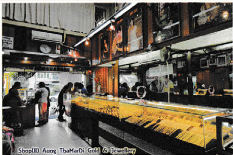
Shop(II) Aung ThaMarDi Gold & Jewellery

အောင်သမာဓိရွှေဆိုင် အမှတ်(၂)အား အတွင်းရိုင်းကောင်တာ တွေ့မြင်ရပုံ