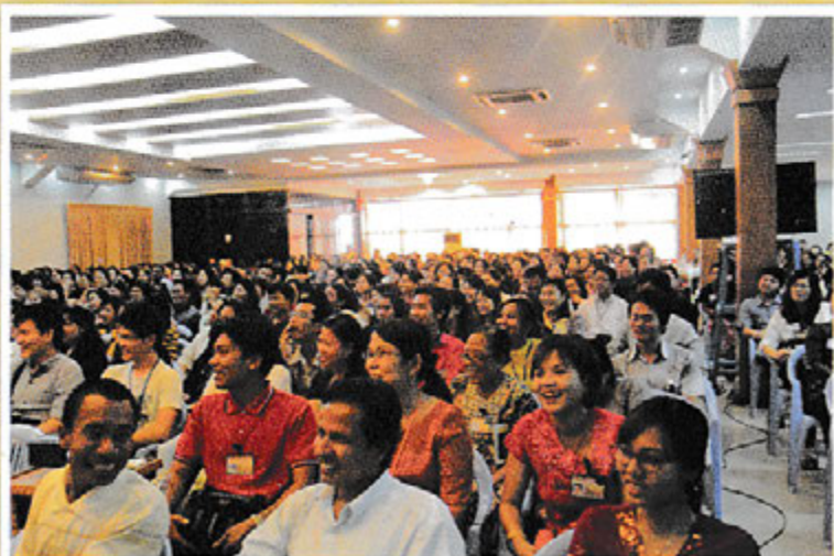
ရွှေပညာအခမဲ့သင်တန်းမှ သင်တန်းသူ/သားများ