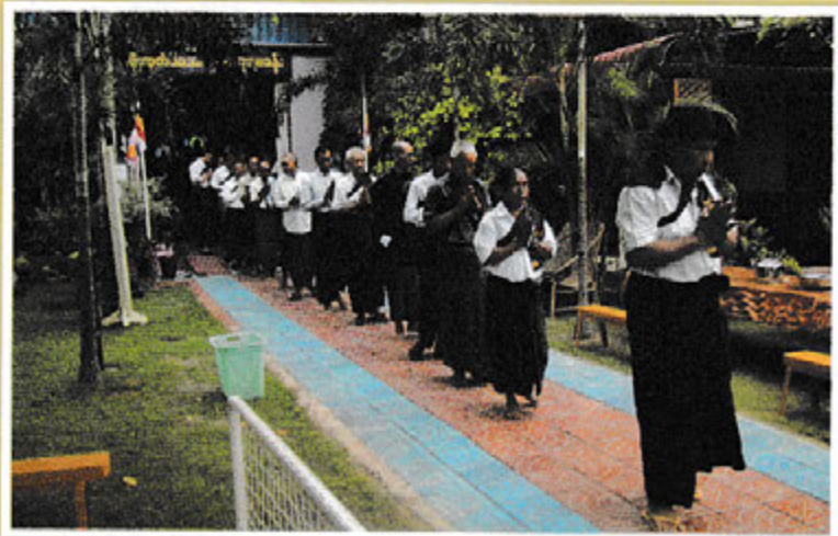
အောင်သမာဓိ မိုးကုတ် ဝိပဿနာ တရားစခန်း ရိပ်သာဝင်ကြသူများ