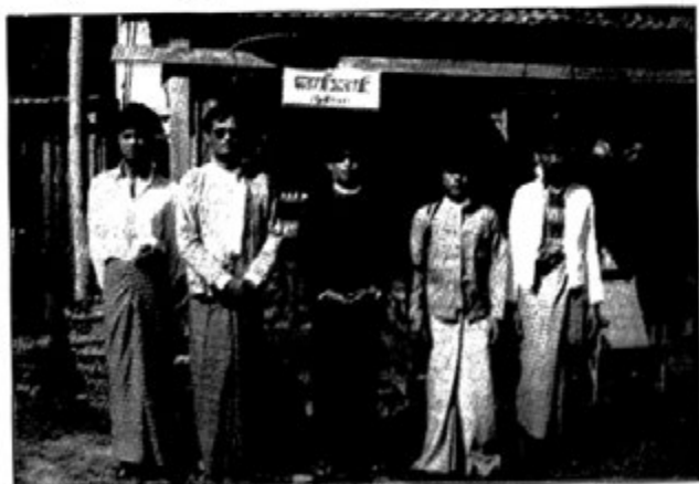
ရွှေရင်ကျော်ဝိုင်းဆရာများနှင့်

ကွမ်းယာသည်အောင်အောင်မှ ဆရာအောင် ဖြစ်လာခဲ့သည်။