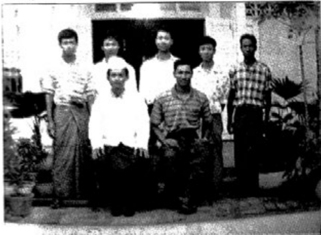
ညီအစ်ကို ၆ ယောက်

အစ်ကိုသည် ငယ်စဉ်အခါကပင် အများနှင့် မတူသောအတွေး အခေါ်များရှိခဲ့သည်။ ငယ်စဉ်ကပင် ကိုယ်ပိုင်အတွေး အခေါ်အယူ အဆများ ရှိခဲ့သည်။ ညီအစ်ကိုအရင်းများ မှာပင် အစ်ကိုစရိုက် တစ်မျိုးတစ်ဘာသာ ထူးခြားခဲ့သည်။ ပျော်ပျော်ရွှင်ရွှင် နေတတ်