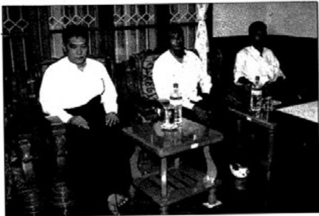
ရွှေပညာသင်ကြားပေးသူ ၃ ဦး အောင်သမာဓိ

ရွှေသင်တန်းများတွင် အစ်ကိုက ရွှေအကြောင်းတစ်ခွန်း တစ် ပါဒမှ မပြောပါ။ သူဖြတ်သန်းခဲ့ရသော သူ့ဘဝအကြောင်း နှင့် ဘဝနေနည်းများ၊ ဘာသာရေး အသိတရားများကိုသာ အမြဲပြော သည်။ မိဘနှစ်ပါးကို ပြုစုလုပ်ကျွေး၍ မိက်ဖက် ကောင်းအောင် လုပ်သည့်နည်းများကို ဆွေးနွေးသည်။ မိဘနှစ်ပါးအား တန်ဖိုး ထား ရိုသေလေးစားတတ်စေရန်၊ တိုက်တွန်းတတ်သည်။ အစ်ကို က သူဖတ်သောစာအုပ်များအကြောင်းကိုလည်း ပြောပြသည်။ မိမိတို့ဘဝတိုးတက်ကြရန်အတွက် စာအုပ်စာပေများကို ဖတ်ကြ