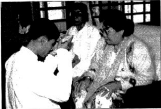
မိဘနှစ်ပါးနှင့်

ကျွန်တော်တို့ မိသားစုသည် တစ်နှစ်ပတ်လုံး အားလပ်နေ သည့်အခါမျိုး မရှိပါ။ ရာသီအလိုက်အမြဲလိုလို လုပ်ငန်းလုပ်ကိုင်