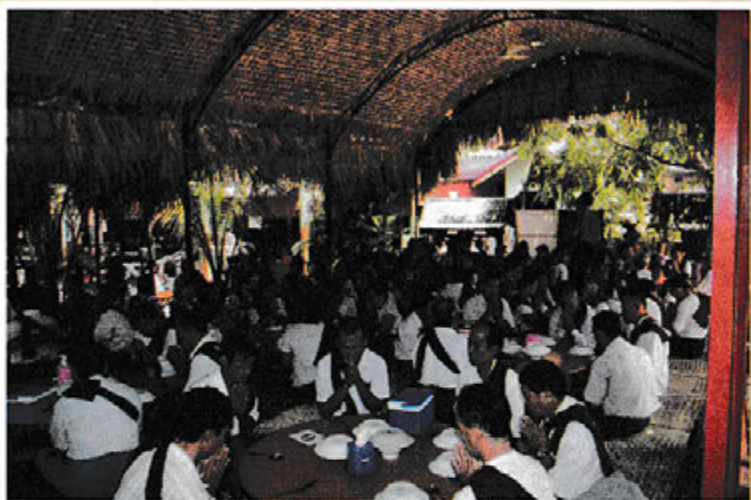
အောင်သမာဓိ မိုးကုတ် ဝိပဿနာ တရားစခန်း ရိပ်သာဝင်ကြသူများ