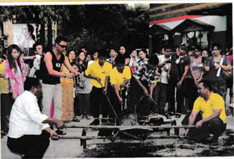
ရွှေပညာအခမဲ့သင်တန်းမှ သင်တန်းသူ/သားများ လက်တွေ့လေ့လာနေစဉ်