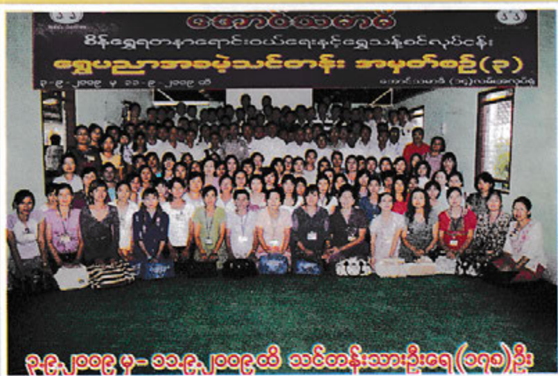
၃-၉-၂၀၀၉ မှ ၁၁-၉-၂၀၀၉ ထိ သင်တန်းသားဦးရေ (၁၇၀) ဦး

ရွှေပညာအစမဲ့သင်တန်း မှ အမှတ်စဉ်(၃) သင်တန်းသူ/သားများ