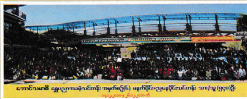
၃-၉-၂၀၀၉ မှ ၁၁-၉-၂၀၀၉ ထိ

ရွှေပညာအစမဲ့သင်တန်း မှ အမှတ်စဉ်(၃) သင်တန်းသူ/သားများ