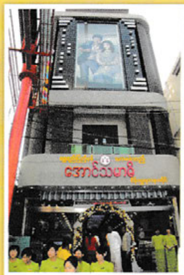
အောင်သမာဓိ ရွှေဆိုင်အမှတ်(၄)အား အတွင်းပိုင်းနှင့် မျက်နှာစာ တွေ့မြင်ရပုံ