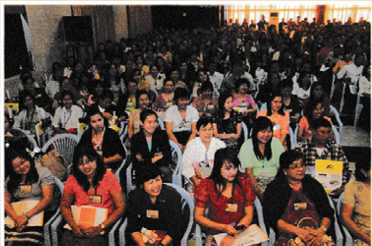
ရွှေပညာအခမဲ့သင်တန်းမှ သင်တန်းသူ/သားများ