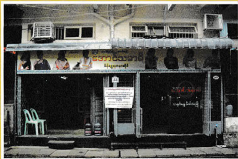
အောင်သမာဓိရွှေဆိုင် အမှတ်(၃) အား မျက်နှာစာမှ တွေ့မြင်ရပုံ