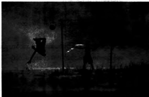
မြန်မာ့ပန်းချီကား မိုးဦးအလှ