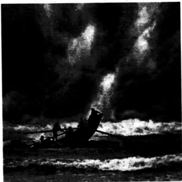
တို့လူသားနှင့် တို့စွမ်းအား