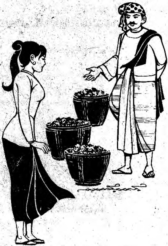
ကုဋေလေးဆယ်ကျော်တန်သောလက်