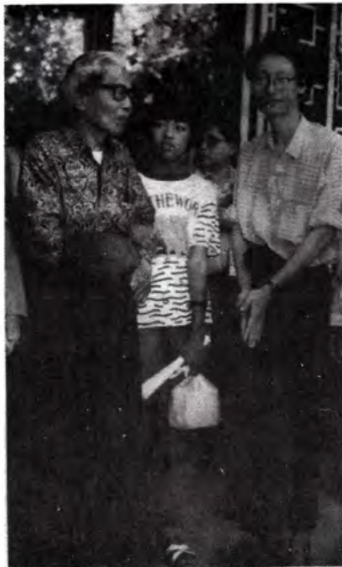
ထူးအိမ်သင်၏ ဂါရု အပြည့်နှင့် နိမ့်ချရိုက်နှိုင်းပုံ