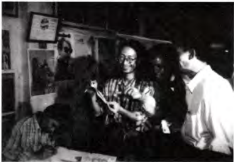
နှင်းဆီလှိုင်းကာလ