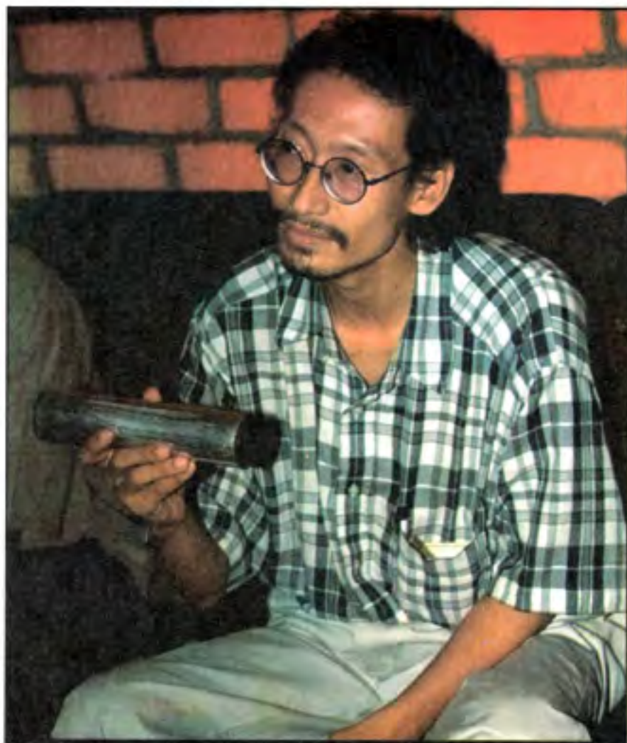
ဝိတ တွဲရိယာနှင့် မေပိဒါရွာ ပျံသန်းသော ဂုဏ်