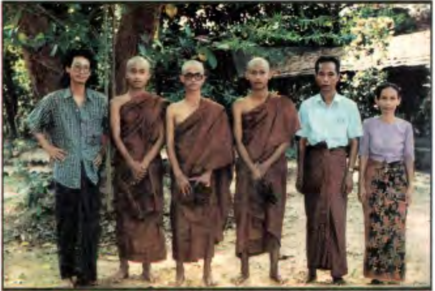
ဟားအောက်တွင်အမှတ်တရ