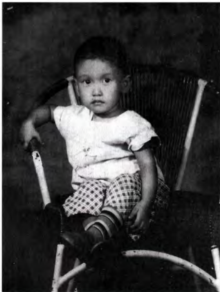
၂ နှစ်သား တိဥ