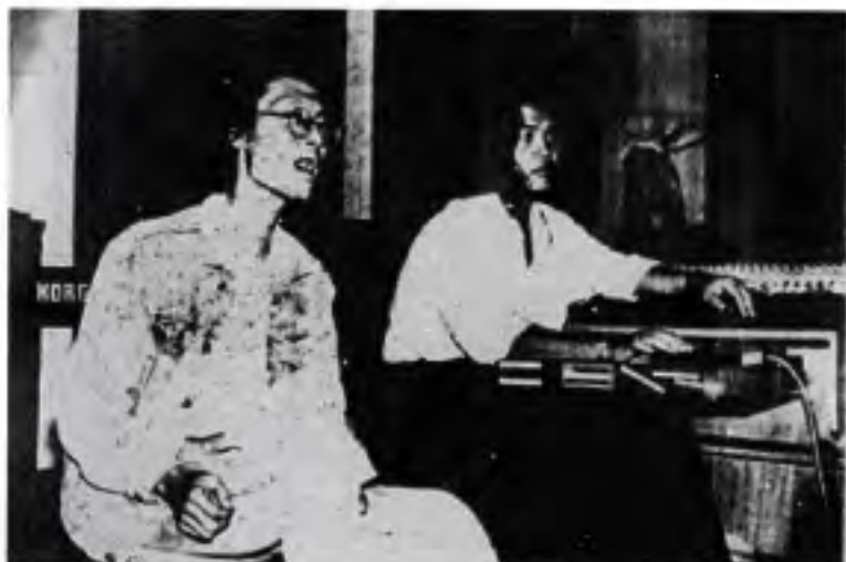
စတူဒီယိုတွင်း မြို့ပြ လရောင်တမ်းချင်းနှင့်