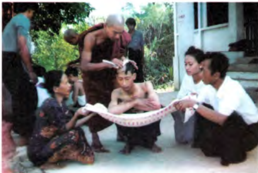
မော်လမြိုင်မြို့ တောင်ပေါ် ဦးစိန် ဓဇယျမေဒိနီကျောင်းတွင် ပဋ္ဌင်းတက်ခဲ့ပုံ။