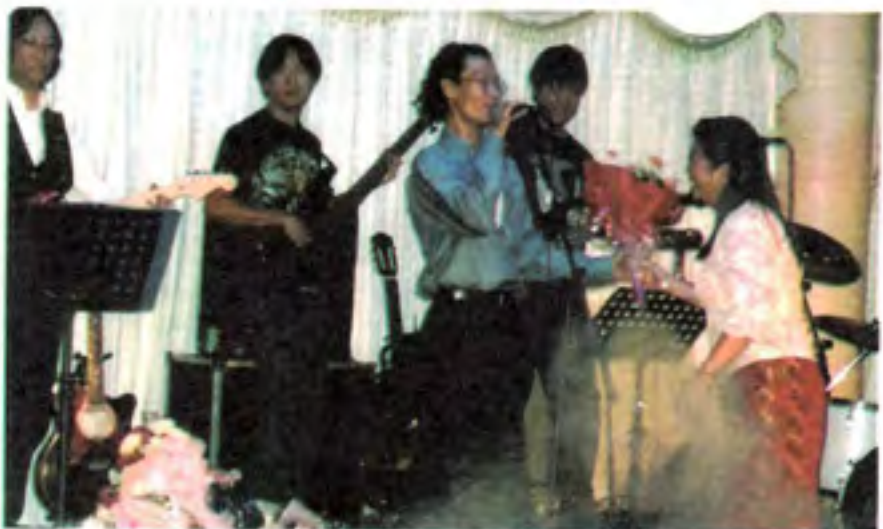
အသံအားဖြင့် စတင်ခြင်း