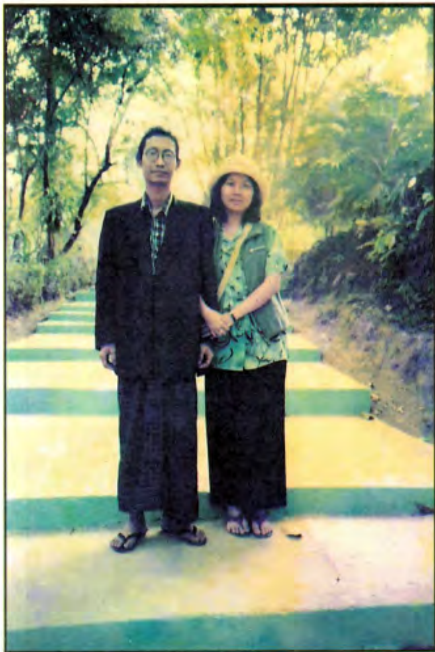
မိသွယ်နှင့် ကိုလေး