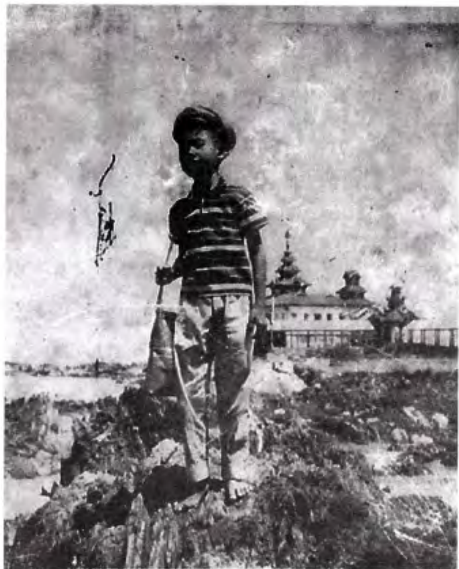
ကျိုက္ကမီဘုရား