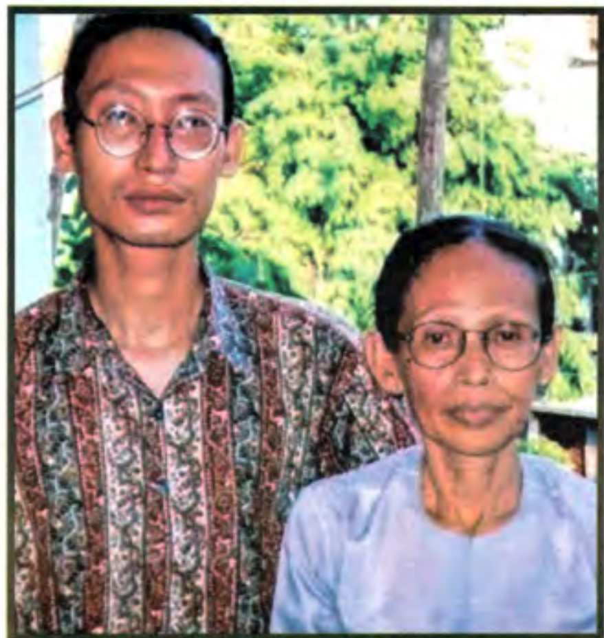
အဖေ ဇော်မြင့်ရှိ ဘွဲ့