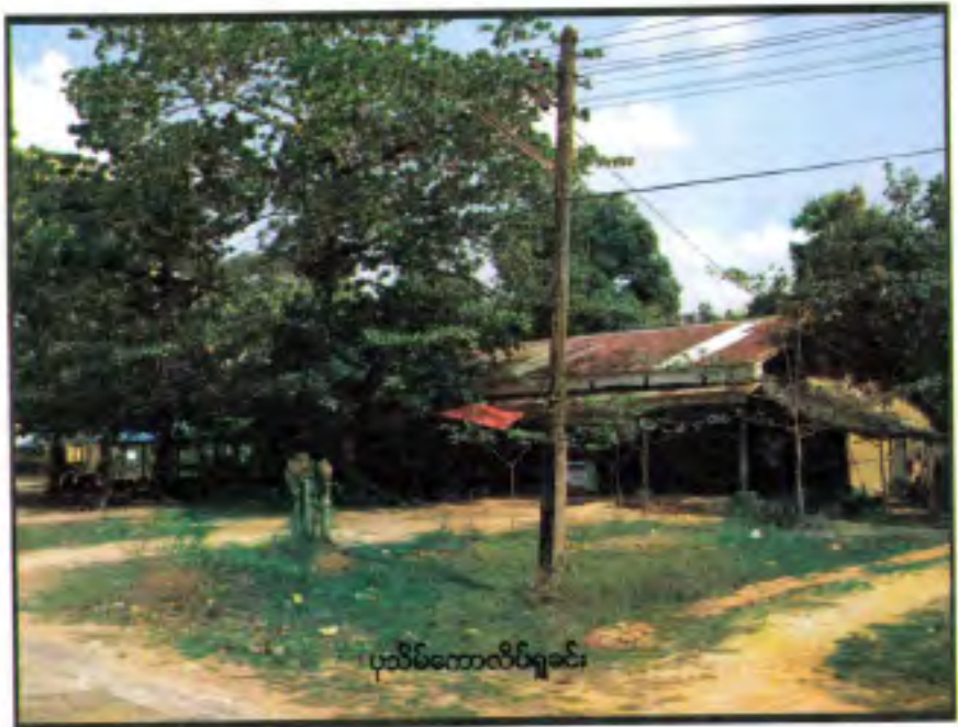
ပုသိမ်တောင်လိပ်ရွာခင်း