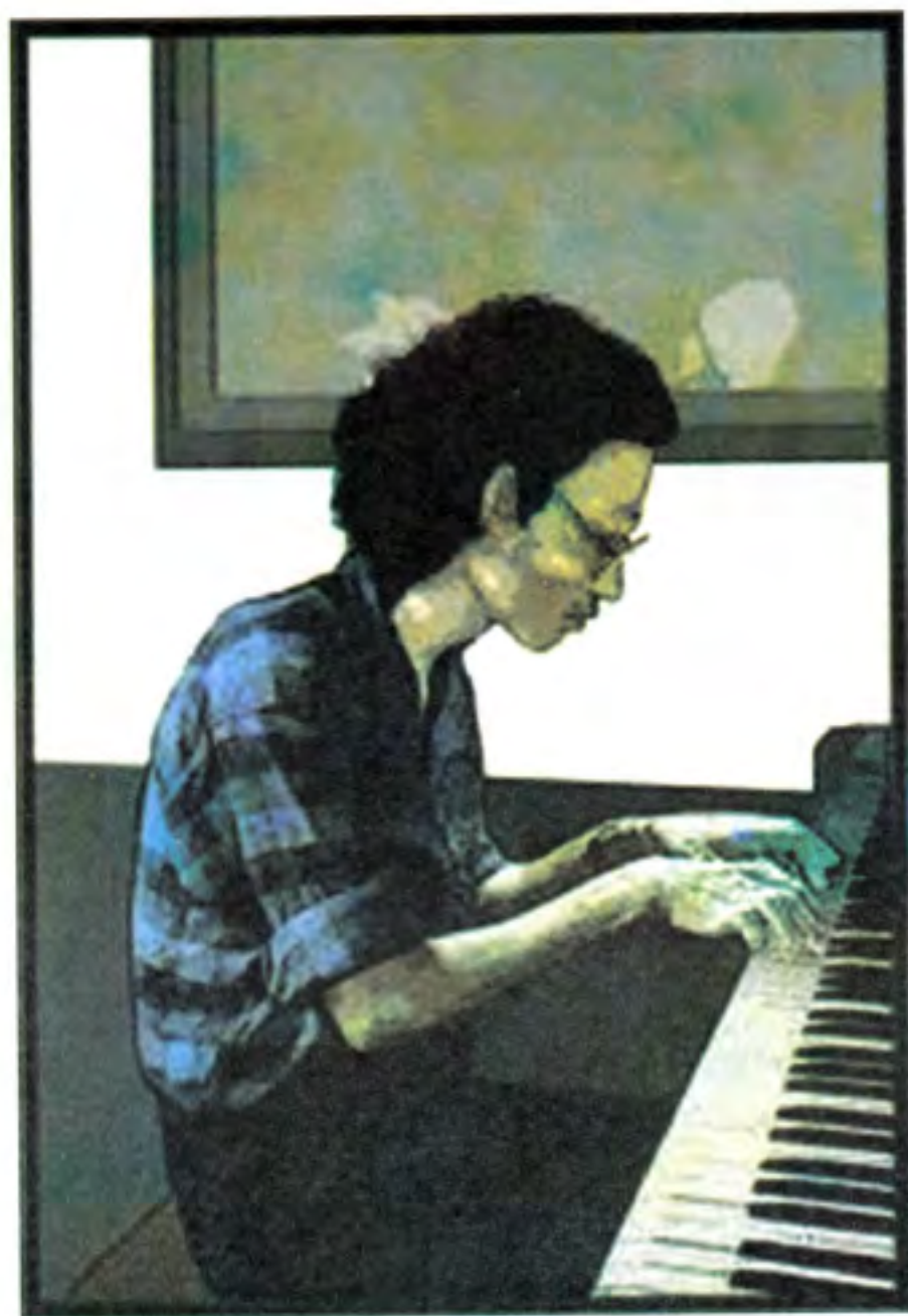
ဝဇ္ဇရာ၊ ရှေ့ သျှင်ကလေး