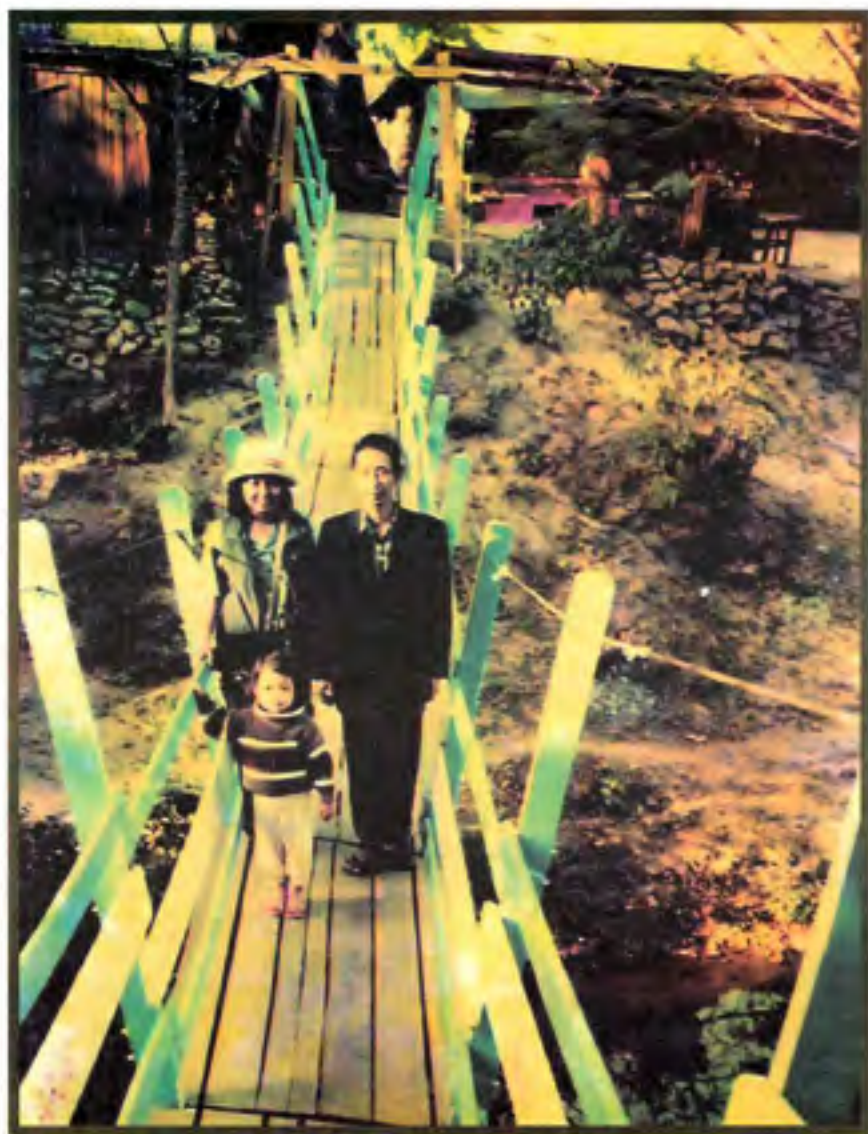
Walking across the bridge