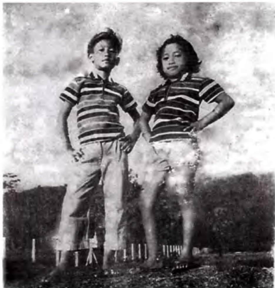
ကျွန်ုပ်တို့၏ ငါးနှစ်အရွယ်က ရှိခဲ့သော အဖေ့ ဓာတ်ပုံ