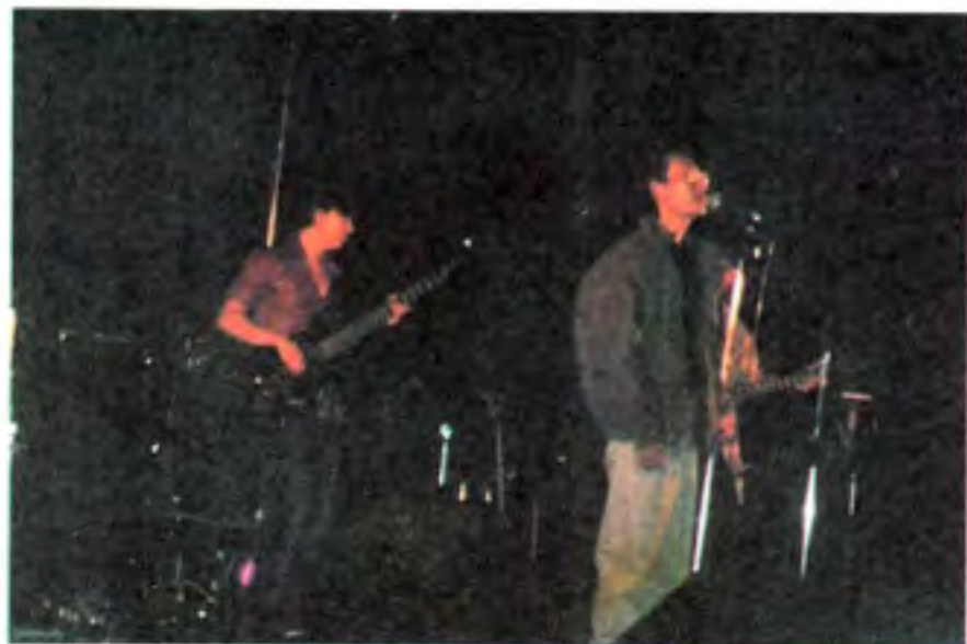
ပြောင်းလဲနေသော အခါမှ စတင်ခြင်း