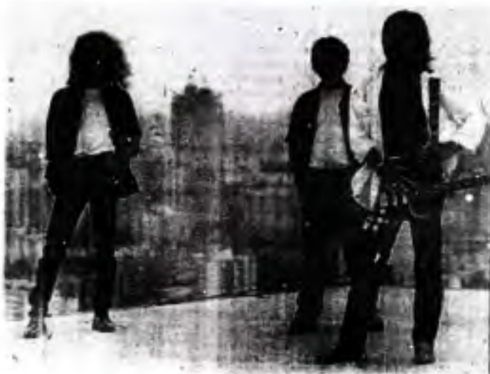
ထိုင်းနိုင်ငံ ဘန်ကောက်တွင် Big Five အတွက်