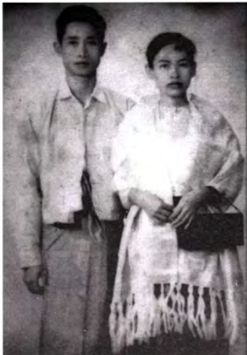
မော်လမြိုင်သားနှင့် စာသပြင်သူတို့၊ ဗုဒ္ဓစာ