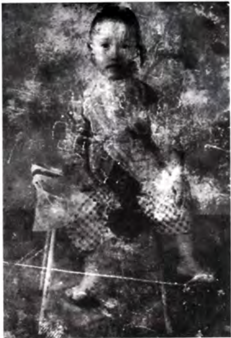
သုံးနှစ်ပြည့်၊ ပုသိမ် နဲ့ယုံ ခေါက်ပုံတိုက်