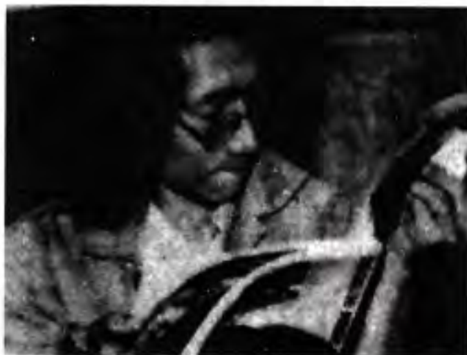
စာတွေ့လျှင် မျက်စိနှင့် မခွာ