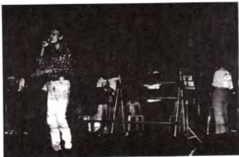
ဗြူးမ မိန်ရတု 'ကရိကံသံမြူးစစ်'