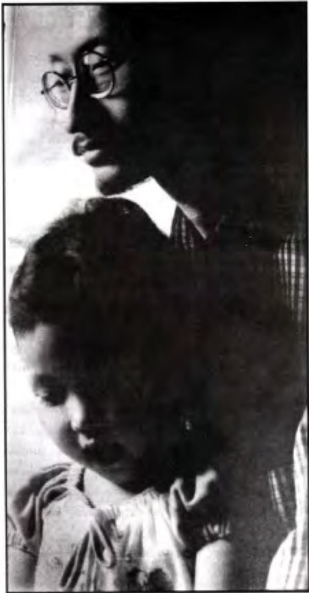
သမီးလေး မိကွန်ထော့ရဲ့ ဓမ္မဗေဒ