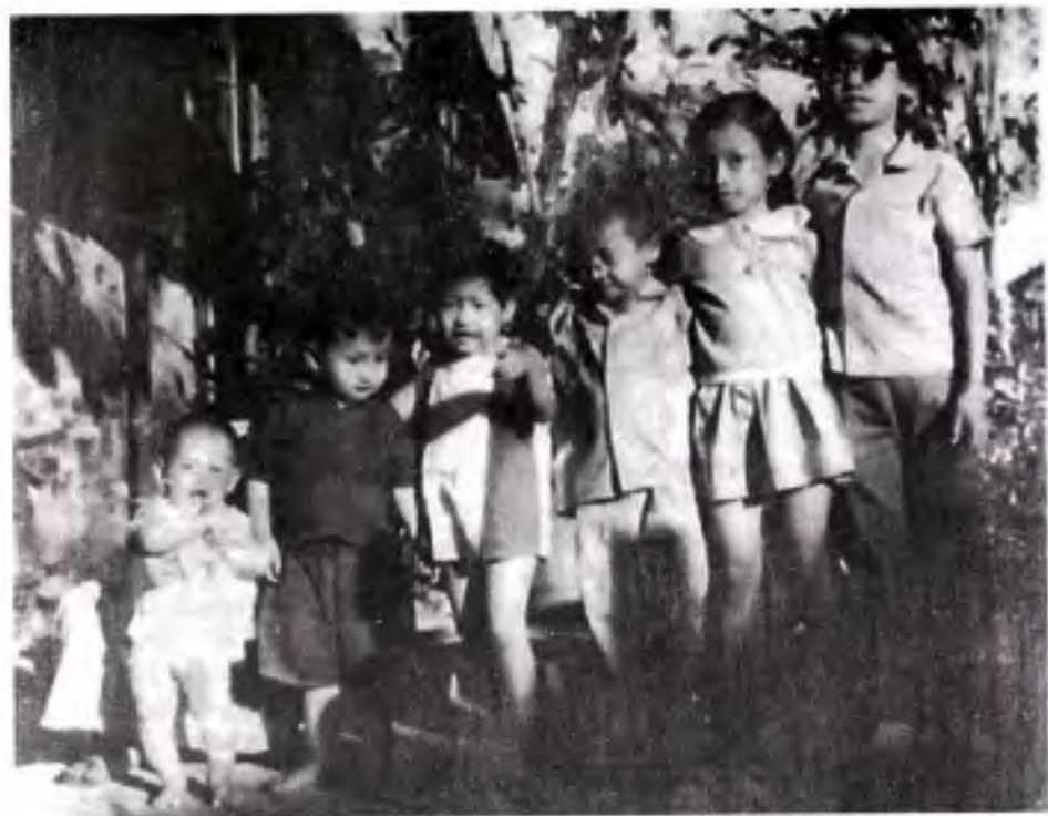
ညီအစ်ကို မောင်နှမတွေ ဝိုက်လေးများ တန်းစီထားသည့်ပမာ