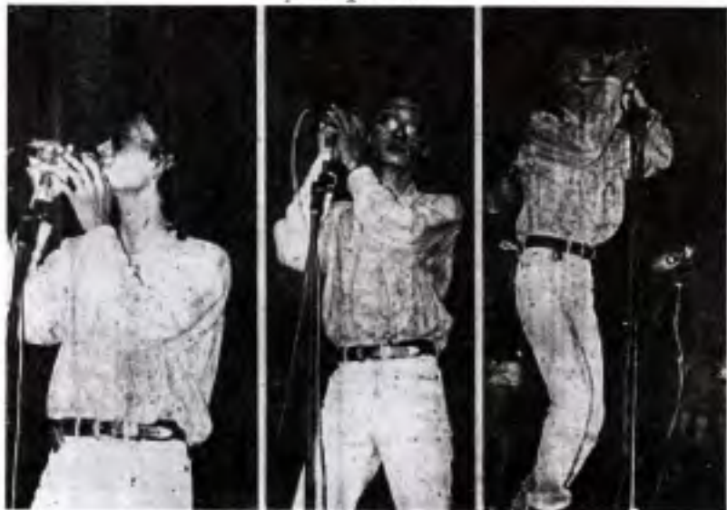
Unplugged ချောင်ဖြေပွဲ မြင်ကွင်း