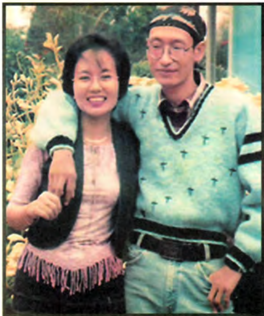
အစ်ကို: သွေးသံရဲ့ ခုခံ