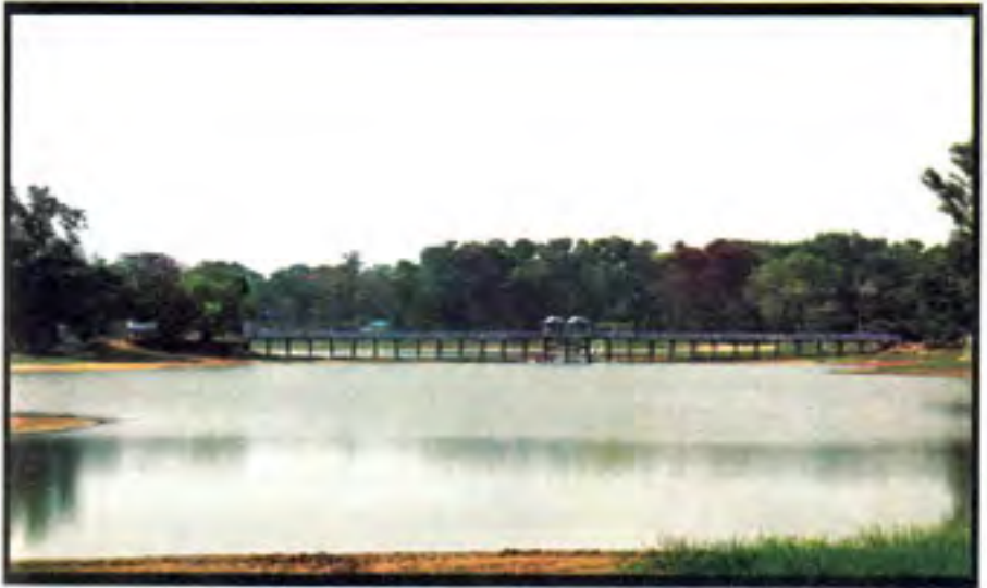
ပုသိမ်ကန်တော်ကြီး