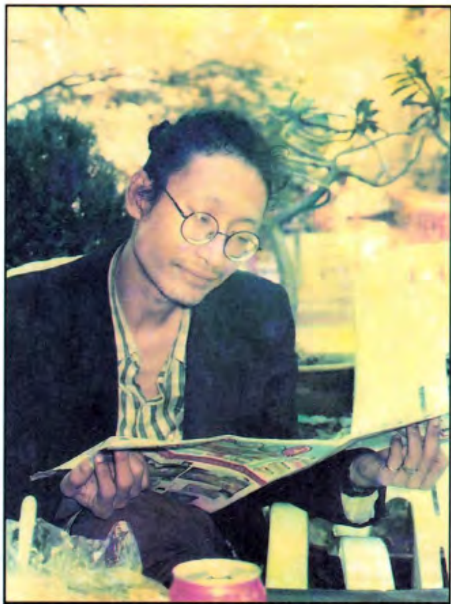
စာချစ်သူ ထူးအိမ်သင်