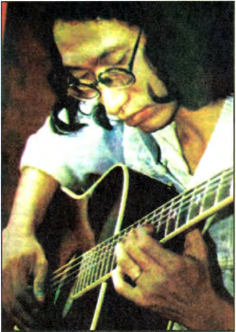
ဂစ်တာ တီးနေစဉ်အခါကျွန်တော်ဟာ ကျွန်တော် မဟုတ်ပါ။ ကျွန်တော်သည် ထိုဂစ်တာ။(ထူးအိမ်သင်)