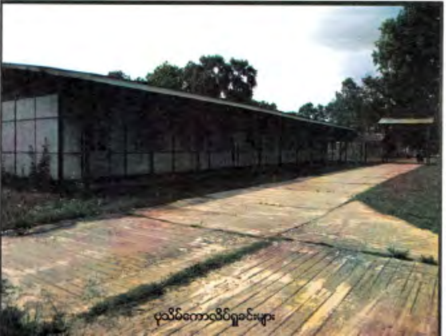
ပုသိမ်ကောလိပ်ရှခင်းများ