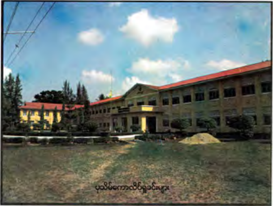
ပုသိမ်ကောလိပ်ရှခင်းများ