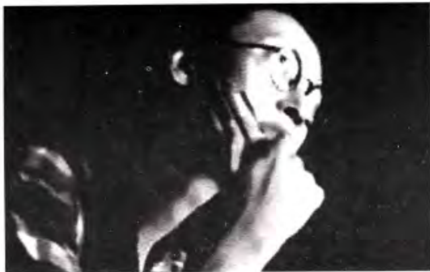
ဟာမိုနီကာကို မြတ်နိုးသူ