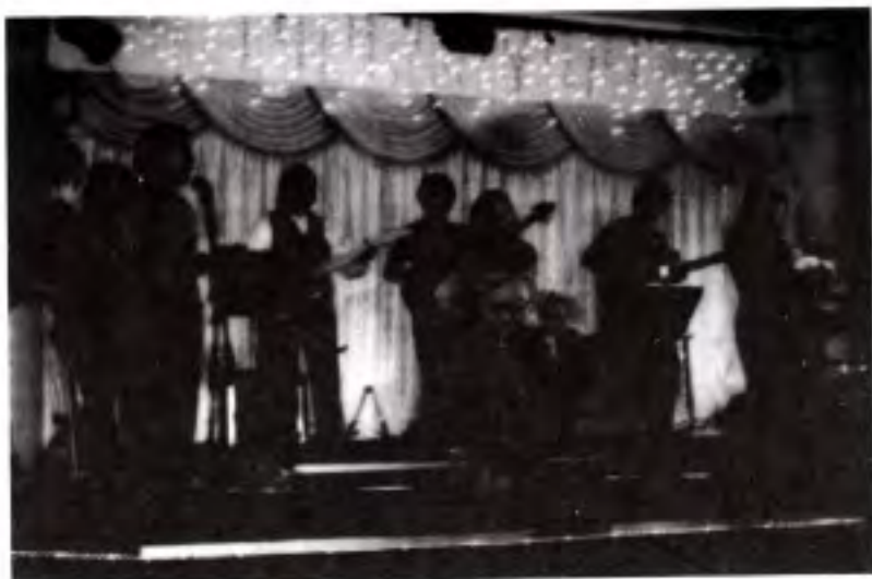
မယ်လာတုန်းမှာ တပျော်တပါး