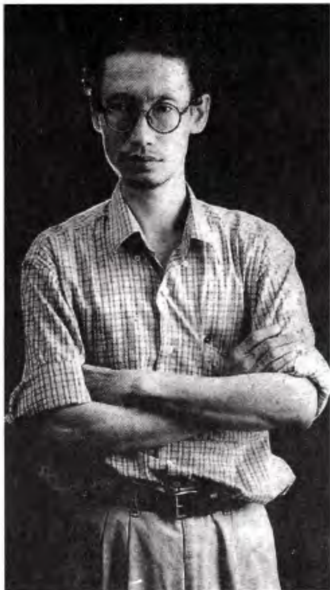
မှက်၏ တည်ကြည်သော ဟိတ်ဟန် ( စာတပ် ဝတ္ထုစွဲနိုး)