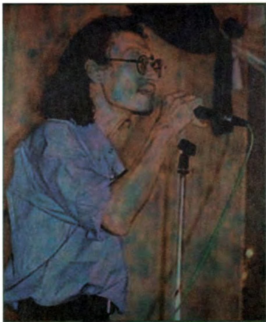
မိုက်ခွက်နှင့် ထူးအိမ်သင်