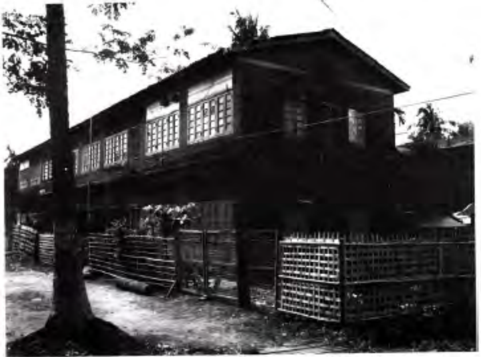
ပုသိမ်ပြည်တော်သာတိုက်ခန်း၊