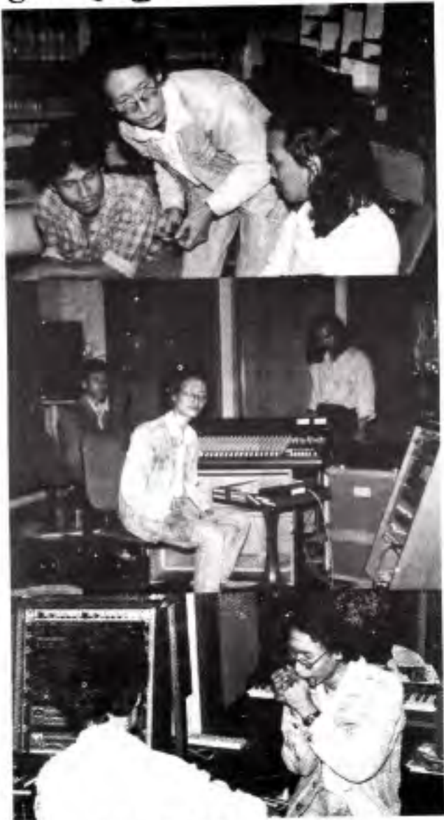
စတူဒီယိုထဲတွင် တိုင်တိုင်ပင်ပင် ထဲထဲဝင်ဝင်