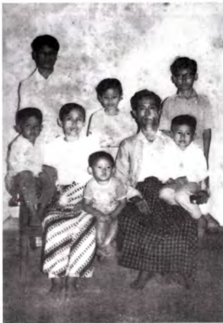
မိဘားစု သိုက်သိုက်ဝန်းဝန်း။