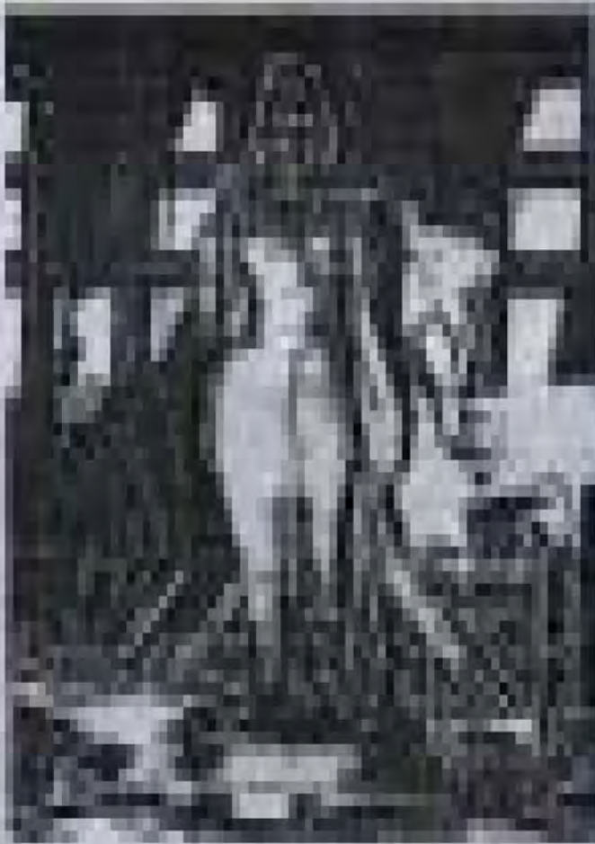
ပန်းပုရုပ် ထုလုပ်ခြင်းဆိုင်ရာ စာတမ်း၊ ဘွဲ့ယူစာတမ်း