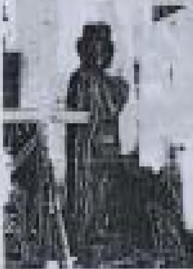
ပန်းပုရုပ် ထုလုပ်ခြင်းဆိုင်ရာ စာတမ်း၊ ဘွဲ့ယူစာတမ်း