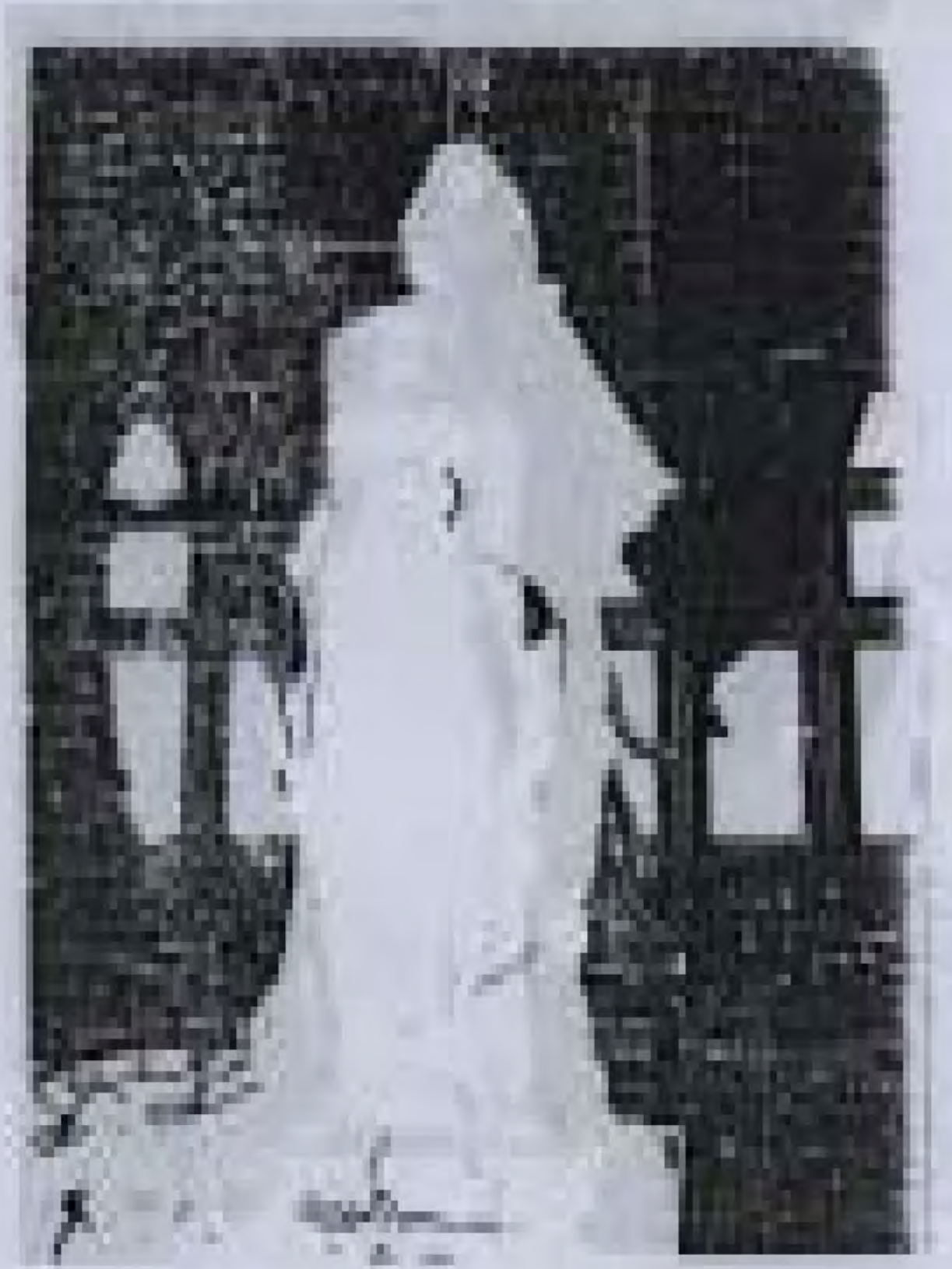
ပန်းပုရုပ် ထုလုပ်ခြင်းဆိုင်ရာ စာတမ်း ဘွဲ့ယူစာတမ်း