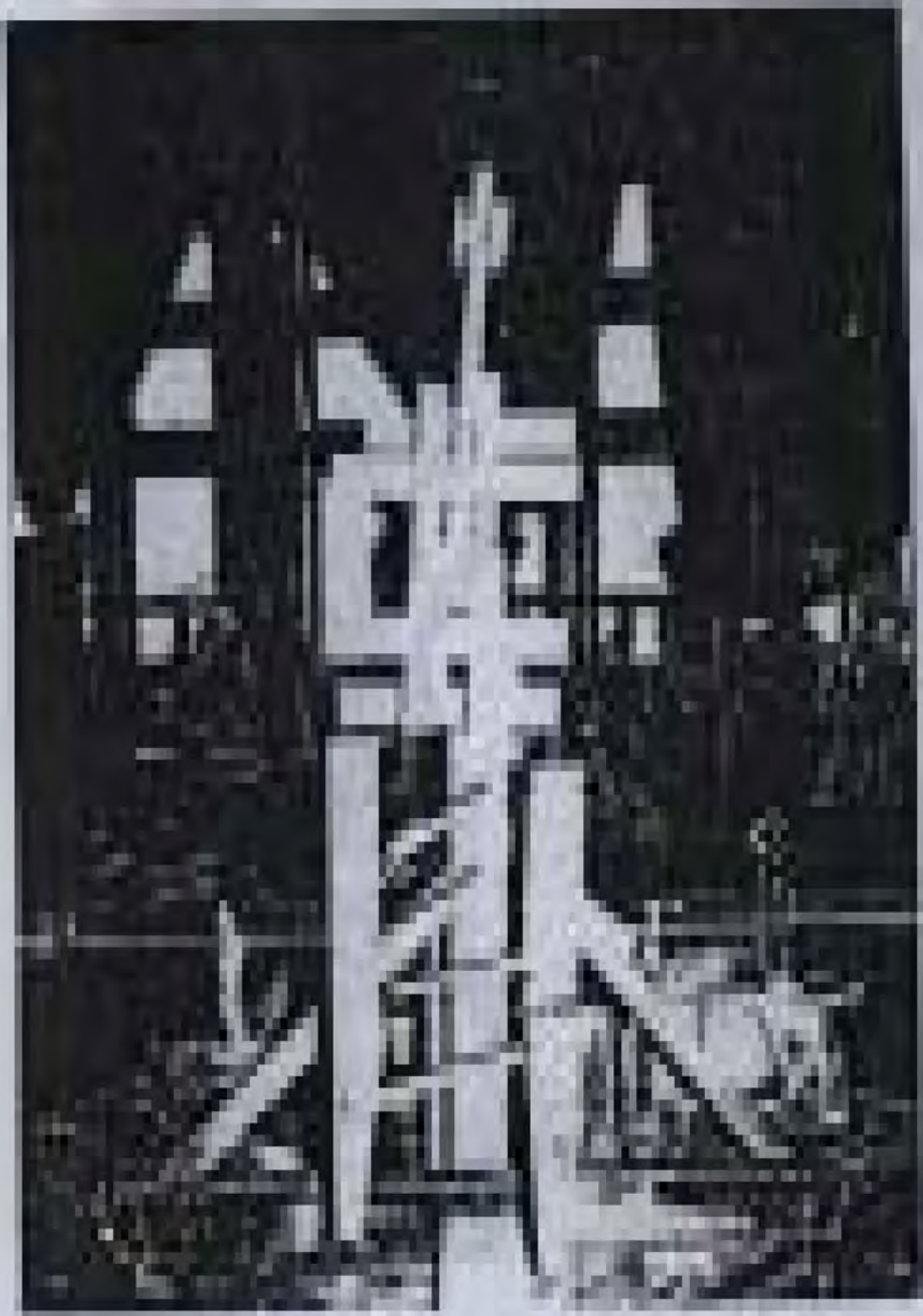
ပန်းပုရုပ် ထုလုပ်ခြင်းဆိုင်ရာ စာတမ်း ဘွဲ့ယူစာတမ်း