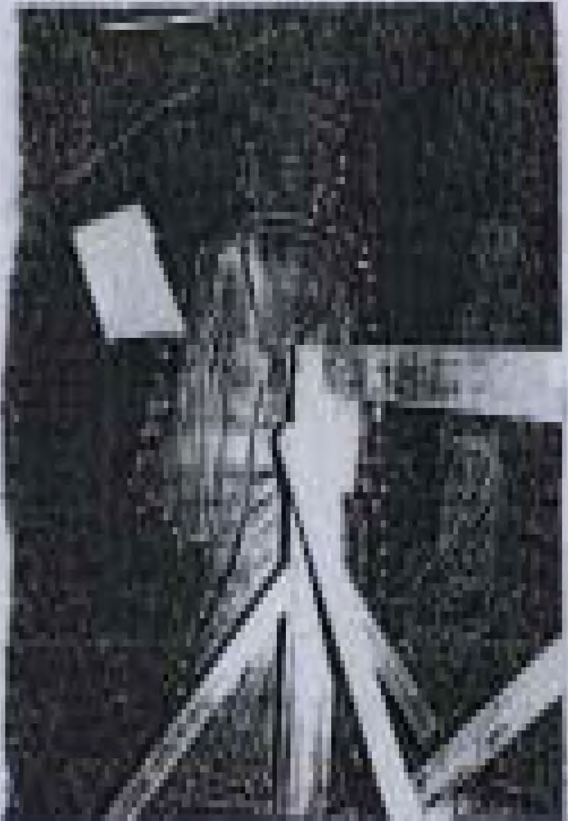
ပန်းပုရုပ် ထုလုပ်ခြင်းဆိုင်ရာ စာတမ်း ဘွဲ့ယူစာတမ်း