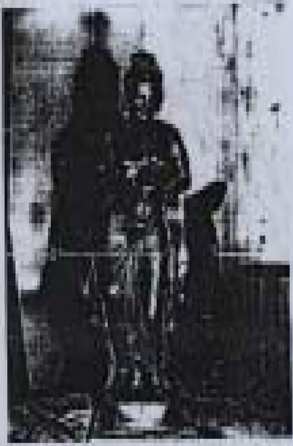
ပန်းပုရုပ် ထုလုပ်ခြင်းဆိုင်ရာ စာတမ်း ဘွဲ့ယူစာတမ်း