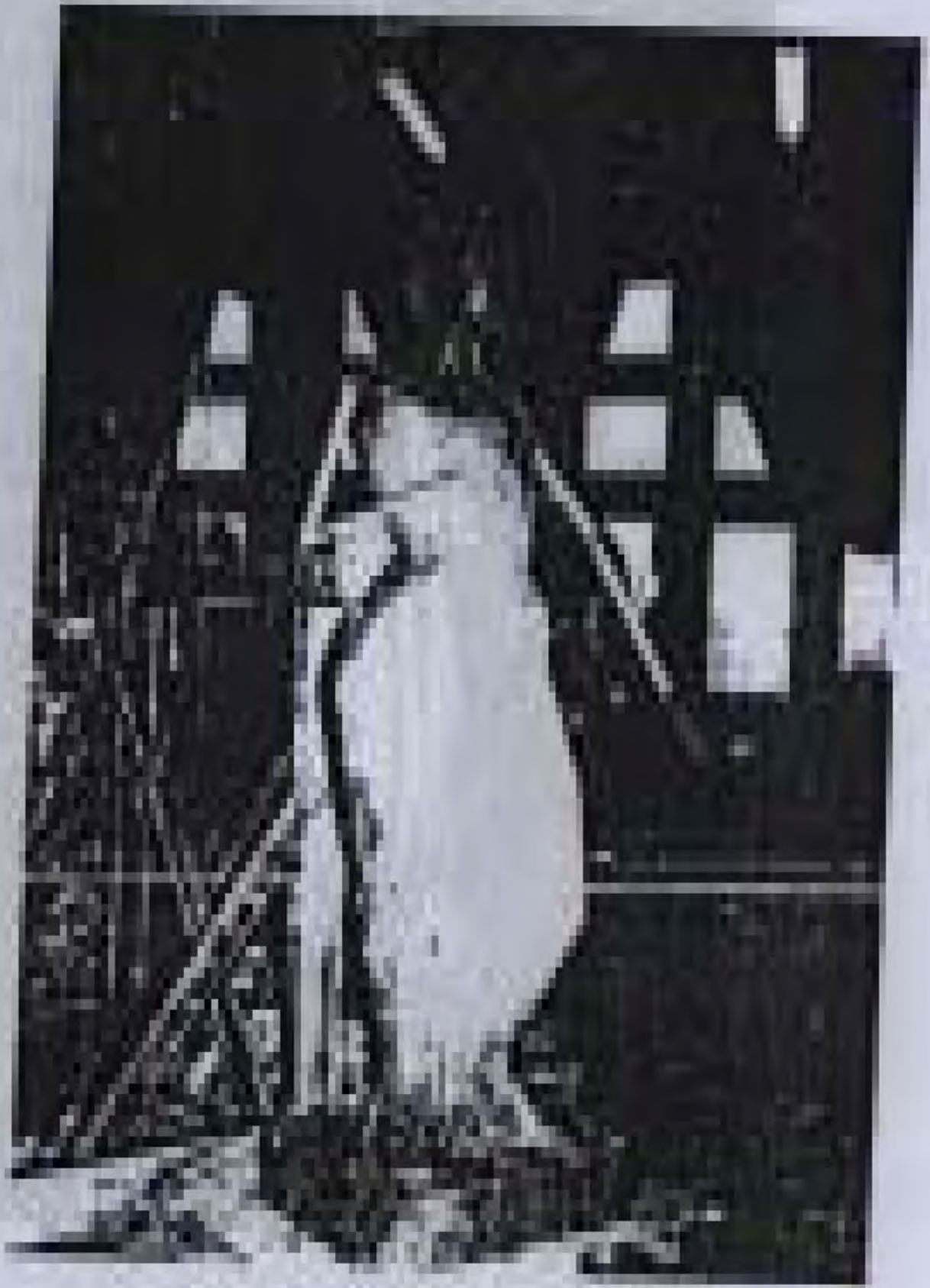
ဝေသာလီခေတ် အမျိုးသမီးဆင်ယင်ထုံးစံပွဲမှ ပန်းပုရုပ် ထုလုပ်ခြင်းဆိုင်ရာ ဓာတုဓာတ် ဘွဲ့ယူဓာတ်