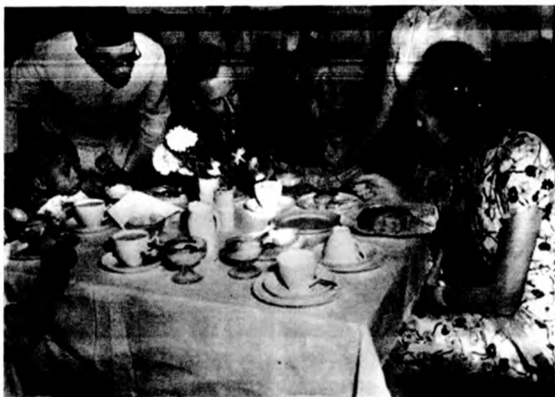
အစ်မနှင့်ကိုကိုလင်းအား မောင့်ဘက်တန်တို့ ဇနီးမောင်နှံနှင့် အတူတွေ့ရစဉ်