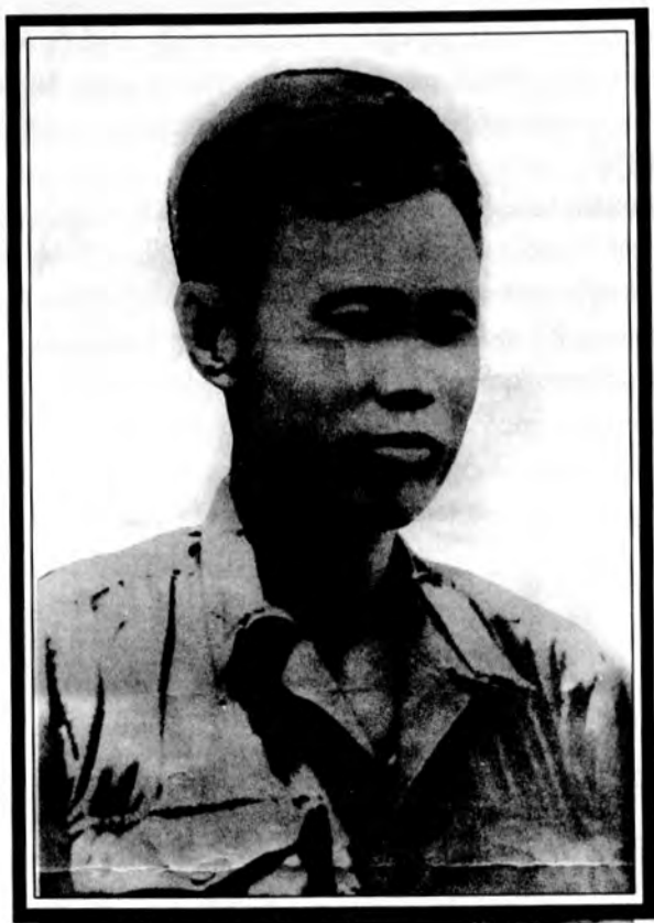
မိုလ်ချို ဝိစာအင်ဆန်း