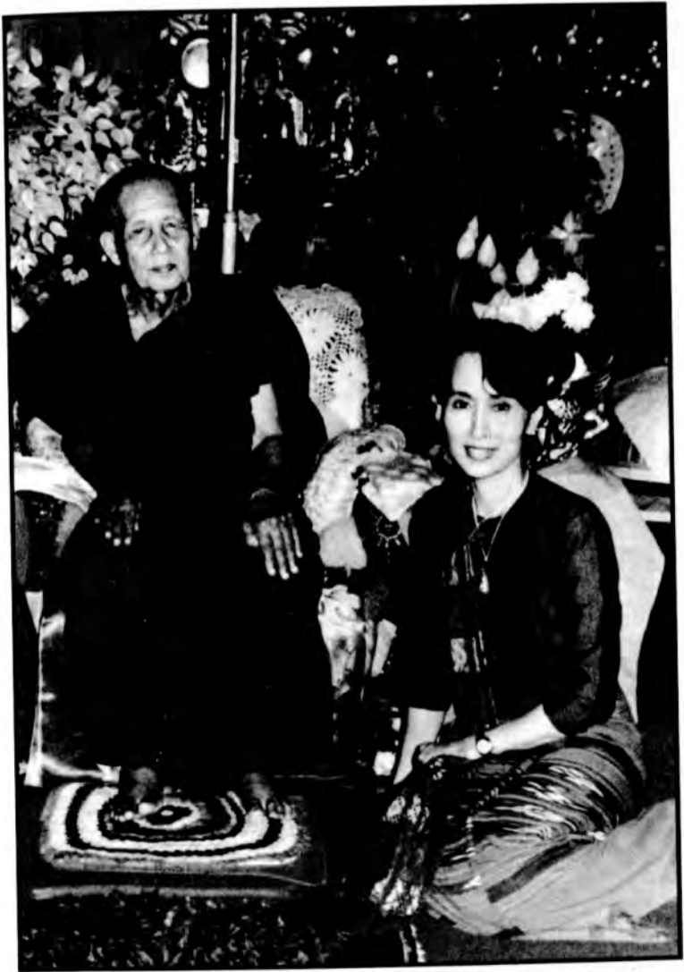
ဘုရားသားတော် သာမညဆရာတော်ကြီးနှင့် ဒေါ်အောင်ဆန်းစုကြည် (၁၉၉၅၊ နိုဝင်ဘာလ)