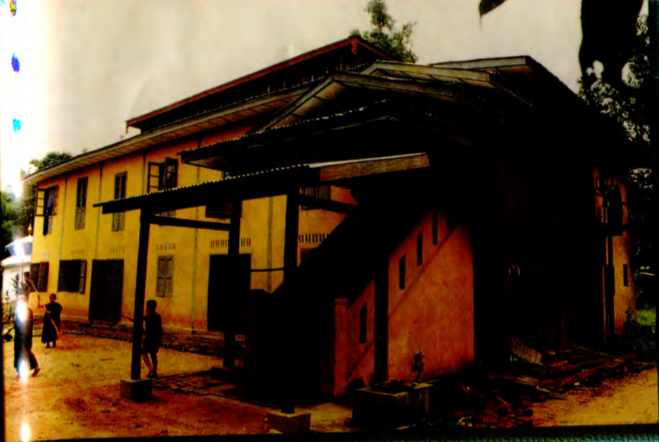
နောကုန်းကျေးရွာ ကျောင်းလေးဘုန်းကြီးကျောင်းပို့