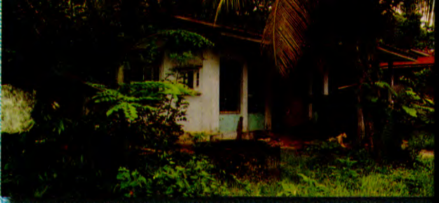
သဲအင်းဂူဆရာတော်၏ပြုပြန်လေးအဆွဲခံခဲ့ရသည့် သဲအင်းဂူဆရာတော်ဘုရားကြံ ဒုတိယစံကျောင်းတော်ပုံ။ (ငေါ်မြသိန်း၊ ကျွန်းတောလမ်း၊ စမ်းချောင်း ကောင်းမူ)