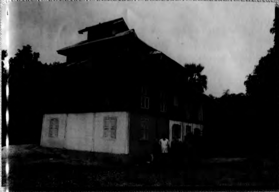
နောက်ကျောရွာ၊ ကျောင်းကြီး ဘုန်းတော်ကြီးကျောင်းပုံ