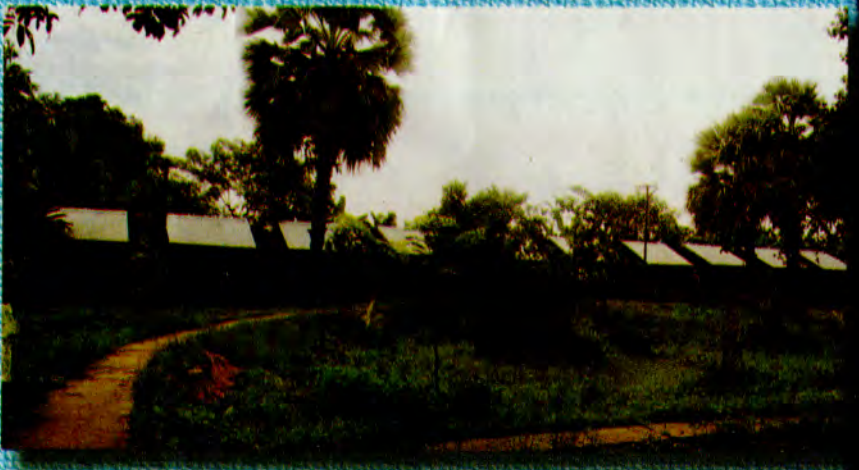
သဲအင်းဂူဝါတွင်းအဓိဋ္ဌာန်ဝင်ရန် ဂူကျောင်းတော်များပုံ။