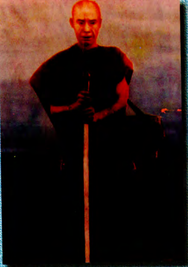
ပထမမူလကမ္ဘာ့ ဌာနစရိယ ဆရာတော် ဦးဥက္ကဋ္ဌ