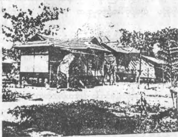
သဲအင်းဂူရှေးဦးပထမ စံကျောင်းနှင့် ဓမ္မာရုံ