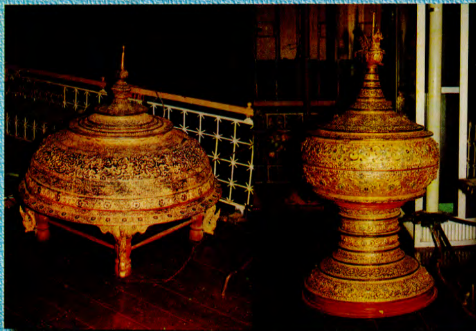
ကွမ်းဆုပ်တော်ပို့