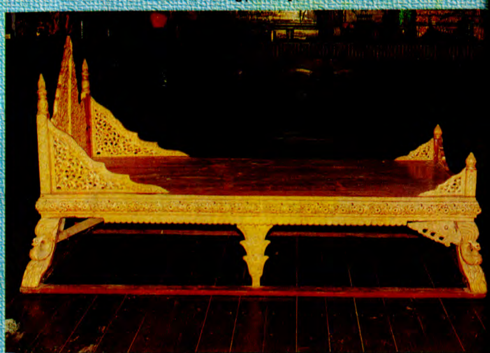
ဆွမ်းဆုပ်တော်ပို့