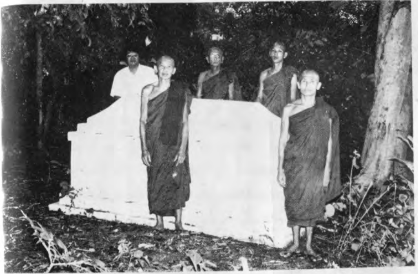
နောကုန်းသီချိုင်းတွင် မိမိစိတ်ကြောင့်ဖြစ်သောကြောက်စိတ်ကို မိမိစိတ်က ပြန်လည်ထိန်းသိမ်းနိုင်ခဲ့ပုံ (ပန်းချီ မေတ္တာတော်ဓာတ်ပုံတိုက် (တ/ဥက္ကလာပ)