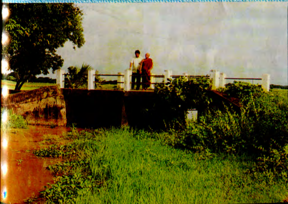
အင်းကူးတံတားရောက်သောအခါ လေးကျွန်းဓမ္မစင်္ကြာရှင်ငေတီတော်နှင့်