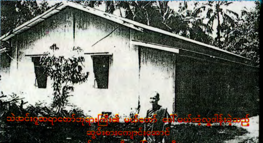
သဲအင်းဂူဆရာတော်ဘုရားကြံ၏ ပထမတော် ငေါ်မော်ဆုံလူဒါန်းခဲ့သည့် ဆွမ်းစားကျောင်းတော်