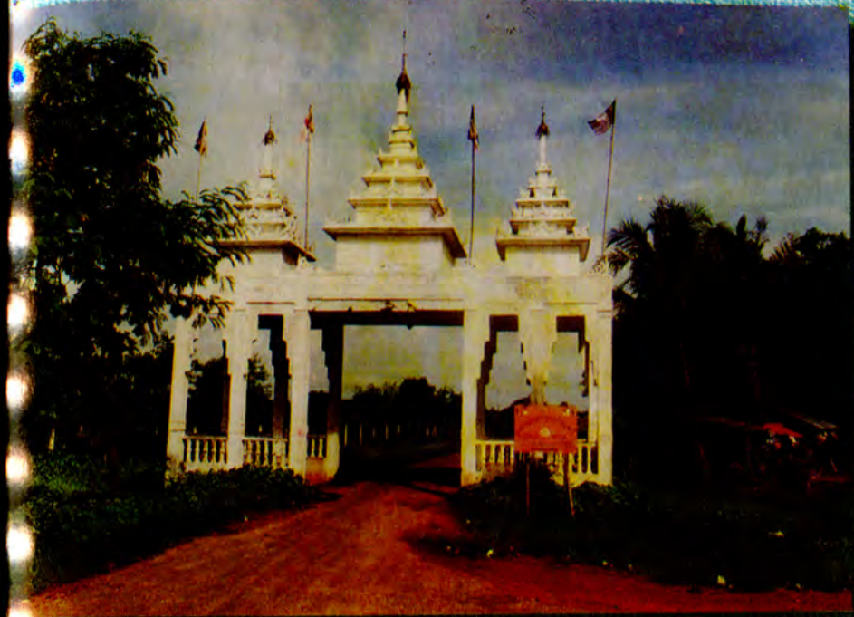
သဲအင်းဂူမှန်ဦး