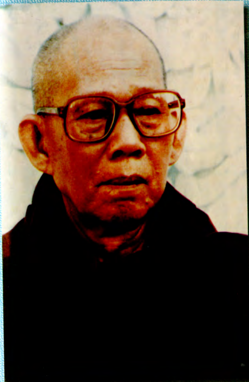
ဘဒ္ဒန္တဝါယမ သက်တော်ရှည်မဟာထေရ် မှော်ဘီမြို့၊ သံအင်းဂူ ကမ္မဋ္ဌာန်းကျောင်းတိုက် ပဝါနမဟာနာယက