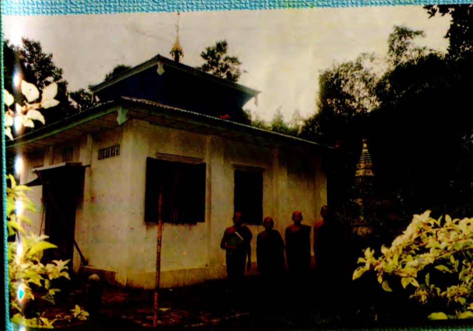
နောကုန်းကျေးရွာ ကျောင်းလေးဘုန်းကြီးကျောင်းသိမ်တော်၊