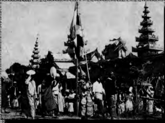
မူလသီအင်းဂူဆရာတော်ကြီးခန္ဓာဝန်ချစ်ဦး ရှေးဟောင်းတော်ပုံများ