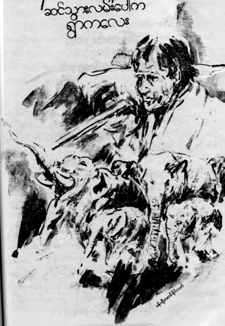
ဖိုးစိုအောင်ပိုင်စာရေး