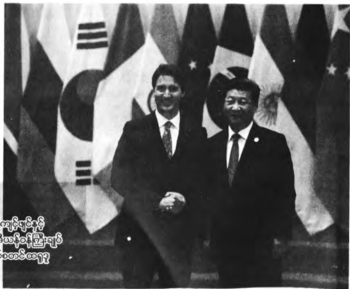
ဂိုကျင့်ပျင်နှင့် ကနေဒါသန်ဝန်ကြီးချုပ် ဂျပ်စတင်ဆရူဒူ