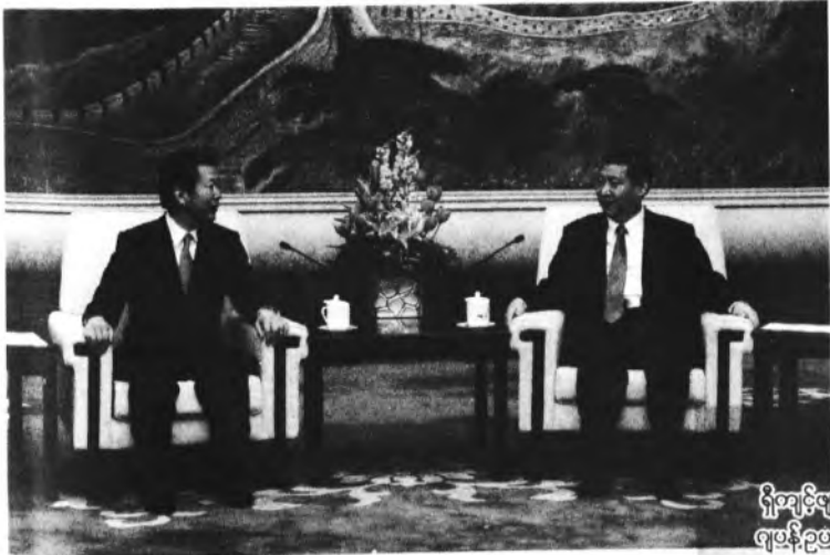
ရှီကျင့်ဖျင်နှင့် ဂျပန်ဥဗ္ဗစဒပြု နာစူအို ယာမာဂူချီ