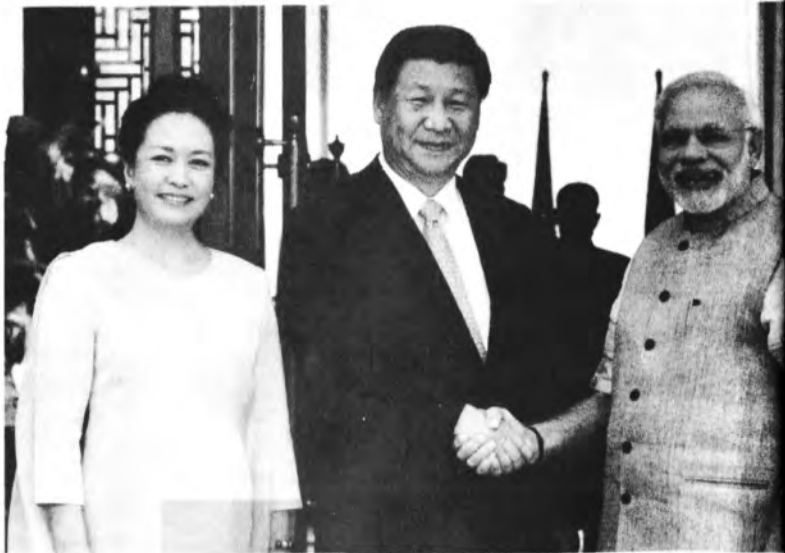
ရိုကျင့်ဖျင်တို့ ဇနီးမောင်နှံနှင့် အိန္ဒိယဝန်ကြီးချုပ် နာရန်ဒြာ မိုဒီ