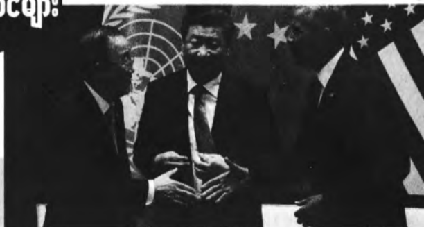
ရှီကျင့်ပျင်၊ အိုဘားမားနှင့် ဘန်ကီမွန်း