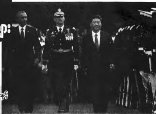
ရှီကျင့်ဗျင်၊ အိုဘားမားနှင့် ဂုက်ပြုတင်ဖွဲ့