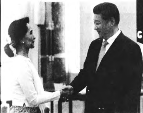
ရှီကျင့်ဖျင်နှင့် ဒေါ်မအောင်ဆန်းစုကြည်