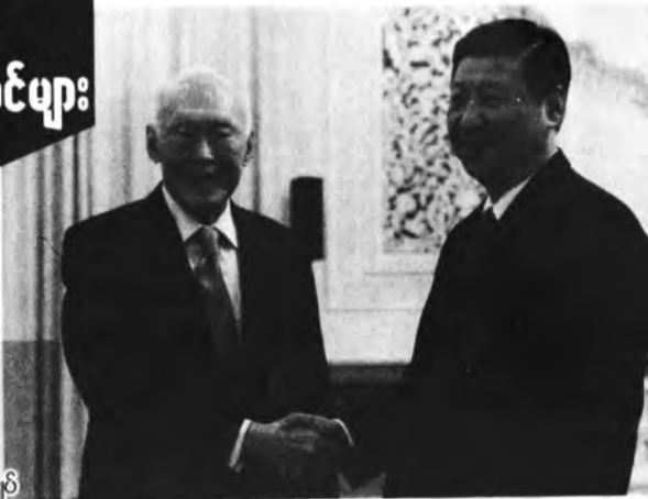
ရှီကျင့်ဖျင်နှင့် စကာပူဝန်ကြီးချုပ် လီကွမ်ယု