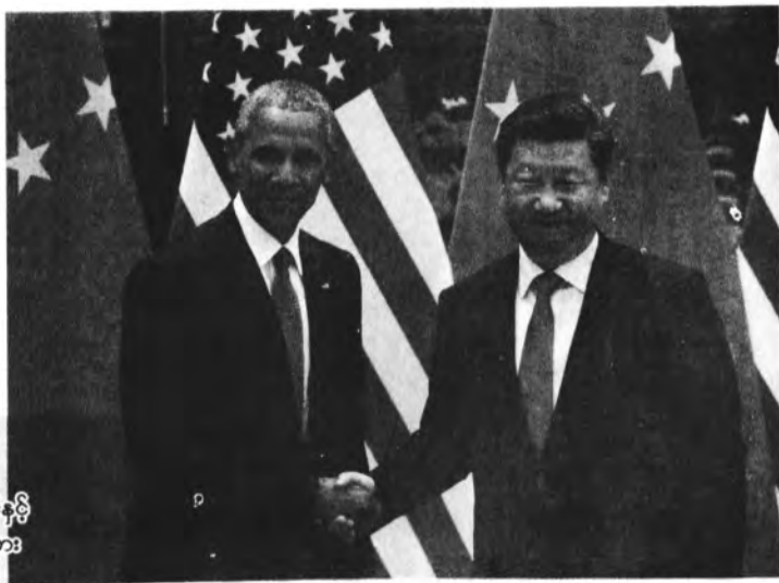
ရှီကျင့်ဖျင်နှင့် အိုဘားမား