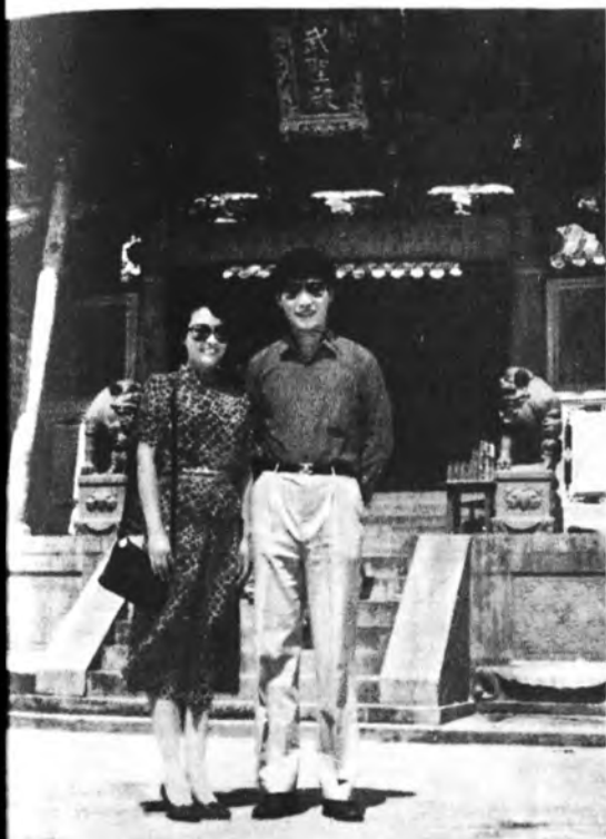
ရှီကျင့်ဖျင်တို့ ဇနီးမောင်နှံ၏ ငယ်ဘဝ မှတ်တမ်းဓာတ်ပုံ