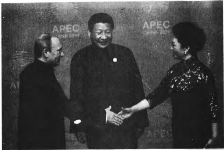
ရိုကျင့်ဖျင်တို့ ဇနီးမောင်နှံနှင့် ရုရှားသမ္မတပူတင်