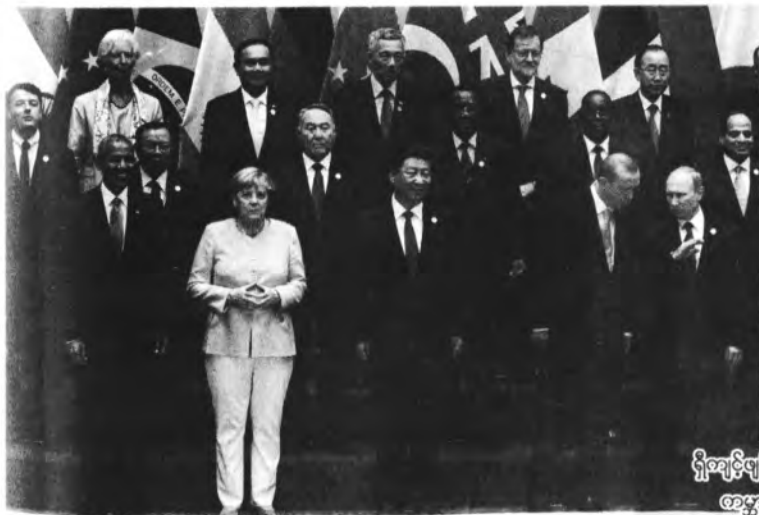
ရှီကျင့်ဗျင်နှင့် အမ္မာ ခေါင်းဆောင်များ