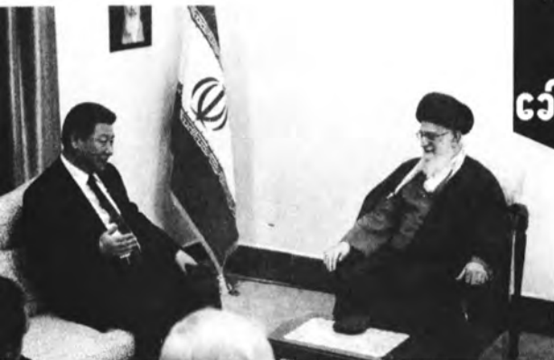
ဂိုကျင့်ပျင်နှင့် အီရန်ခေါင်းဆောင် အယာတိုလာအလီခါမေနီ