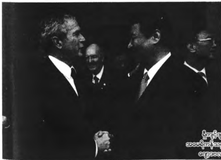
ရှီကျင့်ပျင်နှင့် အမေရိကန်သမ္မတဟောင်း ဂျော့ဗုရှ်တို့