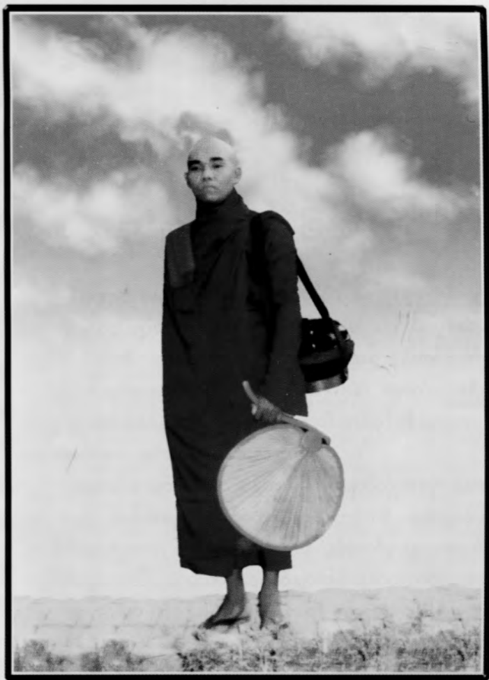
ပိဗ်သု မွေဒုတ- အရှင်အာပိက္ခဏ၊ ဟင်္သာတ