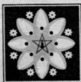
ပျိုးခင်းစာပေ