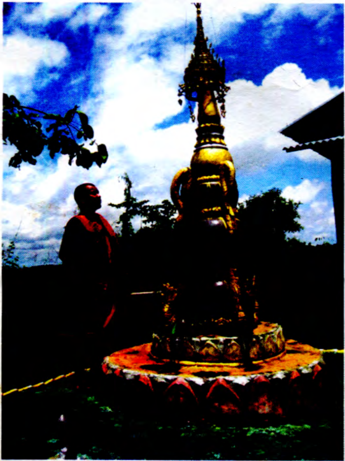
အမျိုးသမီးတို့ဘဝတည်ရာအတွက် နေ့စဉ် ဘိုးဖခင်တော်များ ဟောပြောချက်များ