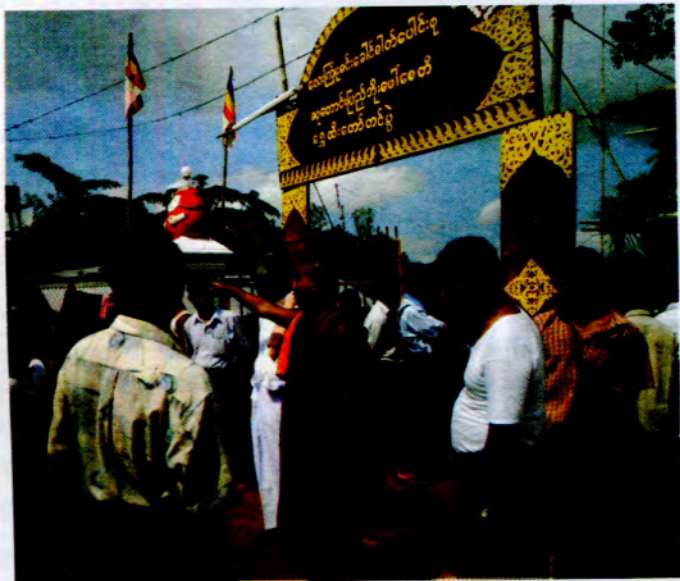
ဓမ္မပိတင်္ဂါပေးတော်