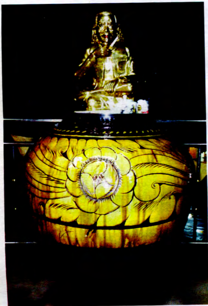
ရွှေမိန်းမိန်းဆောင်ရွက်