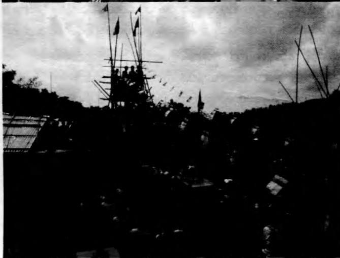
အမျိုးသမီးတို့အေအယ် ဝါးတော်တင်ပွင့် ပါးသတ်များဖြင့် အထူးဆည်ကားကုသသည်။