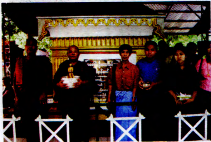
ဘုန်းပေါက်ဆိန်ကလေးတိုက်