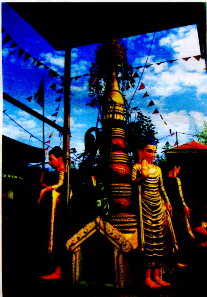
လေးကြိမ်နှစ်ခေါင် ဓာတ်ပေါ်ရာ ဆုတောင်းပြုရာ အမျိုးသမီး အိုးလှော်စဉ်