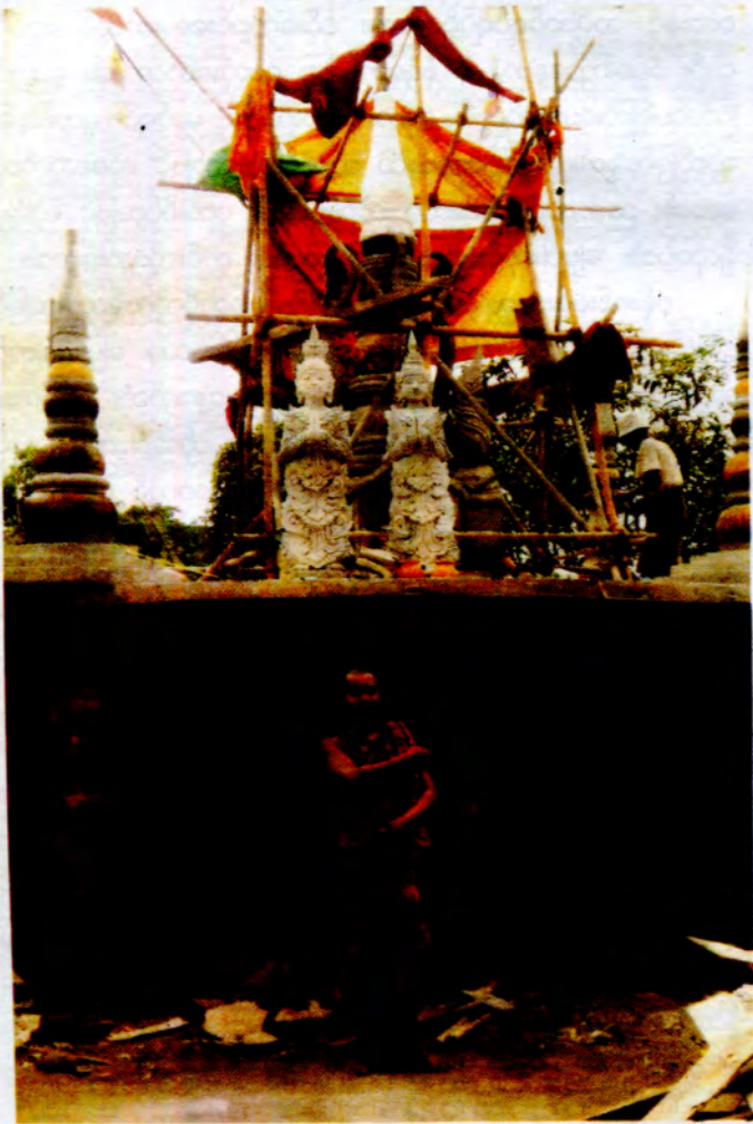
ရွှေတောင်ဆီလှေတိုက်