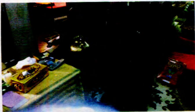
ဖတ်တော်တိုက်အရာတော်ထဲမှ ဖတ်တော်များ အလှူခံပုံ