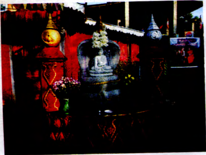
ရွှေပိတ်ဆိန်ကလေးတိုက်