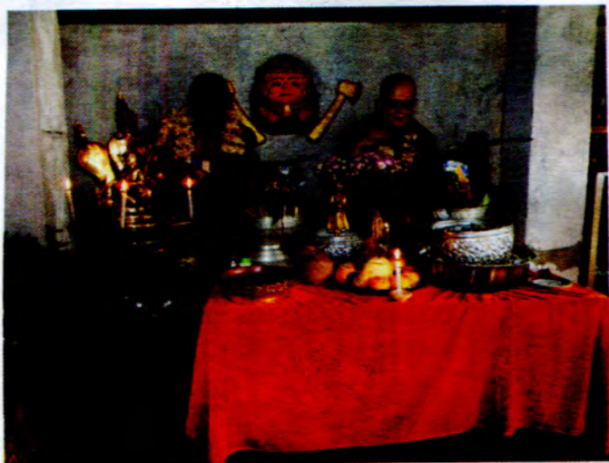
အဘတိုစင်္ကြံဆင်ဆင်နှင့် ဘုန်းဘုရားကြီး ဘုန်းပေါက်ဆိန်