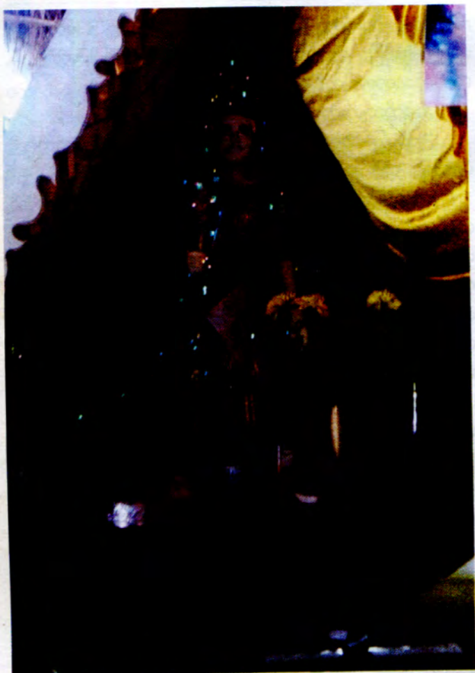
အဘဇာတုပွဲကြီး၏ ပုံတူကို ရွှေပေါက်အိမ်ကောင်စင်၌ ထုလုပ်ထားရှိပြီး သေဆုံးသူတောင်းပန်က ဆုတောင်းပြုကြပါသည်။