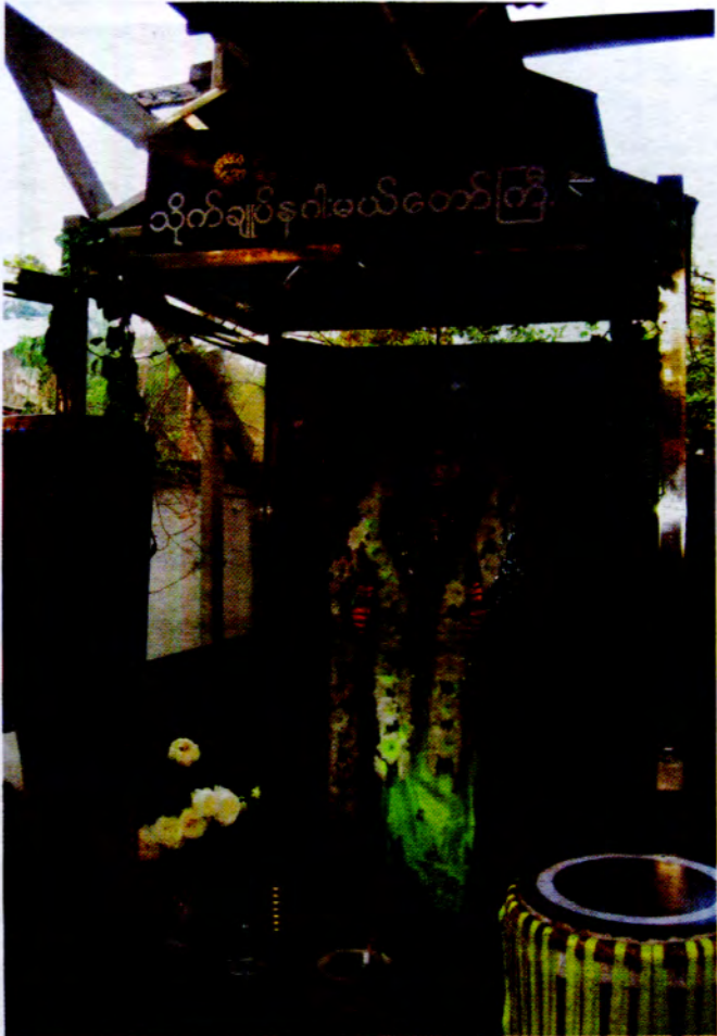
ဘောဂတီ မုဂါမယ်တောင်ကြီးတွင် သေဆုပေးတင်ဖိက ဆုတောင်းပြုခဲ့သည်။