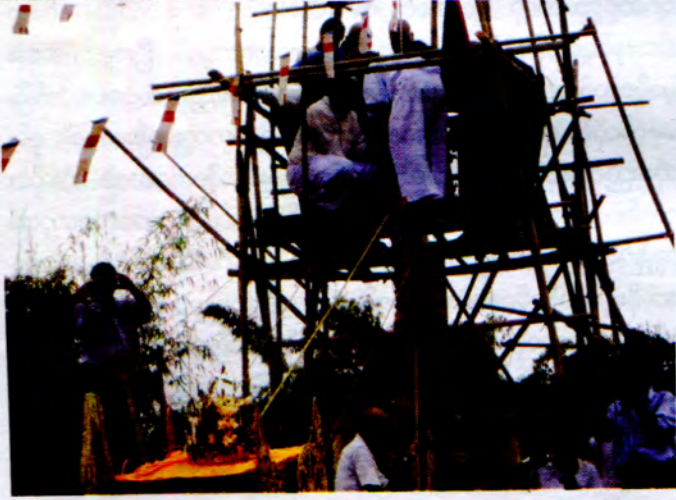
ပညာရေးဆိုင်ရာပညာရေး