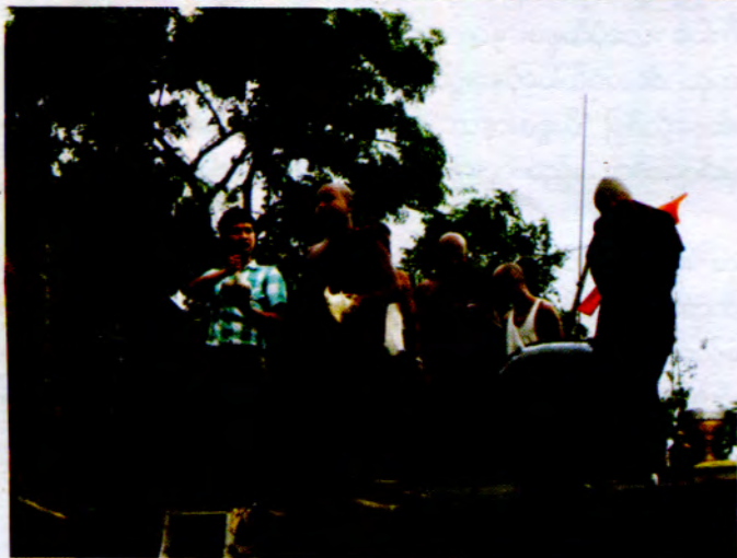
ရွှေပေါက်ဆီနီအားပေးပို့ဆောင်