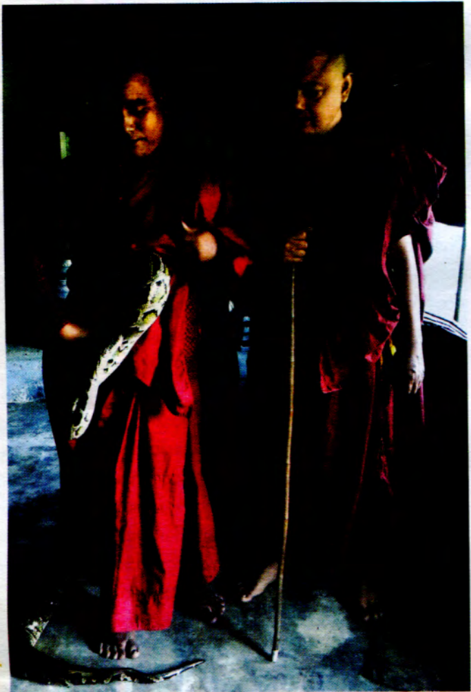
ဗုဒ္ဓပျက်ဆုံးစာပေပျက်