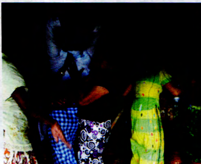
လူပျက်ဆိန်ဆေးထုတ်