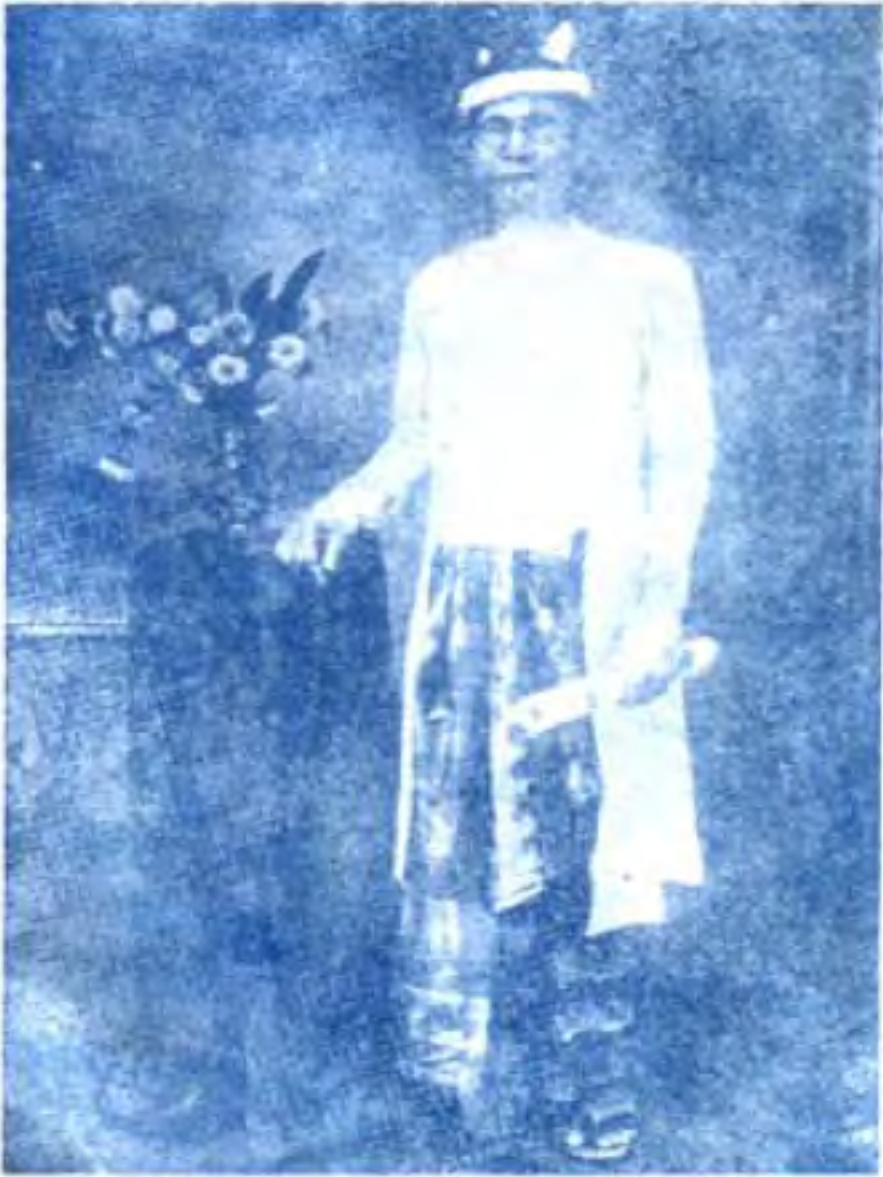
(ဗျော်ငိဆရာသိန်းကြီး)