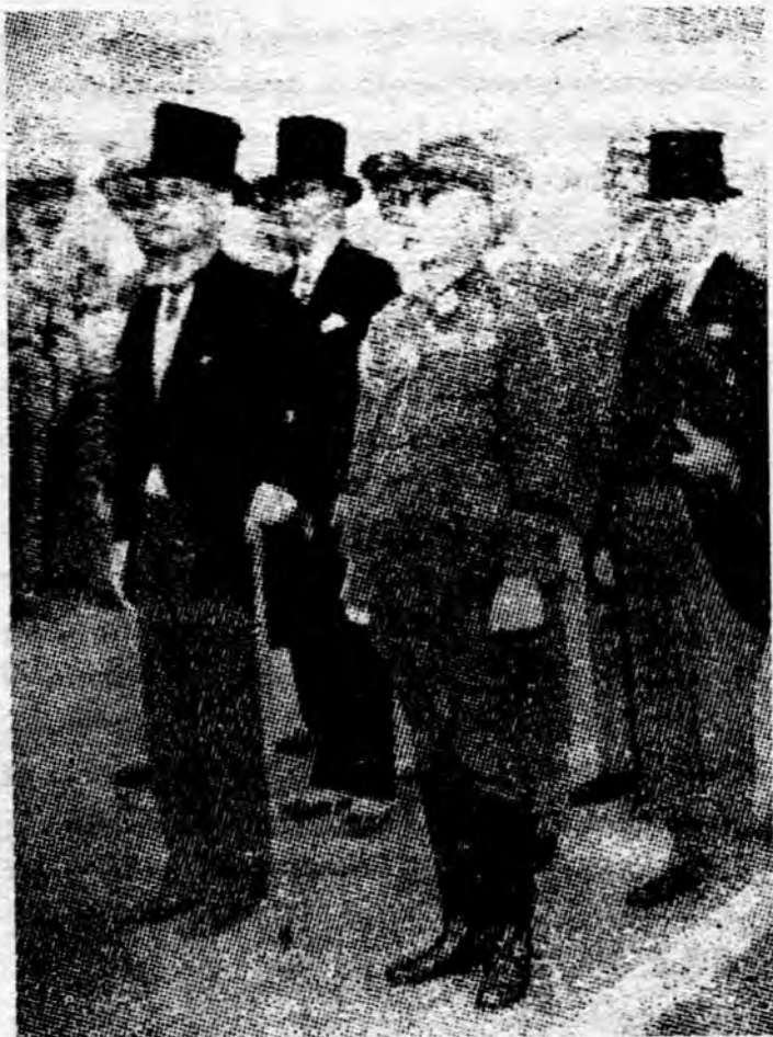
လက်နက်ချကြောင်း လက်မှတ်ရေးထိုးရန် ဂျပန်နိုင်ငံခြားရေးဝန်ကြီး မစ္စတာရှိဂေမစ်ဆုနှင့် ဗိုလ်ချုပ်ကြီးအုပိဖိုတို့ အမေရိကန်စစ်သေနာပတိ ဗိုလ်ချုပ်ကြီးမက်အာသာထံသို့ လာရောက်ကြစဉ်။