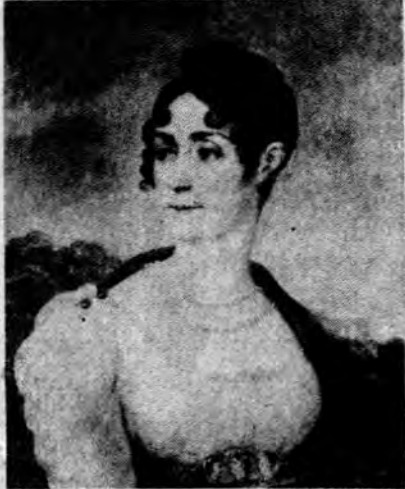
ရာပြည့်စာအုပ်တိုက်