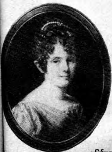
ရာပြည့်စာအုပ်တိုက်